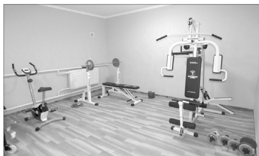
Такі тренажери годі ще знайти в районі!