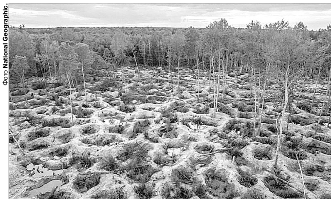
Волинян відлякують такі дикі пейзажі, які вже споглядають жителі Рівненщини.

«Поки не буде згоди жителів на видобуток бурштину на території Любешівської ОТГ, і влада буде проти цього.»