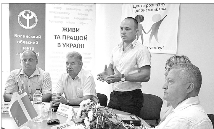
Представники міської, районної влади та обласного і міськрайонного центрів зайнятості вітали кращих підприємців.