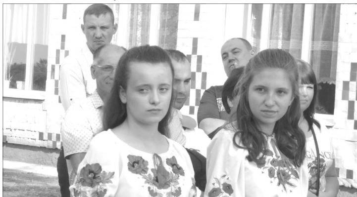
... а у дев'ятикласниці з упевненим поглядом у майбутнє.