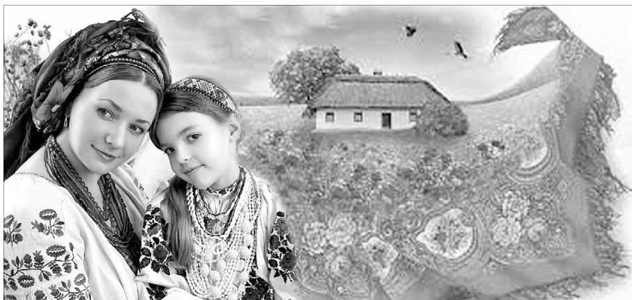
Це не просто головний убір — це магічний оберіг.