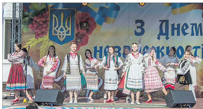
Дівчата в старовинному одязі виступили «на біс».