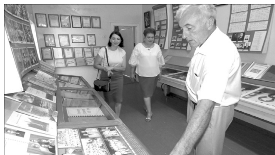
Музей історії села – гордість колишнього директора.