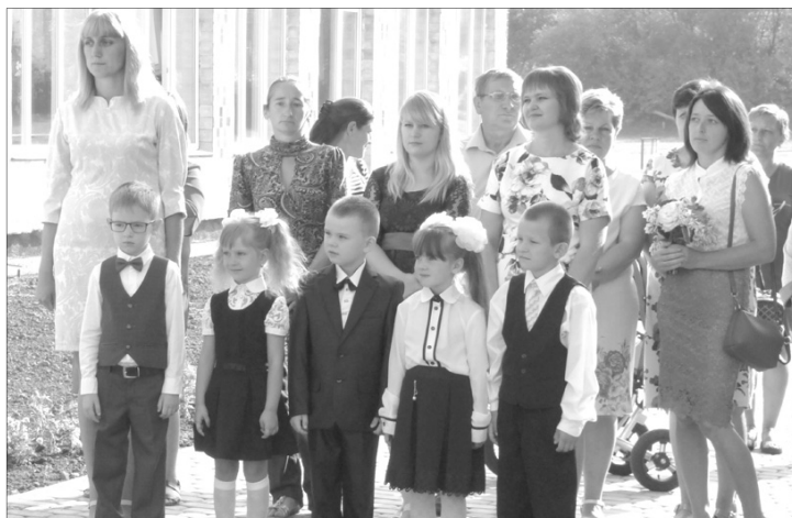
Першокласники малі – з допитливими оченятами...

Тим часом учора наші кореспонденти побували на святі Першого дзвоника у ЗОШ I-II ступенів села Хорлуки Ківерцівського району, де 47 школярів у 9 класах і 13 осіб персоналу. На лінійці – п'ятеро першокласників (трьох з них – 5-літки) і лише двоє дівчат-ви-