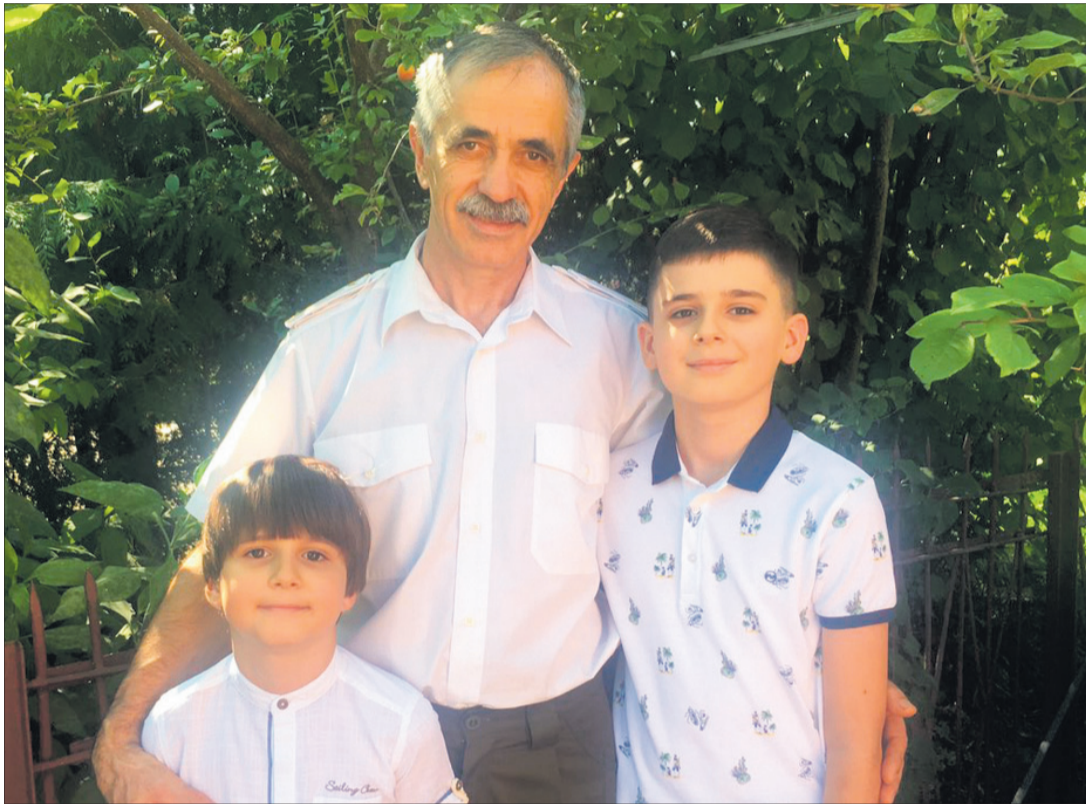
Може, онуки підуть стежкою дідуся і оберуть професію лісівника-практика — потомствено у родині Прасюків.