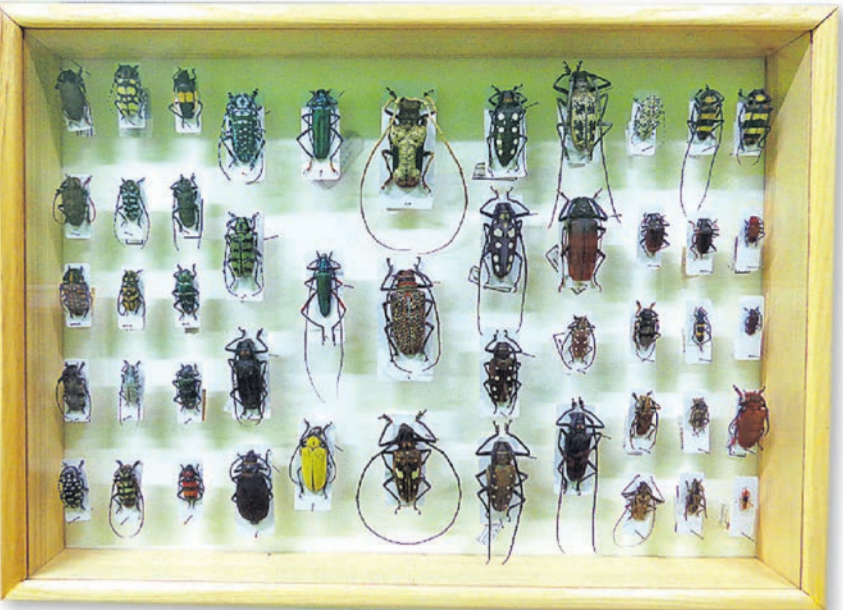
Навряд чи екзотичні жуки з усього світу знали, що стануть окрасою колекції турійчанина.