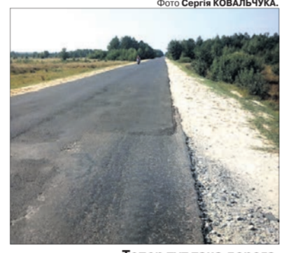
Тепер тут така дорога.