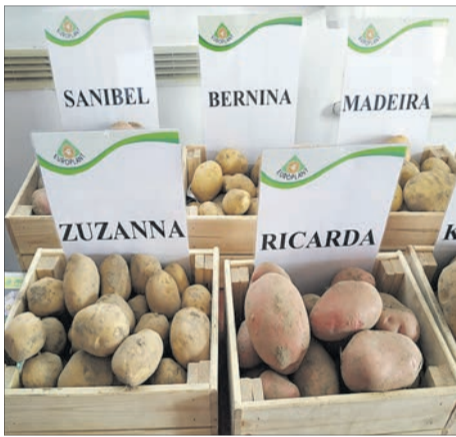
Кожен виробник може вибрати собі насіння сорту, який йому до вподоби.