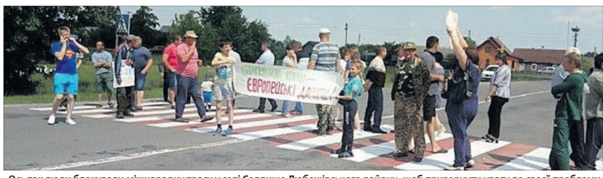
Ось так люди блокували міжнародну трасу у селі Седлище Любешівського району, щоб привернути увагу до своєї проблеми.