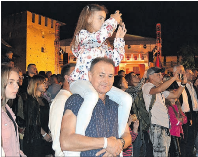
І тато щось цікаве побачив, і донька не може відірватися від шоу!

Ще за годину до старту мистецького дійства, яке цього року було присвячене 590-й річниці з'їзду європейських монархів у Луцьку, під замком уже гуртувалися поліцейські, розгорталися намети, продавалися квитки... Врешті — традиційна атмосфера перед початком розважального заходу. А ось за стінами фортеці все було по-іншому: лицарі, придворні, королі, блазні, духовенство... Гучний дзвін, барабани... на сцену виходять кликуни. Вони виголосують, що древній Лучеськ «чолом б'є» високим європейським гостям, глядачів знайомлять із сильними світу цього у Середньовіччі. Починається театралізоване дійство у виконанні акторів Волинського облмуздрамтеатру ім. Тараса Шевченка. Паралелі того, що відбувається на сцені, із сучасною політичною ситуацією очевидні: загроза зі Сходу, Луцьк — форпост на шляху агресора, Європа вирішує