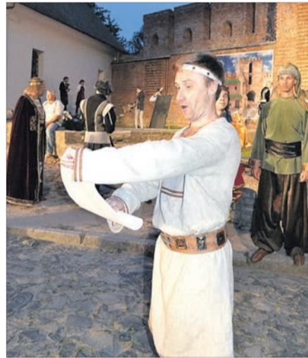
Кликун за кілька віків майже не змінився.