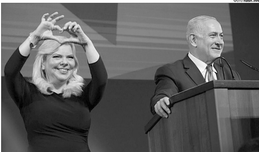
Пані Саро, зображати серце — це ще не значить мати щось добре у ньому.

Насправді Сара Нетаньяху зневажила не тільки нашу традицію. Вона образила пам'ять понад шести мільйонів євреїв, яких убили нацисти, і чотирьох тисяч українців, котрі державою Ізраїль визнані Праведниками світу за допомогу своїм громадянам у період Голокосту. Тим паче, що Сара як дружина провідного в країні високопосадовця опікується жертвами фашистських переслідувань і є донькою відомого письменника, педагога і фахівця з Біблії Шмуеля Бен-Арци, родом із Польщі. Він — чи не єдиний з родини, хто вижив під час Другої світової війни, виїхавши до Ізраїлю. У період Голокосту багато українців, ризикуючи власним життям, допомагали євреям рятуватися. Чимало наших земляків переходили від нацистського режиму цілі