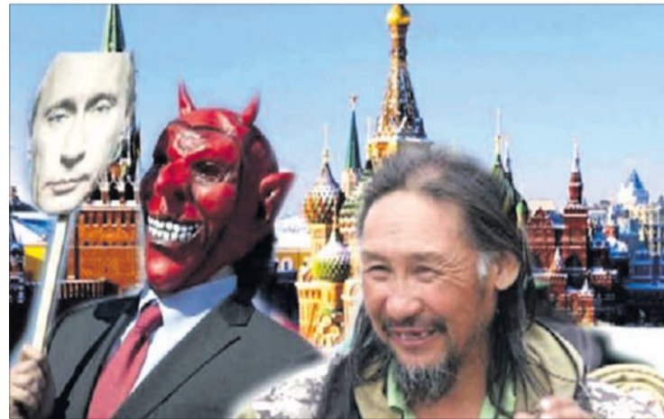
Цікаво, за скільки кілометрів до Москви його зупинять остаточно?

Але це не зупинило Олександра — він іде далі. Бо твердо переконаний, що зле «шаманство» Путіна не здатен подолати жоден політик, а тільки інший шаман — такий, як він.