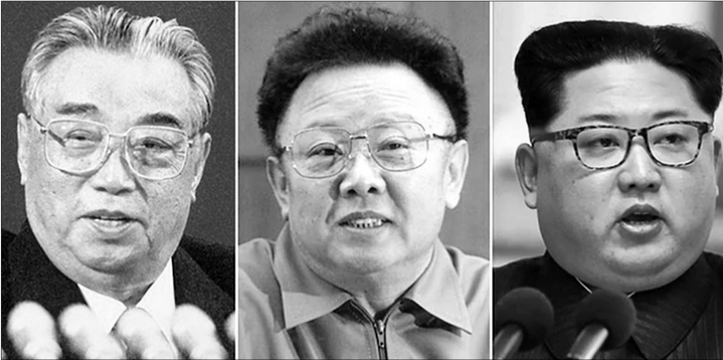
Три Кіми, яким належить Північна Корея останні 74 роки: (зліва направо): Кім Ір Сен, Кім Чен Ір та Кім Чен Ін.