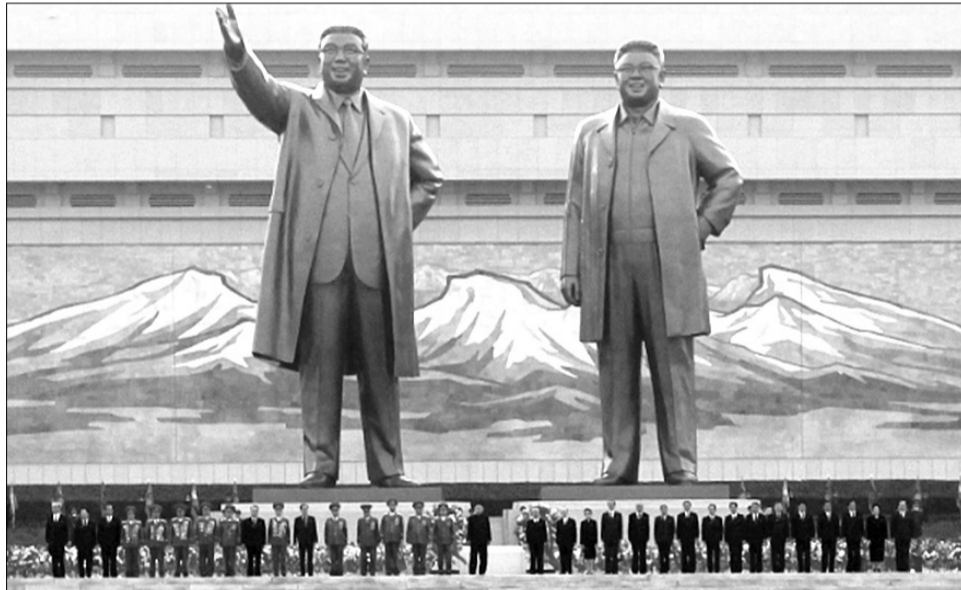
Гігантські бронзові статуї Кім Ір Сена та Кім Чен Іра у Пхеньяні. Тіла ж двох диктаторів знаходяться у прозорому мавзолеї в Палаці Сонця — колишній резиденції Кім Ір Сена.

Та головне, напевне, те, що у Москві його знали як надійного сталініста. Один із корейців-офіцерів 88-ї бригади Пак Сен Хун згадував: «Нам було ясно, що при всіх інших позитивних якостях, які враховува-