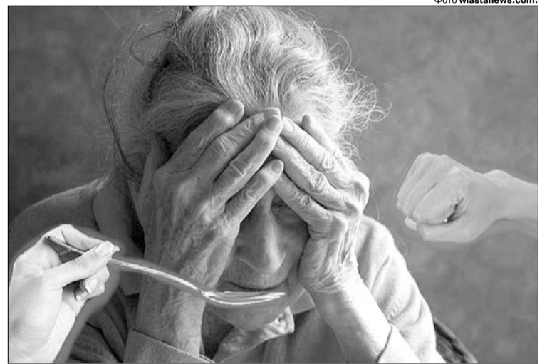
«Їж – або...»

НЕБЕЗПЕЧНІ ДЛЯ ЗДОРОВ'Я. У Харкові доглядальниця з педагогічною освітою