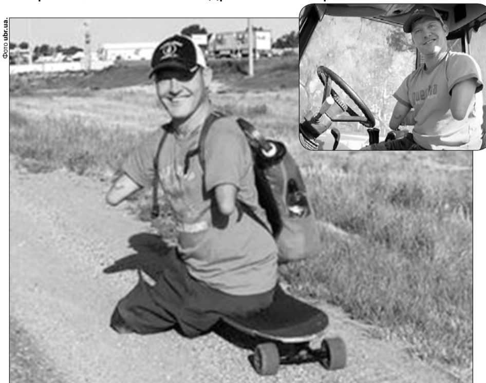
Бадьорий і усміхнений Кріс Кох випромінює оптимізм.

Торік ми розповідали вам про зустріч із Ніком Вуйчичем, який хоч і народився без рук і без ніг, але став мільйонером завдяки неймовірному таланту — надихати інших любити життя. Він видає книги, які стають бестселлерами, займається бізнесом і дуже багато спілкується з людьми. Син сербських емігрантів, який у дитинстві намагався вкоротити віку через свої вади, сьогодні живе у США, одружений, є щасливим чоловіком і батьком чотирьох дітей. Нік Вуйчич побував чи не у всіх країнах світу, 6 разів уже відвідав Україну, зо-