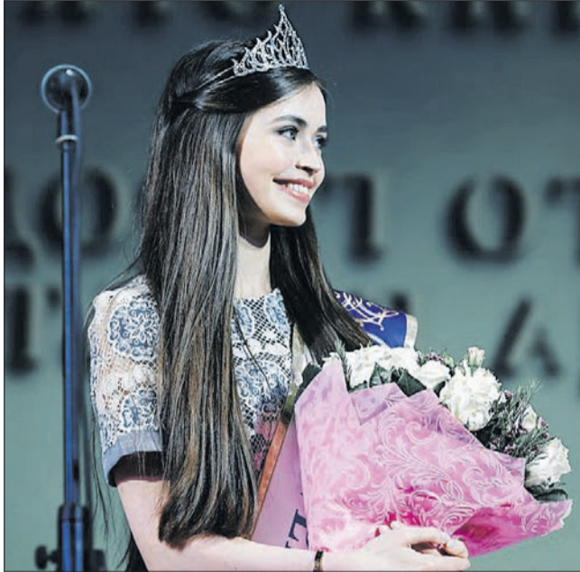
У президента Білорусі – чудовий смак. Правда, і вам подобається ця краля?