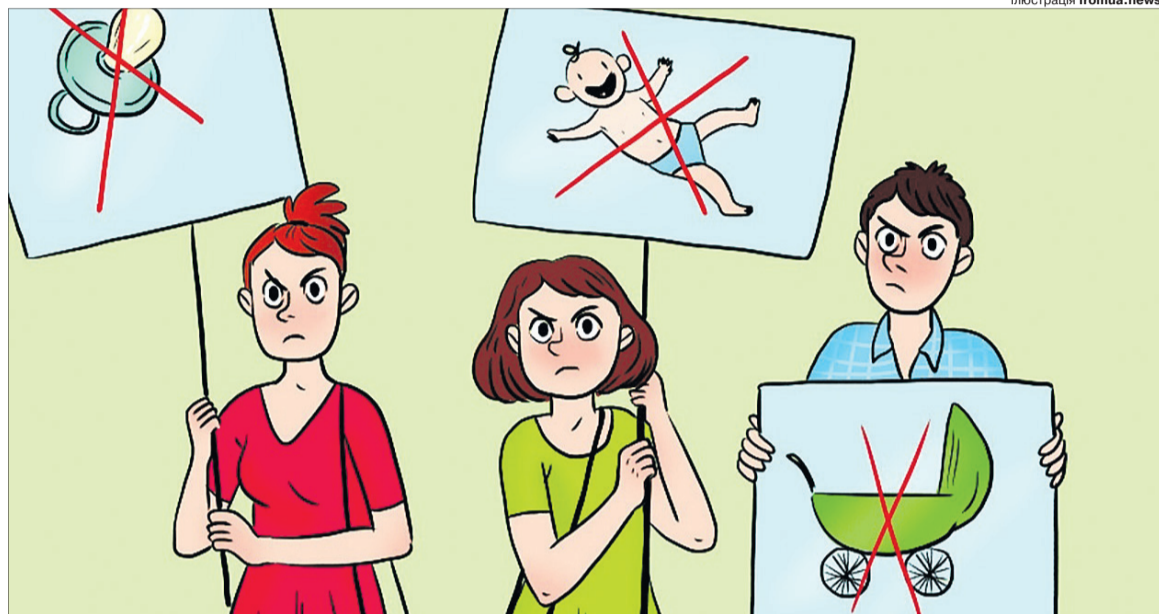
Кожен дуріє по-своєму.

Ідеологія чайлдфрі (з англ. — вільні від дітей) знаходить усе більше прибічників в Україні. Вони заявляють, що над усе цінують свободу і не хочуть обтяжувати себе народженням та вихованням нащадків. Боротьба з перенаселенням планети чи звичайнісінький людський егоїзм? Спектр причин «чому не народжувати» дуже широкий, тому кожен із чайлдфрі обирає ту мотивацію, яка йому до вподоби, — від благородних поривань