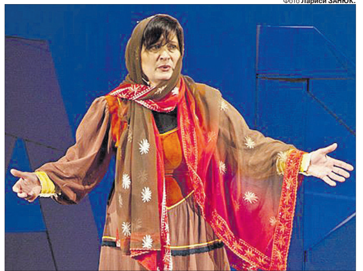
«А Богородиці легко було стояти на Голгофі й дивитися на смерть свого Сина?»