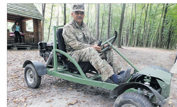
Винахідник на чудо-техніці вирушає на «тихе полювання».

« Свій винахід чоловік сконструював не з куплених старих чи нових запчастин — усе зробив сам. »