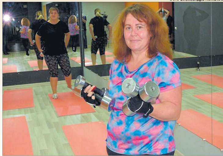
Чи втримає своє лідерство пані Тетяна?