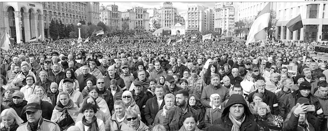
Лунає багатотисячне: «Ні – капітуляції!»