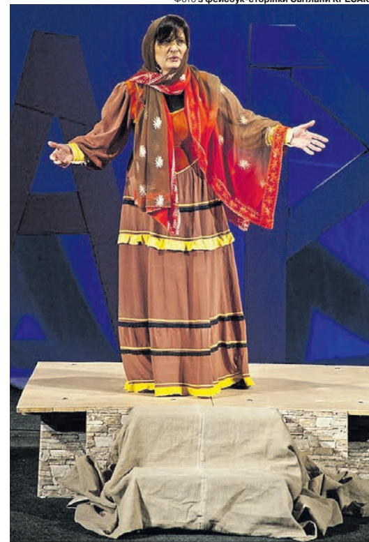
«Дивіться, о матері, що роблять іроди-царі...»