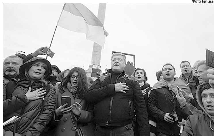
«І для мене, і для кожного з вас ворог — Путін».

«У Мінських домовленостях нема нічого про розведення військ. Зараз ініціатива, що ми по всій лінії зіткнення забезпечуємо розведення, — це страшна помилка. У нас облаштовані позиції збройних сил, ми входимо в зиму. Фортифікаційні споруди, які ми будували.