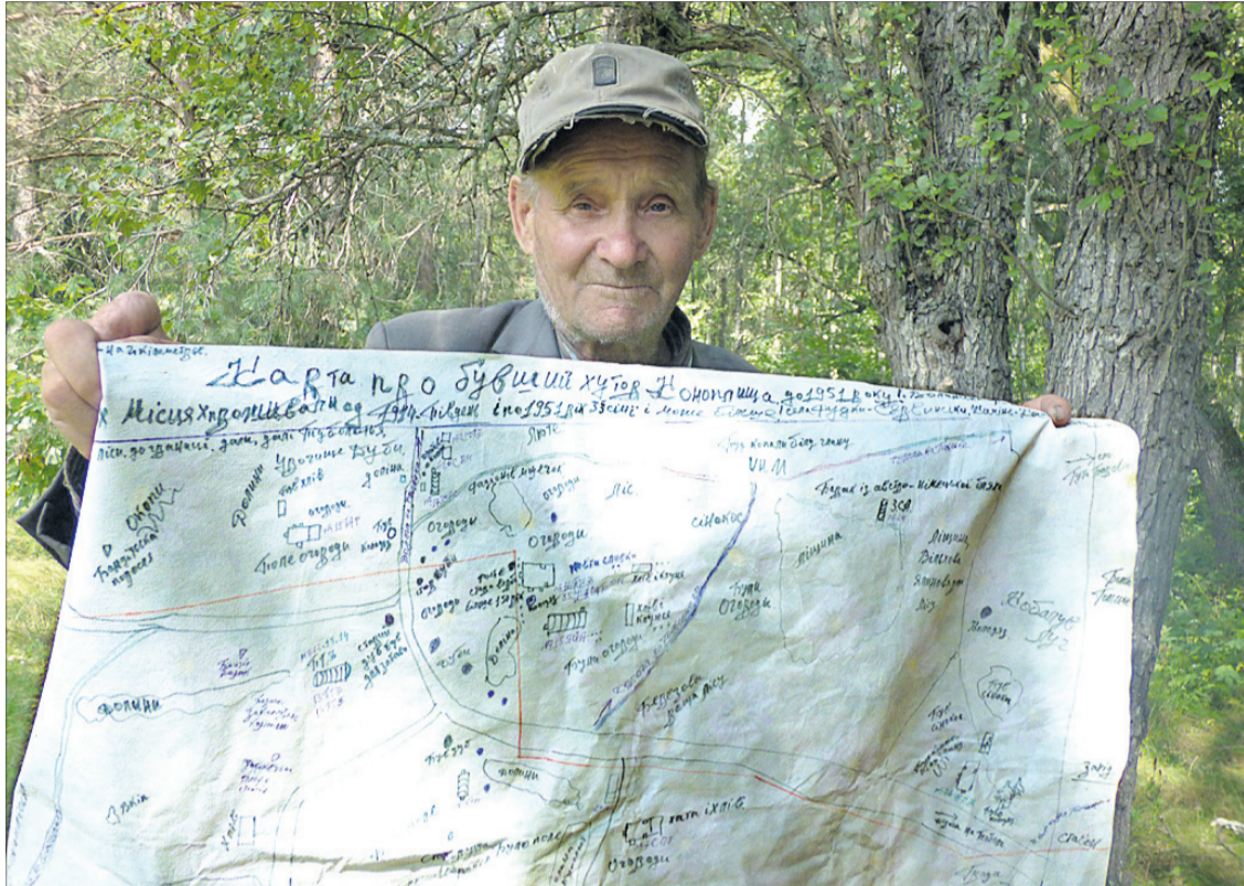
Складав цю мапу чоловік за розповідями односельців, старших за нього.