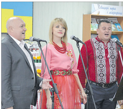
Ковельські співаки вразили присутніх своїми голосами.