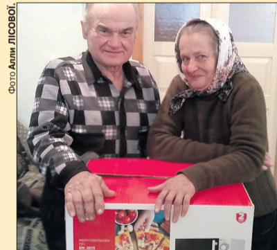
«А тепер разом із «Волинню» і «Цікавою газетою» ми будемо читати «Так ніхто не кохав» і «Читанку для всіх!»

І ви не зволікайте та вигравайте: передплатний індекс – 30000