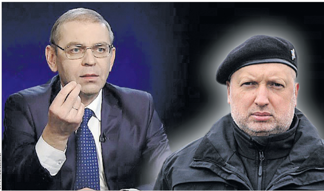
У чорному списку наближених до Кремля ЗМІ фігурують неугодні Москві імена: Сергій Пашинський, Олександр Турчинов, Андрій Парубій, Петро Порошенко...

Цей арешт викликав неабиякий резонанс. Колишній секретар Ради національної безпеки і оборони (РНБО) Олександр Турчинов назвав це рішення суду політично zaangażованим. А заступник голови партії Ярослав Юрчишин заявив: «Є всі підстави вважати, що керівництво ДБР намагається всіяко вислужитися