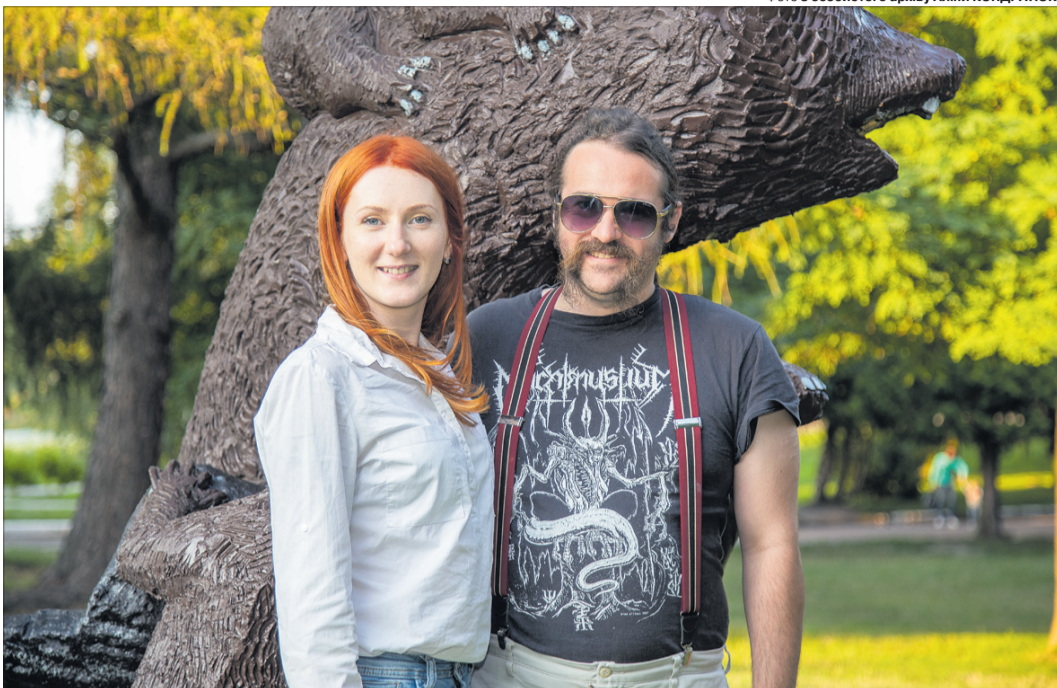
Інтернаціональна пара з радістю і цікавістю переймає традиції інших країн.