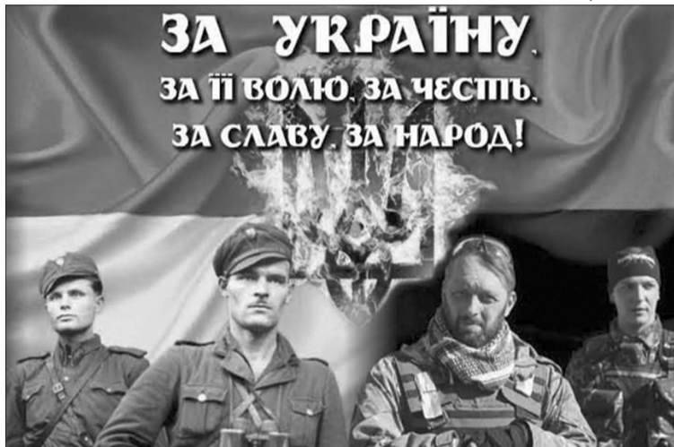
Героїчні історії вояків УПА надихнули на подвиг воїнів АТО.

Енкаведисти обережно почали переходити дорогу. І тут ми почули якийсь приглушений звук, а за ним вереск: