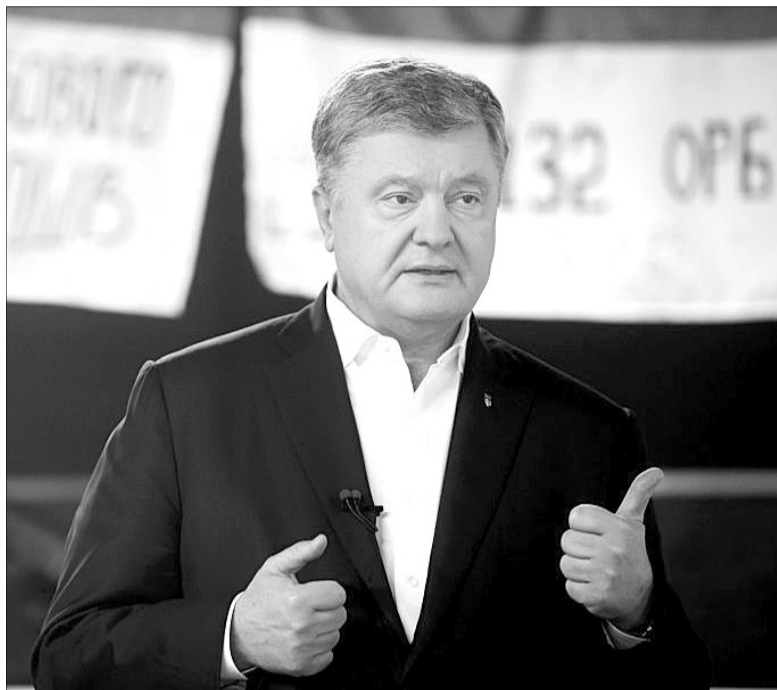
«Там кожен метр політич кров'ю українських героїв».

« Що простих рішень — нема. Що мир — це «просто припинити стріляти» — брехня. Що завершити все швидко — неможливо. Я сам колись мусив це визнати. »