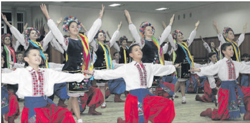
Ну як не замилюєшся такими танцюристами?!