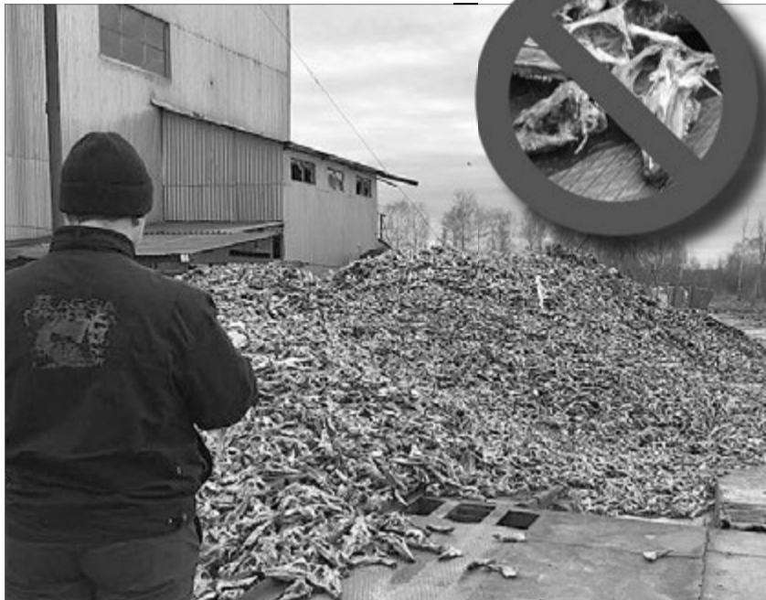
Сподіваємося, таких «пейзажів» у Ковелі більше не буде.

— Ми звернулися до державного підприємства «Укрветсанза завод» та «Укрпроспозживслужби» з вимогою терміново вивезти відходи, — розповідає ковельський міський голова. — Через деякий час їх дійсно почали вивозити, але не зрозуміло, за якими схемами. Щось відправляли у Костопіль, щось — у Жовкву, де є аналогічні заводи, щось в інші місця. Все це бачили жителі і, природно, обурилися. Але їхній гнів використали політики для свого