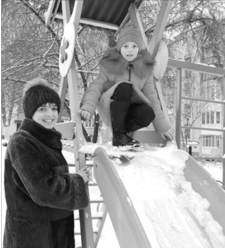
Разом із донечкою Інна радіє зимі.

— Те, що я майже не бачу, виявилось не найважчим випробуванням. На моїх очах порожніли ліжка пацієнтів діалізного центру, помиралі, не діждавшись пересадки, й молоді люди. Нирки моїх батьків мені не підійшли. Пішла на обстеження тьотя — хресна мама, але за станом здоров'я їй теж відмовили. Ми могли сподіватися лише на чужу донорську нирку.