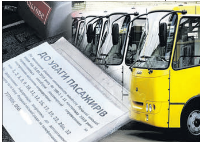
Поширюючи такі оголошення, маршрутники тиснуть на владу та пасажирів.