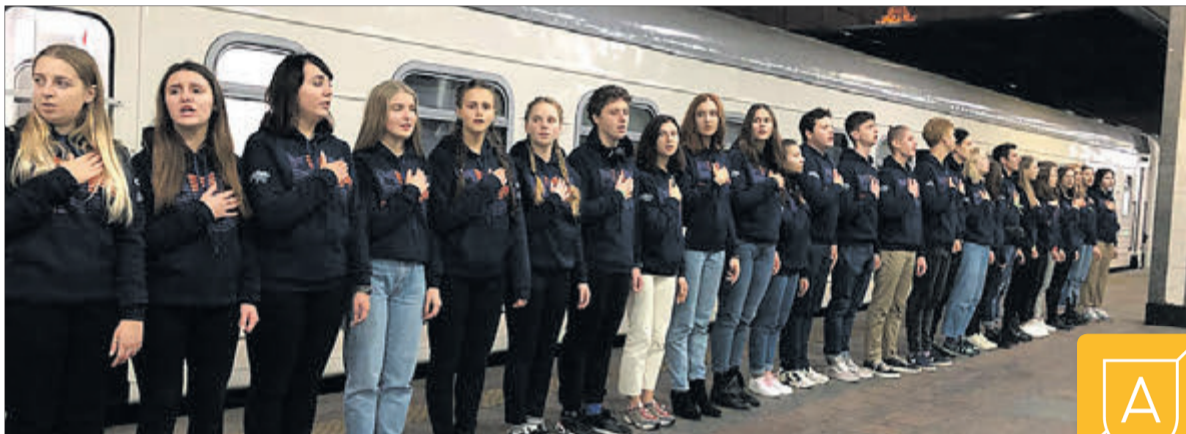
Студенти УАЛ співають гімн на вокзалі Києва перед від'їздом на форум у Маріуполь.