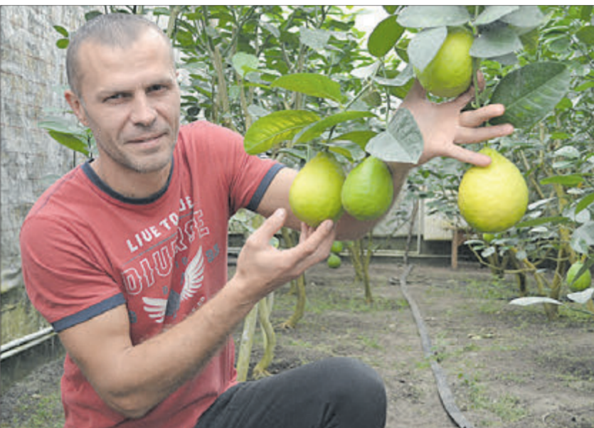
Отакі лимони ростуть у Княгининку.