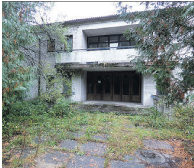
Колись ці приміщення приймали пацієнтів здравниці.