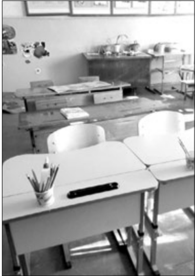
Дві парти для двох учнів нової української школи.