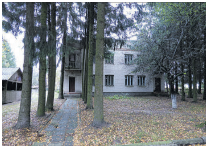
У цьому житловому будиночку на території недіючого санаторію і сьогодні живе колишній його працівник.

— Зараз санаторій перебуває на балансі Колківського лісгоспу, — каже Алла Гонтар, — тобто має власника, якому, здавалося б, і вирішувати його долю. Але це «вирішення» надто затягнулося. У такому випадку радонове джерело, яке належить народу, можна і потрібно використовувати, як і грязі. У мене є ідеї з цього приводу. Я шукаю інвестора (і він нібито вже є). Поки що роблять аналіз води в спеціалізованій лабораторії міста Одеси. Коли будуть результати і вміст радону підтвердиться, то плануємо відкрити невеличке виробництво з виготовлення води на реалізацію. Цим самим і робочі місця створимо, і буде пош-