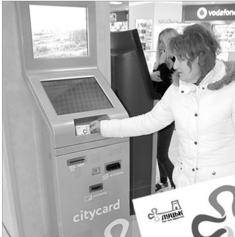
Придбати неперсоніфіковані електронні квитки можна ось у таких терміналах.

З 11 листопада картки для проїзду в громадському транспорті продаватимуться й у водія. Спершу вони реалізовуватимуть їх пасажирів.