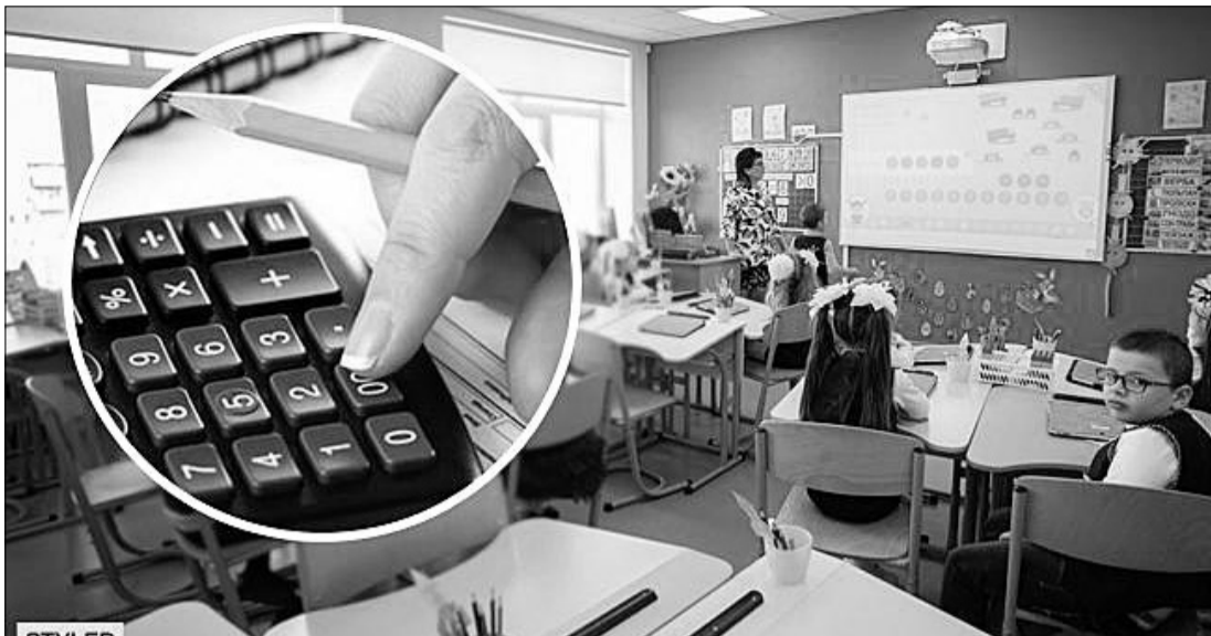
А колись у Зеленського говорили про зарплати по 4 тисячі доларів...