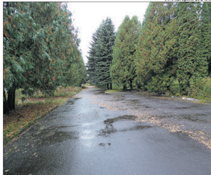
Лісвники вміють творити красу.