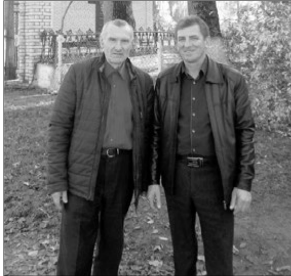
Директор школи і голова сільської ради — поруч у роботі і житті.