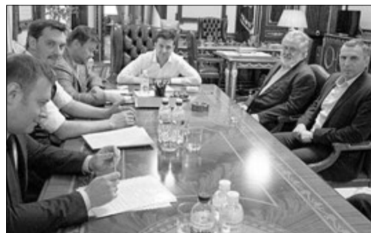
Нещодавно це фото облетіло усі ЗМІ: Ігор Коломойський на переговорах у кабінеті Володимира Зеленського.

«Як раціональна людина, Зеленський мав би сказати Коломойському, що є два варіанти — або той втілює за кордон, або його посадять за ґрати», — сказав Тарас Кузьо в інтерв'ю «Високому замку». — У Зеленського будуть великі проблеми через Коломойського. У вересні я брав участь у роботі форуму Ялтинської Європейської Стратегії (YES), яку проводить Пінчук (після анексії Криму відбувається у Києві. — Ред.), то на ланч прийшов Коломойський. Коли той