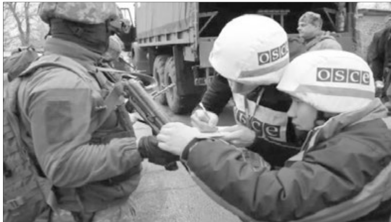
Представники ОБСЄ переписують номери зброї українських військових, які відходять із займаних позицій у Золотому.