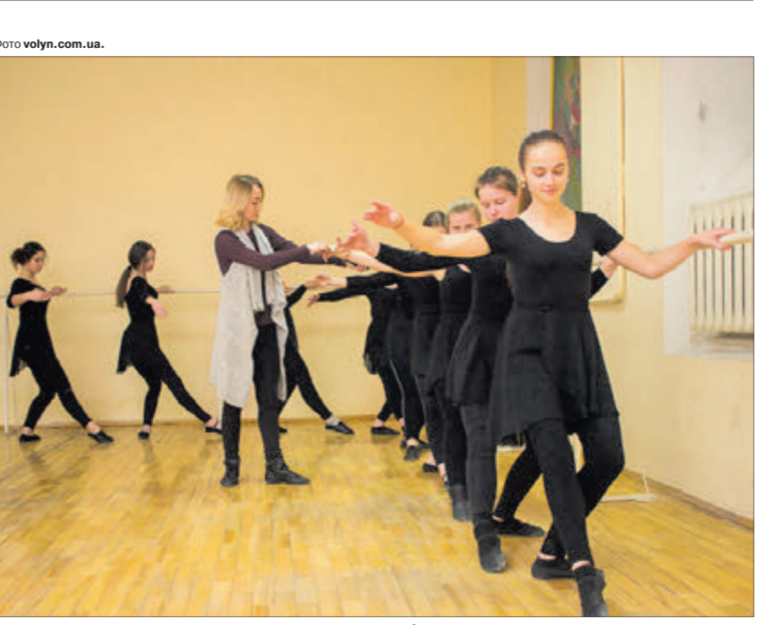
Яскравим виступам юних артистів передусе важка, наполеглива праця.