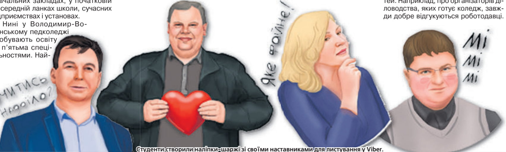
Студенти створили наліпки-шаржі зі своїми наставниками для листування у Viber.