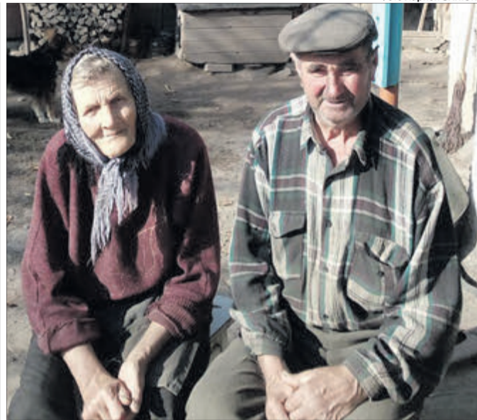
Господарі Теслюки і в 79 літ тримають господарку та обробляють землю.