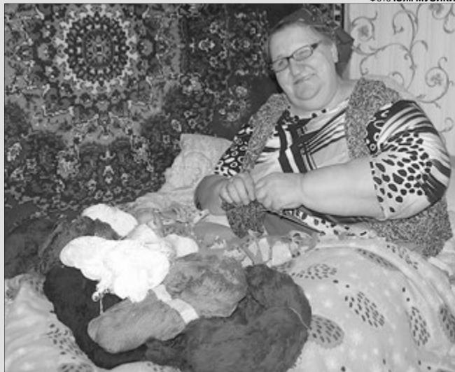
«Аби і теплі були, і тоненькі — в берці влезали», — плікується рукодільниця.