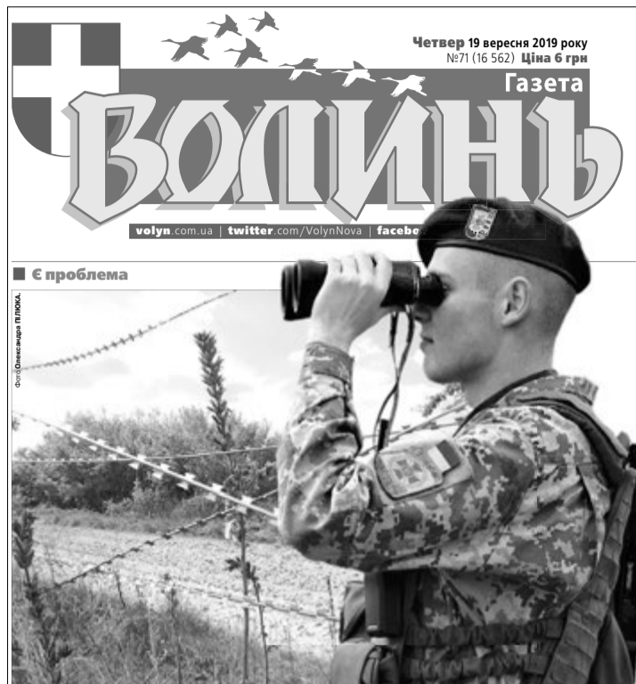
Жителі Рівного дивуються: «Від кого відгороджусь? Від Європи?»

Днями постійна комісія Волинської обласної ради з питань міжнародного співро-