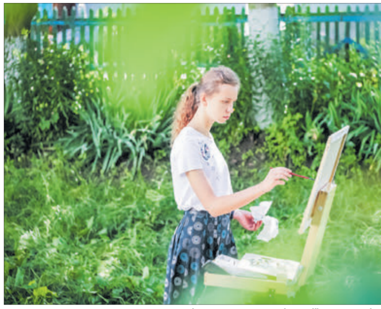
Навчання у педколеджі – це не лише довгі лекції в аудиторіях.