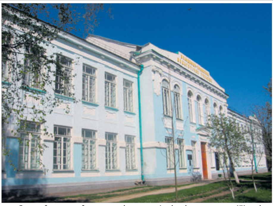
Головний навчальний корпус розміщено у пам'ятці архітектури початку ХХ століття.