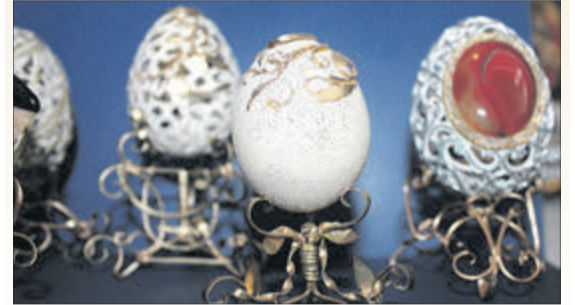
Аналогів цим роботам у світі немає.

Вишукана різдвяна колекція майстра із Володимира-Волинського (на фото), котрого вже охрестили місцевим Фаберже, вражає. Ангели, лики святих, сюжети про народження Ісуса Христа, поєднані з майстерно оформленою різними техніками яєчною шкаралупою, заворожують