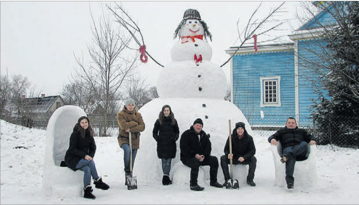
Команда творців радіє, що їхній гігант вдався ще й неабияким красенем.