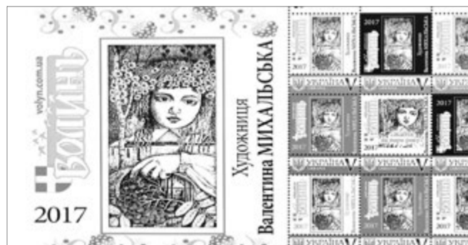
Та сама марка, яка стала мистецькою «цеглинкою» для собору у Волновасі.

впливові та небайдужі краєви, які створили фонд «Волинь-2014». За їхньої ініціативи на цю благодійну справу зібрано вже понад мільйон гривень. Тож споруда росте, тягнеться куполами до неба. У День святого Миколая було здійснено чин освячення накупольних хрестів Свято-Миколаїв-