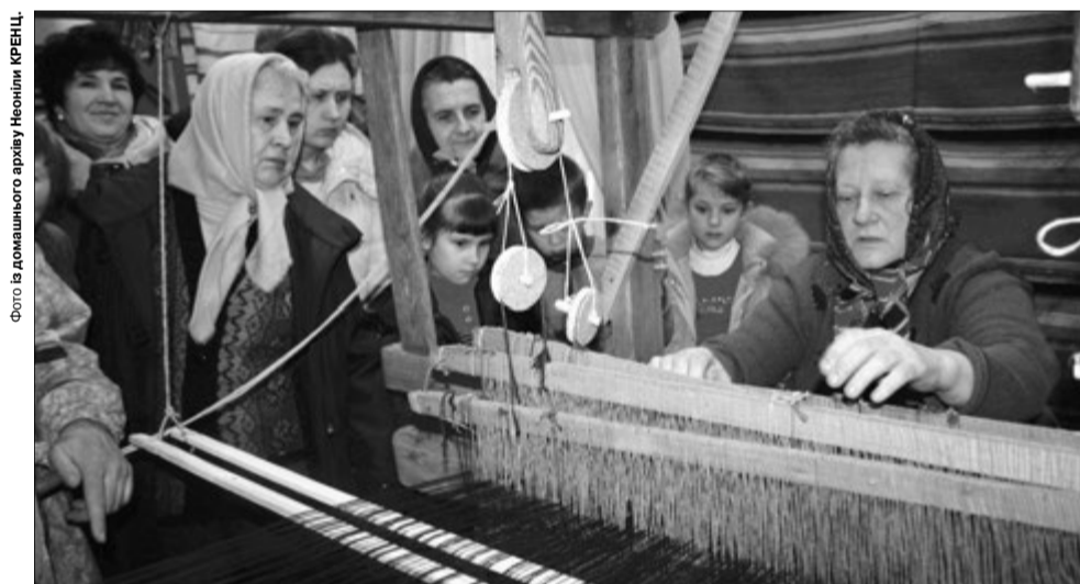
Майстер-клас із ткацтва у Затурцівському музеї — то нерозривна ниточка із давнини у сьогодення.