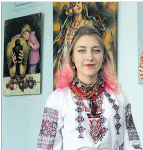
Талановита волинська мисткиня з родини художників-скульпторів Дацюків.