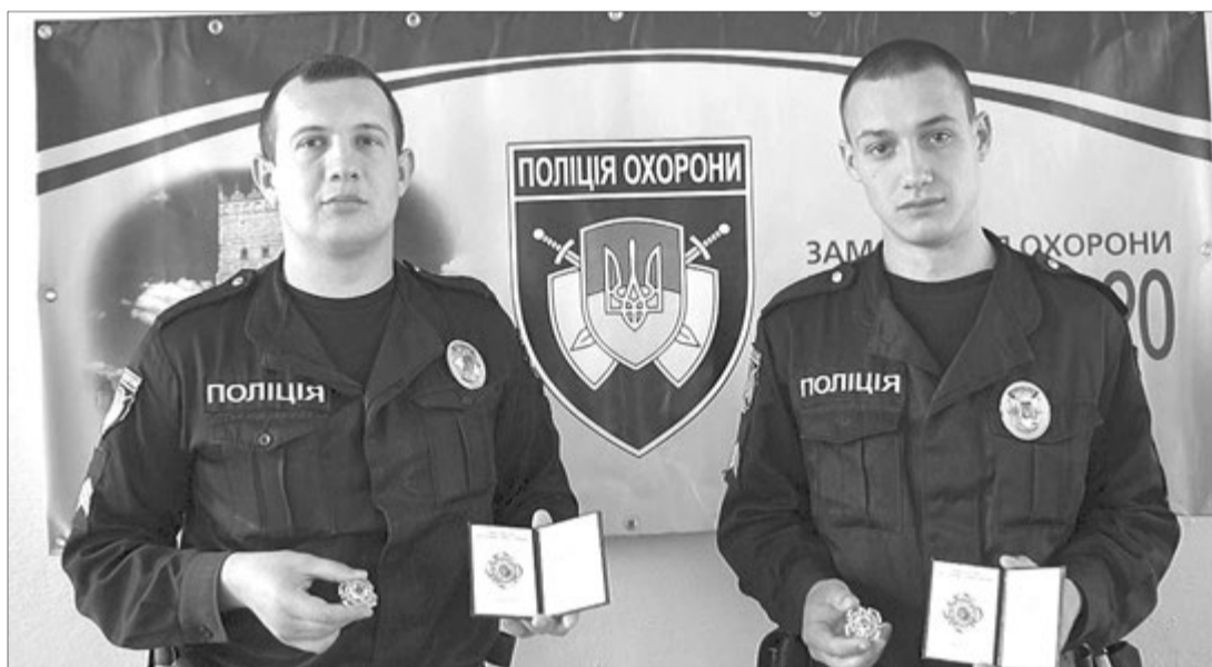
Відзнака «За відвагу в службі» — хороший стимул для професійного росту.

на про спробу пограбування банку на вулиці Дружби народів обласного центру миттєво розлетілася по всіх українських ЗМІ. Ще б пак, правоохоронці оприлюднили фотографії з місця події зі зброєю і пораненими бандитами. Втім, для самих поліцейських ця ніч стала справжнім випробуванням на професіоналізм і відвагу.