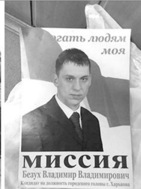
Харківський псих, який мріяв бути мером, минулої суботи прикував до себе увагу всієї країни.

злочини, його часто бачили нетверезим, ніде не працював. Це не завадило йому у 2006 році балотуватися в мери Харкова.