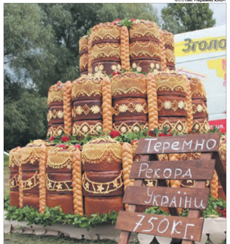
Перша проба велетенської випічки теремнівських пекарів одразу «потягнула» на найвище досягнення в країні.