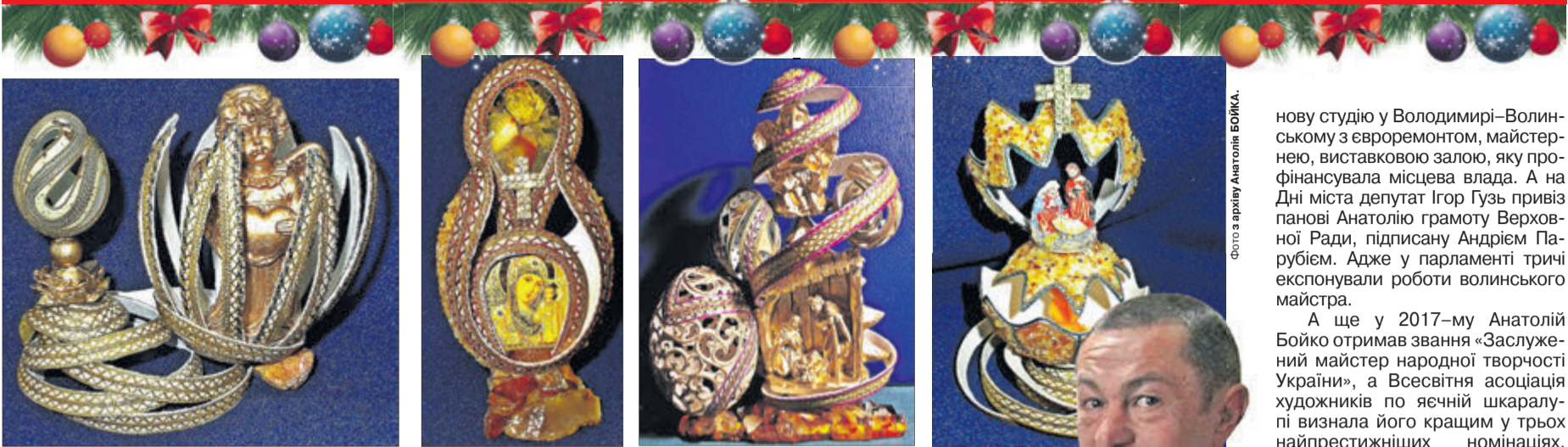
Майстер не робить ескізів: коли з'являється ідея – одразу бачить результат.