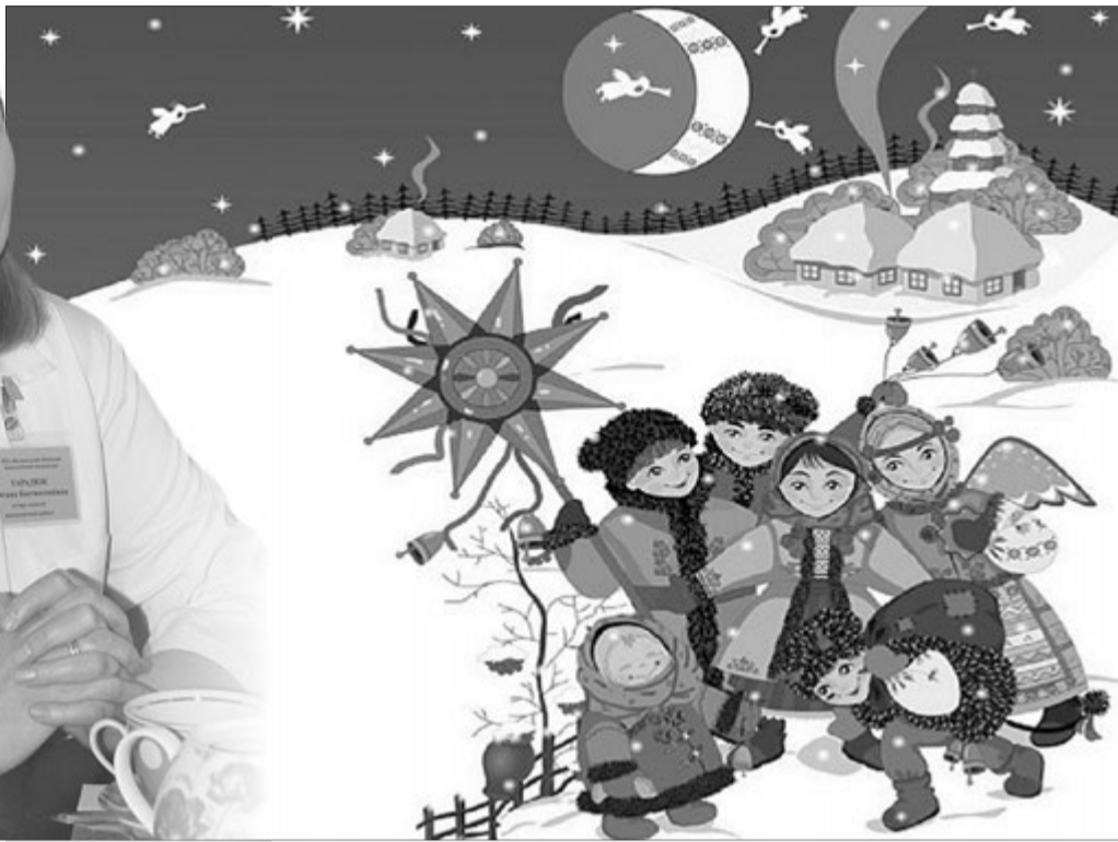
Вертепи Оксани Тарадюк діти легко вивчають напам'ять.