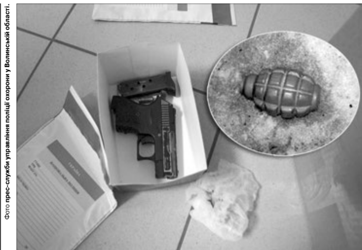
Бандити були впевнені, що ці смертельні «забавки» дадуть змогу їм утекти.