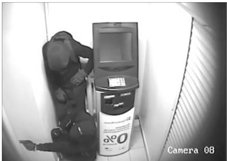
Через кілька хвилин злочинці спробують прорватися, і це буде великою помилкою...