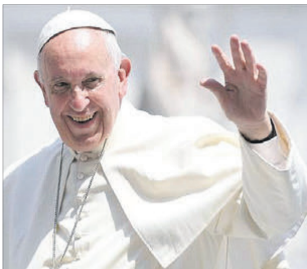
На прощання понтифік поблагословив молодь.

За словами начальника управління соціальних служб для сім'ї,