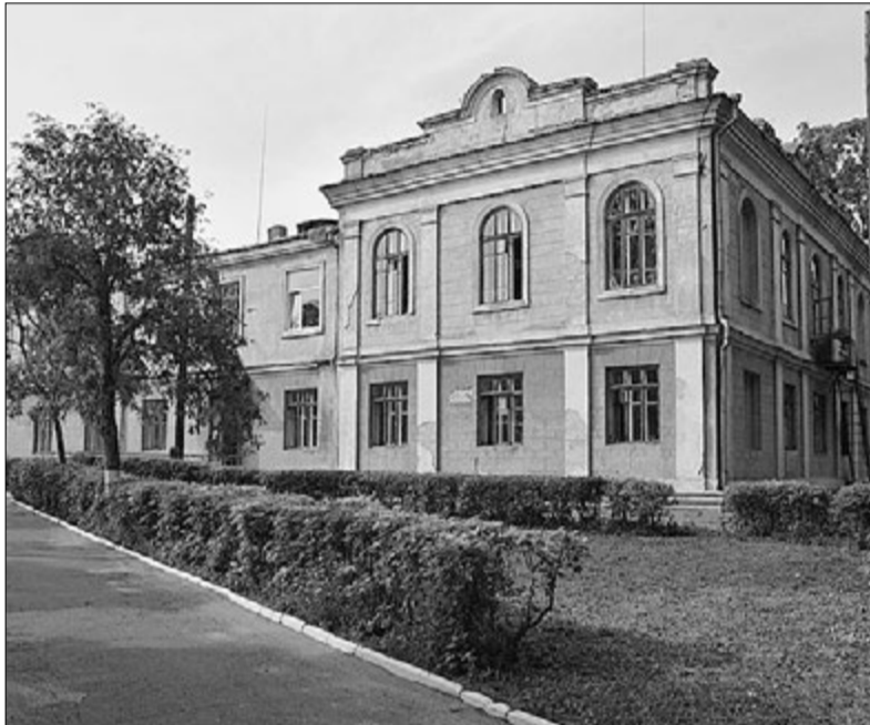
Не можна допустити знищення архітектурної пам'ятки.

Ми неодноразово звертали до Волинської обласної ради, до депутатів Верховної Ради України з приводу подальшої долі працівників, а також збереження архітектурної пам'ятки. Луківське відділення легеневого туберкульозу № 5, згідно з наказом генерального директора КП «ВОФМЦ» І.О. Нискогуза, закривають 13 лютого 2020 року, про що вже попереджений колектив на загальних зборах. Уже тоді ми запропонували керівництву області, щоб допомогли в цих будівлях відкрити хоспіс. Це дасть змогу врятувати від руйнування приміщення, в яких є харчоблок, їдальня, пральня, котельня, рентгенкабінет, аптека, лабораторія, стоматологічний і фізіотерапевтичний кабінети,