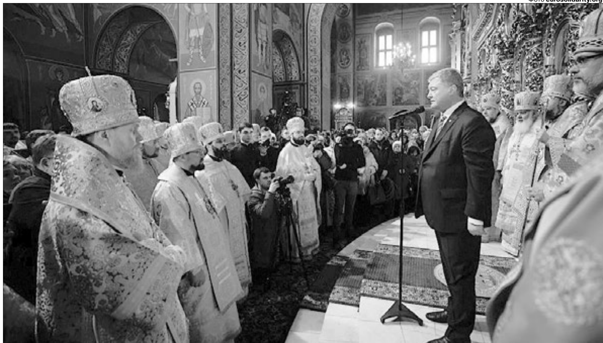
За рік існування ПЦУ її визнали три церкви — Вселенський та Александрійський патріархати й Елладська (грецька) церква. В історичному вимірі це дуже швидкий темп.