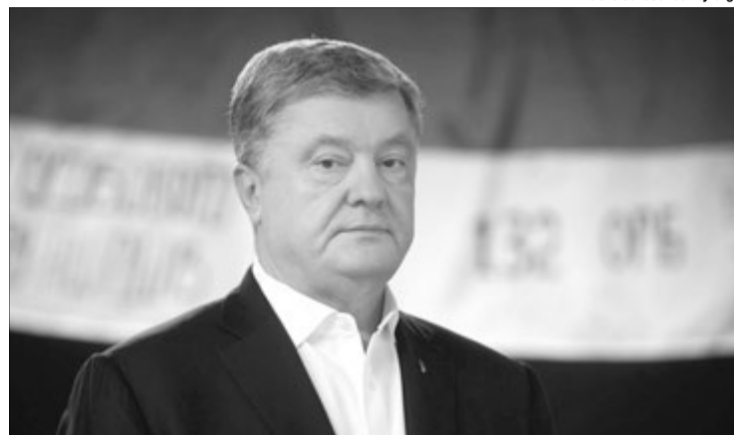
Петро Порошенко вкотре вказав на єзуйтські методи володаря Кремля, який звинувачує інших у тому, в чому винен сам.