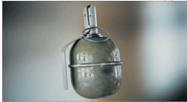
І скільки вже таких РГД-5 є по хатах українців...