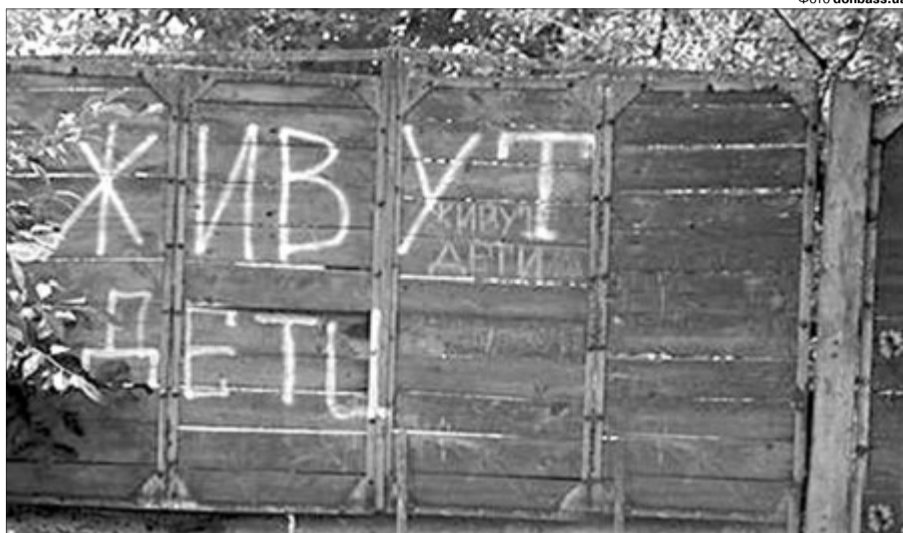
Такими написами жителі Донбасу оберігають свої домівки від обстрілів.

Так чи інакше в нашій країні все зводиться до них — їхніх зустрічей, самітів, круглих столів. Ефект від Паризької четвірки схожий до правил у футболі — забракло професійності для гри на виїзді — м'яч так і не перетнув лінію українського поля. Зеленський тисне руку Путіну... А в той самий час на протитанковій міні підриваються наші хлопці... Святий Миколаю, зроби так, аби російський президент не грався Україною, сподіваючись, що вона знекровлена, і