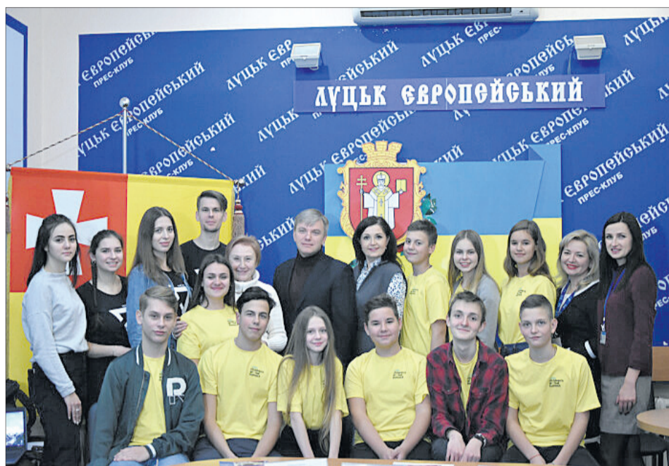
Учасники саміту сфотографувалися із посадовцями міськради та спонсорами поїздки.

— Про ментальне здоров'я в Україні мало говорять, — зазначила під час прес-конференції у міськраді дівчина. — У нас люди ще не звикли звертатися до психолога, щоб обговорити з ним свої проблеми. Ми часто не помічаємо їх і в однолітків у школі. Тому й почали досліджувати тему булінгу. Провели опитування серед учнів, як він впливає на їхні стосунки, як йому запобігти і протидіяти.