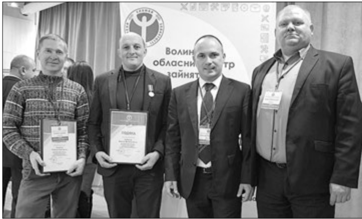
Учасники форуму готові до нових проєктів.