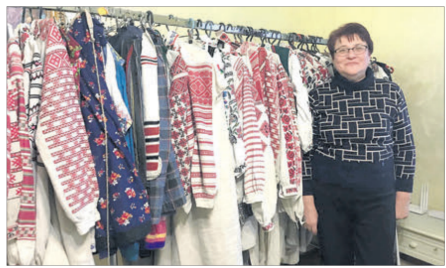
Експонатами у хаті-музеї Долиновських у Новолинську можна милуватися годинами.