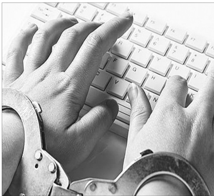
Невже скоро знову буде те, проти чого боролись журналісти в часи Януковича?

Усе це нагадало колишні радянські часи. В редакцію «Волині» я прийшла у 1987 році, коли газета виходила 5 разів на тиждень. Після кількох місяців «акліматизації» довірили чергувати по номеру в друкарні. Процес випуску друкованого видання тоді був клопіткою справою: гранки, відтиски сторінок, правки, звіряння рядків... «Сліпаєш» кожну літеру, аби, боронь Боже, помилка якась не вкралася. А тут на стіл кладуть матеріали із зауваженнями цензора: те потрібно викреслити, про інше не можна згадувати... Сперечатися з похмурим і мовчазним чоловіком, який іноді прискіпувався до зовсім безневинних публікацій, було марно. Колеги заздалегідь попередили: «Хочеш працювати, терпи». Робота затягу-