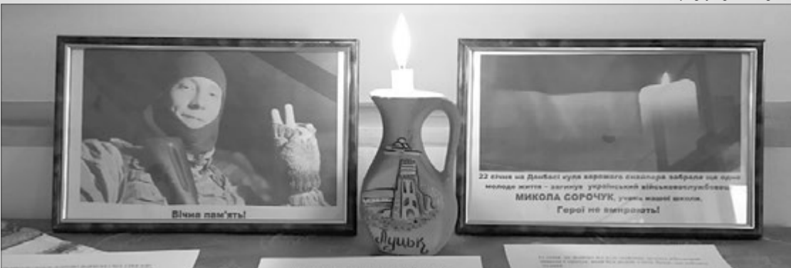
Хвилиною мовчання вшанували Героя у рідній школі.