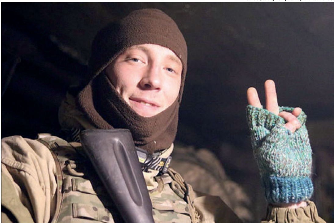
Таким сонцесяйним ми і запам'ятаємо тебе, Герою!