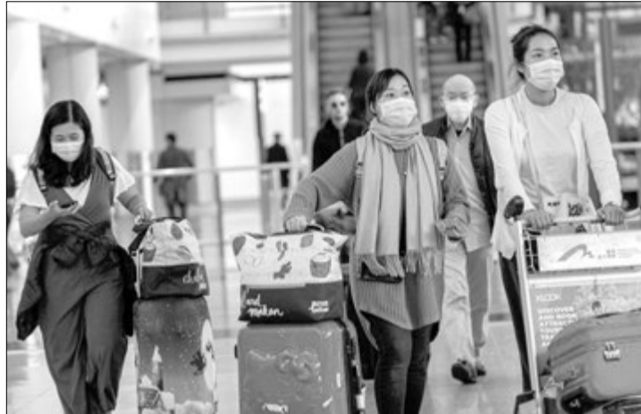
Жителі Піднебесної буквально розмітають респіраторні маски в аптеках.

Перший випадок зараження ним зафіксували у Піднебесній наприкінці минулого року в 11-мільйонному місті Ухань. На вчорашній день захворювання підтвердили приблизно у 2800 осіб, під підозрою ще кілька тисяч