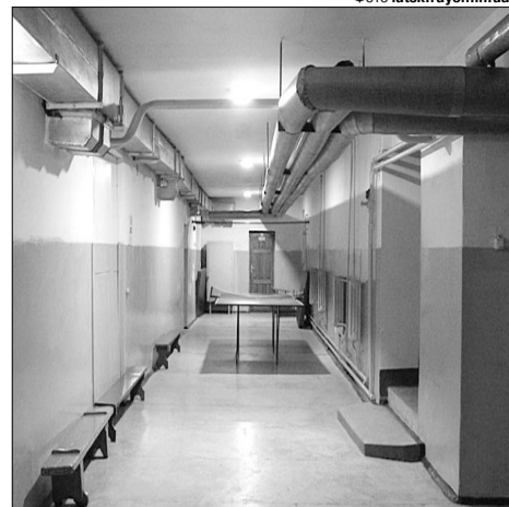
Уроки фізкультури часто відбуваються у підвалі, де немає ні вентиляції, ні природного освітлення.