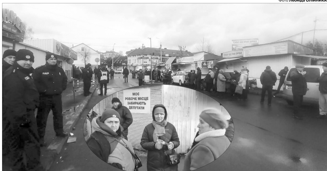
Атмосфера напружена, але поки без сутичок...