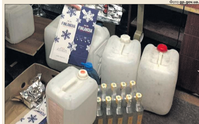
Елітний алкоголь на Волині – прямо з крана.