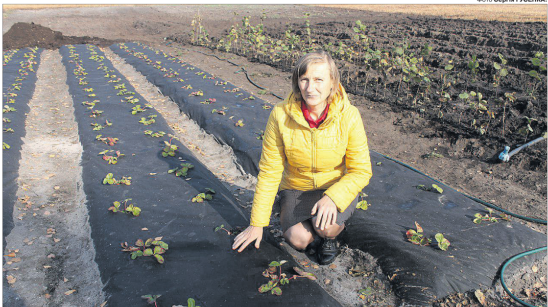
Для власного споживання вирощують полуницю, рядки якої вкривають агроволокном.

Минулого року весною поблизу будинку господарі висадили й 70 однолітніх і дволітніх