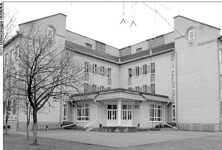
Невже приміщення навчального закладу стоятиме пустою?!

« Уроки фізкультури проходять на вулиці. Навіть узимку діти бігають на стадіоні. Коли вже зовсім холодно чи йде дощ, ідуть у танцювальну залу. Вона розташована у підвалі, тому вентиляції і природного освітлення тут немає. »