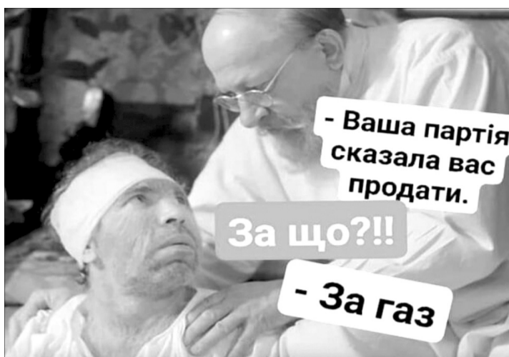
Фотожаби на тему «Продай собаку – заплати за газ» заповнили в ці дні інтернет.