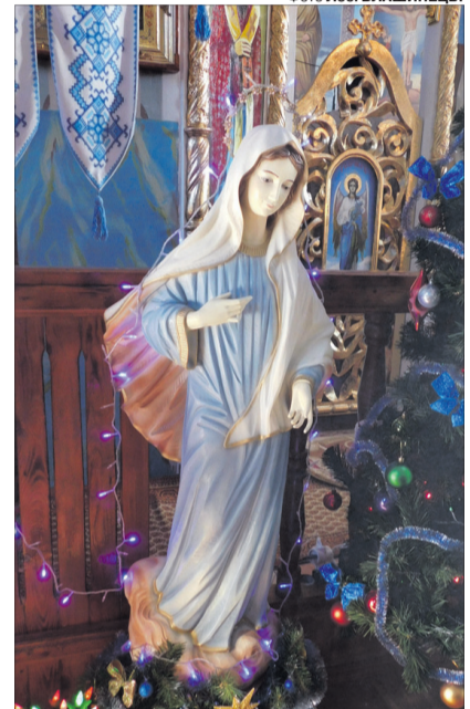
Богородиця у Лемешеві зачаровує.