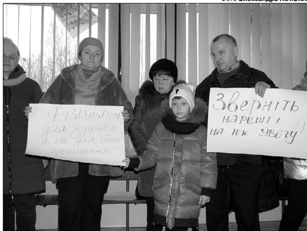
Доведені до відчаю батьки вирішили діяти більш рішуче, аби привернути увагу влади до проблеми закладу.