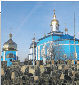
У цьому храмі зберігається чудотворний образ «Одигітрія».