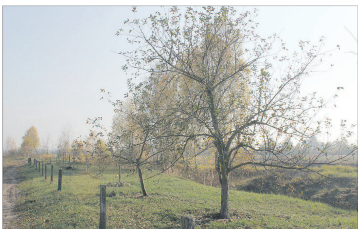
Тішати господарів рівні рядки дерев, що тягнуться гілками до сонця.

Для того, щоб горіхи добре родили, на одній площі потрібно садити декілька сортів.