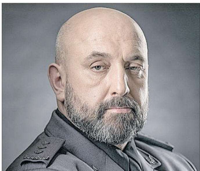
«Головну ставку Москва зараз робить на свою «п'яту колону».

«По-перше, він (Путін. — Ред.) має великий досвід у таких справах. Адже дестабілізація в нашій країні почалась набагато раніше, ніж сама війна. Давайте згадаємо, як після Майдану активізувалися проросійські сили на території України. Згодом до них доєдналися такі рухи, як «казачество». Крім того, ще є російська церква. Моментально піднялися всі організації, які фінансуються російськими грошима. Таких зараз