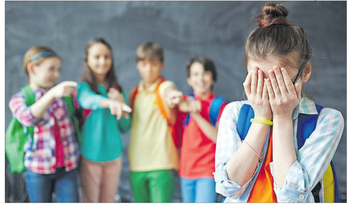
Відмова йти до навчального закладу може бути ознакою того, що дитину там цькують.