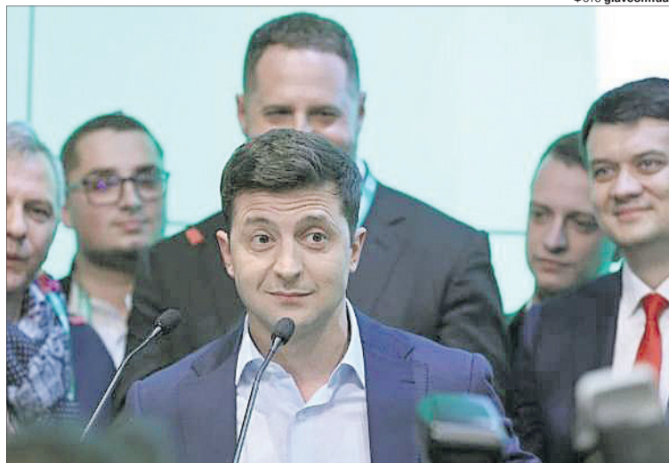
Наразі все, що добре виходить у команди Президента, — це без упину множити скандали...