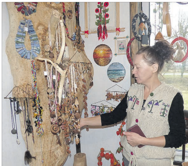
У цих прикрас – аромат мигдалю, абрикосів, яблук...