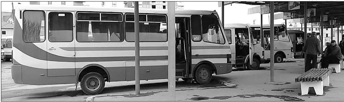
Комфортність більшості автобусів, що курсують волинськими дорогами, не витримує жодної критики.