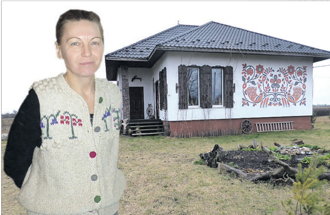
Стіни будинку майстриня розмалювала орнаментом, що символізує дерево життя.