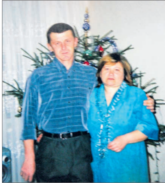
І в горі, і в радості — разом.