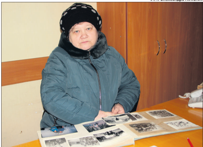
«У цих світлинах усе наше життя...»