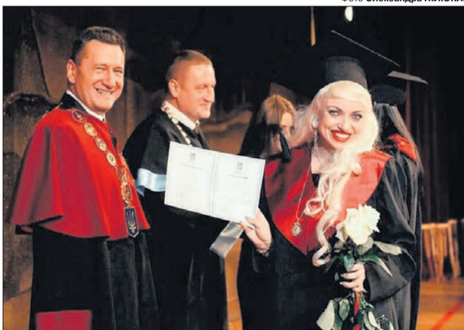
Привітав магістрів ректор СНУ імені Лесі Українки Анатолій Цьось.