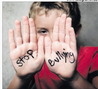
Варто пояснювати дітям, що інші мають право робити з ними і що заборонено.

Начебто педагогу дуже не сподобалося, що школяр посмів наполягати на певній цифрі у задачі, у точності якої той засумнівався. «Шкода хлопця, бо дуже страждав і наступного дня просився не йти в школу. Він же такий спокійний у нас», — зітхав чоловік. Він додав, що мова про педагога з багатолітнім стажем! Зі слів родича підлітка, підвищує голос на учнів учитель часто