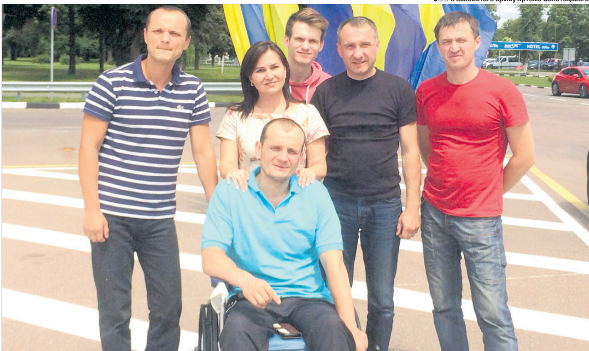
Активіст Революції гідності вдячний лікарям, волонтерам, просто хорошим друзям, які були поряд з ним у важкі хвилини боротьби за життя.