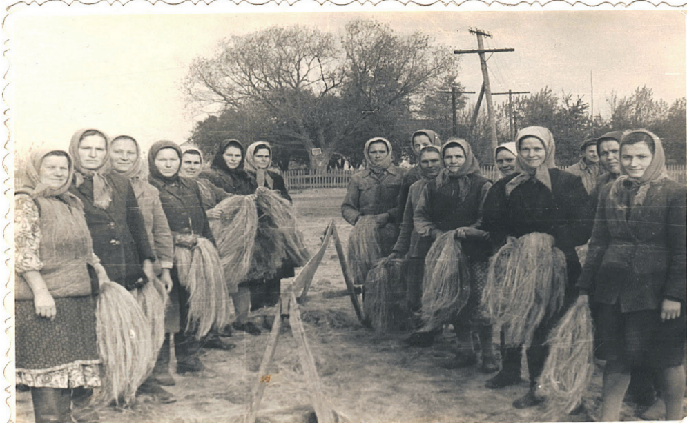
Тріпання льону в Боровичах (1970–1980–ті роки).