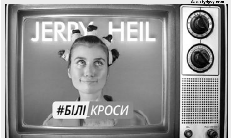
Jerry Heil, напевне, — найвідвертіша українська артистка.