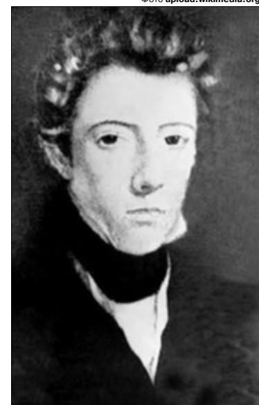
Маргарет берегла свою таємницю до самої смерті.

Він лікував солдатів, допомагав місцевим жителям, справлявся з найважчими випадками, які колеги вважали безнадійними. Це було не-