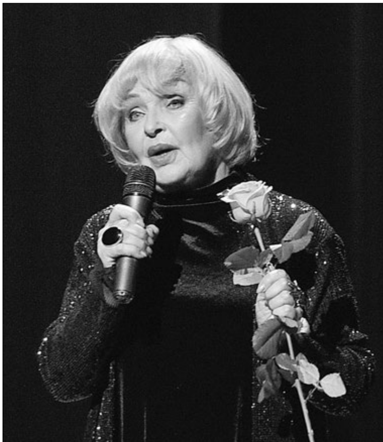
«Краще я сама розкажу про себе, ніж обросту химерними плітками».

Великій актрисі уже 83-й рік. Незважаючи на вік і всі втрати, вона намагається не падати духом і досі виступає в театрі та знімається в кіно. І на Донбасі буває, щоб підтримати наших бійців. Її мужність просто захоплює. А життєві мудрості варто повчитися. Ось лише декілька секретів цієї Жінки, Акторки, Людини — сказане нею