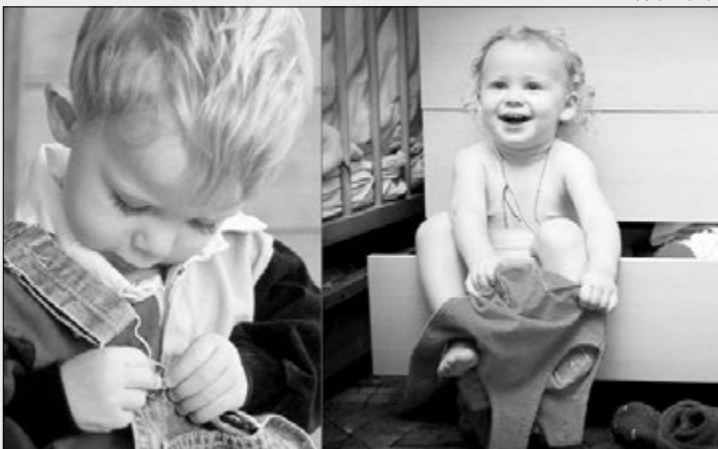
Самостійне одягання сприяє загальному розвитку.