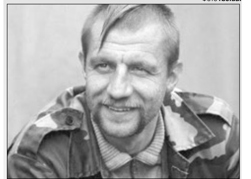
«Козак Гаврилюк» знає, як це — жити на зарплату.