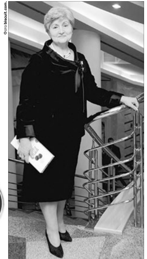
Під її керівництвом виготовляють понад 350 найменувань цукерок, зефіру, бісквітів.

Спокійна і розважлива. Шанує у людях правдивість. Своїм розумом і хистом заробила понад 40 мільйонів. Гроші є одним із плодів її рішень, завдяки яким у важкі для економіки роки втрималося і пустило гарні пуп'янки відоме кондитерське підприємство у Харкові. Тепер цукерками із тієї «солодкої столиці» ласують не те що в Європі — в мусульманських країнах (правда, спеціальними, без тваринних жирів)