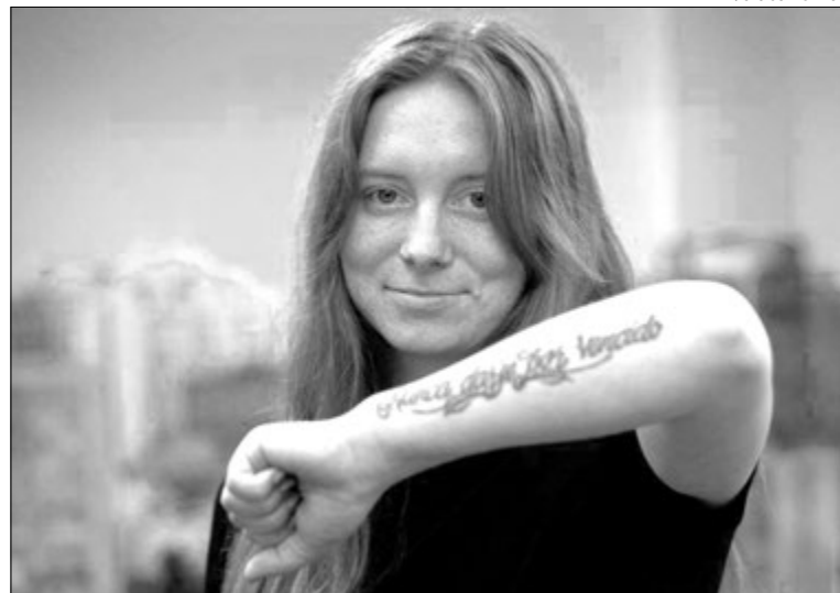
На її лівій руці — татування, вибите іспанською мовою: «Ніколи не здавайся». Цим гаслом вона керується в житті.

— Що я робила на фронті? Те, що добре вміла в мирному житті, — готувала, — каже військова. — До служби в армії працювала в пizzerії, хоч за освітою секретар-оператор поштового зв'язку. До речі, навчан-