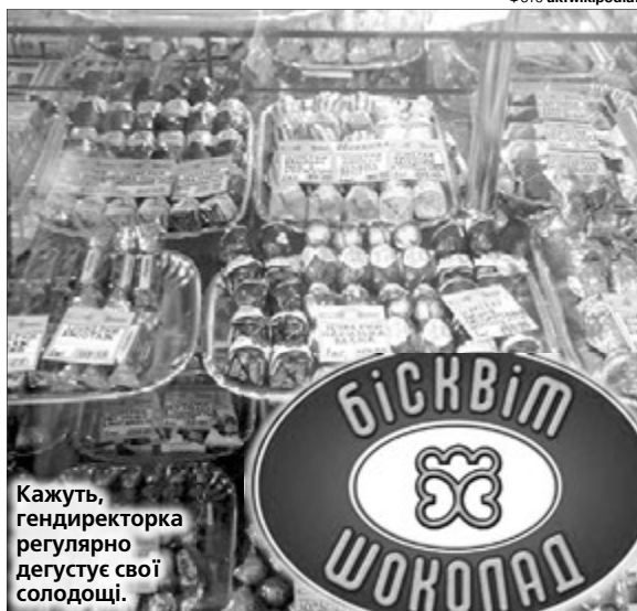
Кажуть, гендиректорка регулярно дегустує свої солодощі.