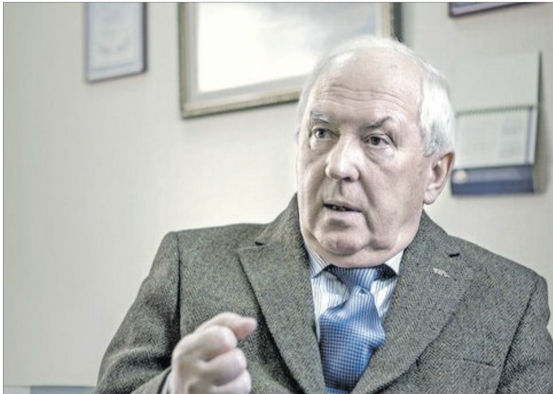
«Українці 27 поколінь не мали власної державності. Звідси і всі біди».

Хоча мені нелегко доводилось і під час акції «Україна без Кучми» — вважаю, що це була робота російської агентури та частини українських спецслужб. Я зайняв тоді принципову