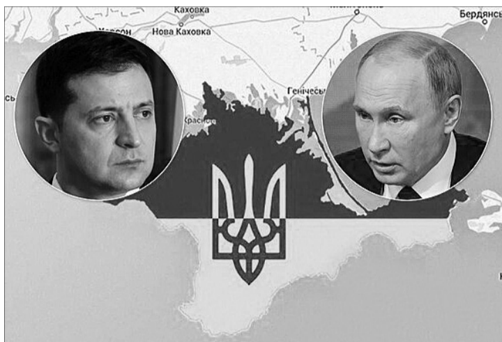
Пане Зеленський, хіба ви не розумієте, що дати воду в Крим — означає не просто полегшити життя окупантам, а й визнати півострів російським?

Попри це, як стверджує відомий журналіст Юрій Бутусов, «представники влади зверталися до кількох українських інжинірингових компаній, вивчаючи можливості відновлення водопостачання Криму». «Були дані реальні конкретні запити на проектування. І я знаю людей, які відмовилися це замовлення виконувати», — зазначив журналіст. За його даними, пода-