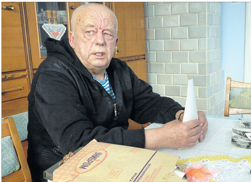
Пан Анатолій сподівається знайти сліди Воротнікова.