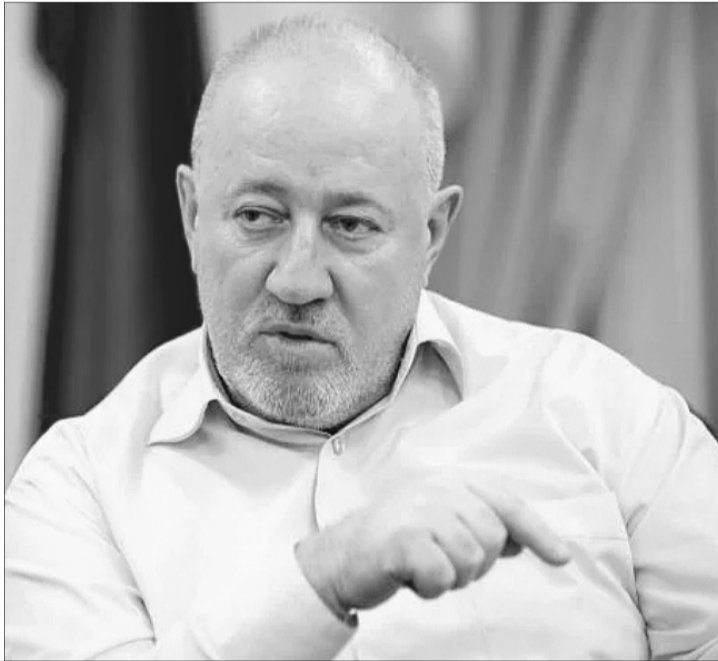
«Я був дуже жорстким політичним опонентом Порошенка, але це ще не привід підписувати незаконні документи проти нього».

За його словами, якість цих підозр була такою, що їх неможливо було навіть випра-