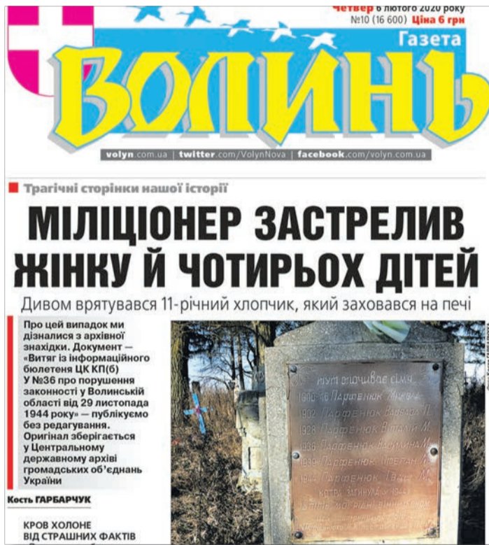
Публікація у «Волині» має продовження.