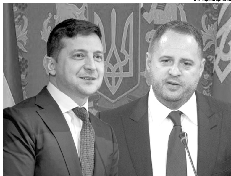
«Пане Зеленський, на підставі чітких директив ставив свій підпис Єрмак?»

Із різкою заявою виступив і п'ятий Президент України Петро Порошенко. Він, зокрема, заявив: «Всі п'ять років моя ко-