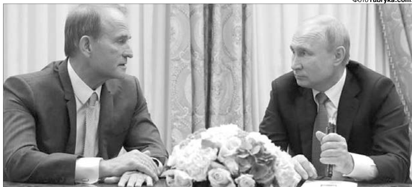
Це не просто розмова кумів. Це бесіда, як здати Україну.