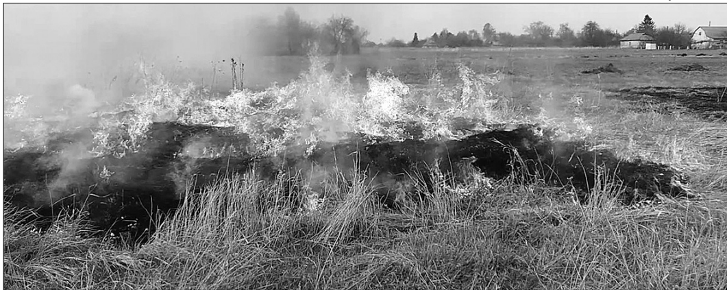
Лише за одну добу рятувальники Волині ліквідували 10 пожеж, 9 з яких – в екосистемі.