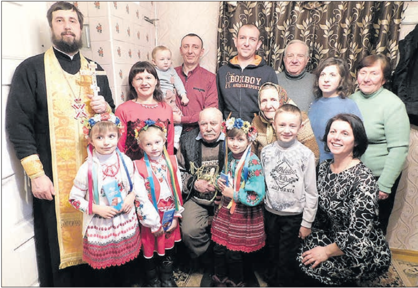
Через кілька секунд ювіляр здивує всіх, заспівавши «Ой зелене жито, зелене...».