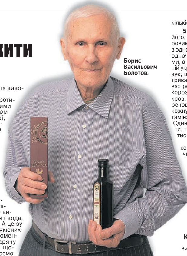
Борис Васильович Болотов.

4. Ну і, звичайно, дотримуватися температурного режиму. Коли нам холодно, ми витрачаємо амінокислоти, а якщо тепло, їх відновлюємо. Мало того, коли холодно, амінокислоти нейтралізуються, при цьому виробляється енергія і вода, утворюються білки. А це зумовлює появу злоякісних пухлин. Тому я рекомендую приймати гарячу ванну 5–10 хвилин щодня. Так ми відновлюємо