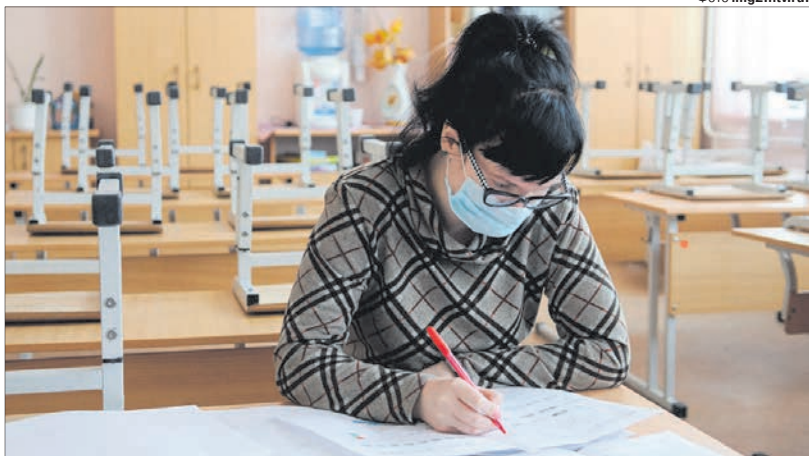
У порожніх класах — вчительська «самоізоляція».