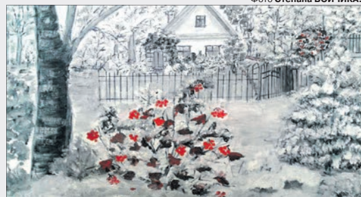
Рідний край полонив її серце.