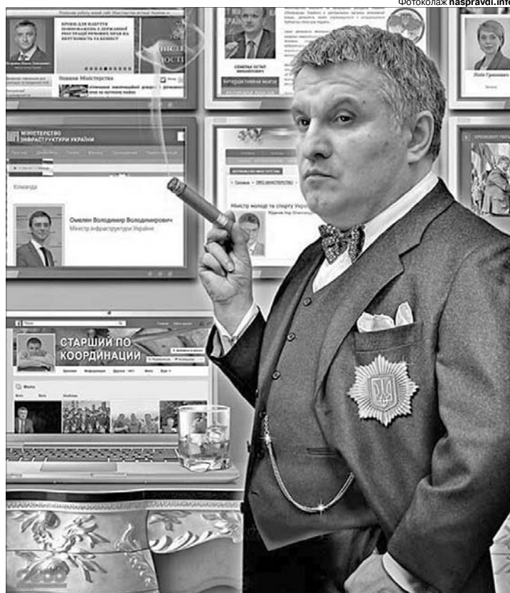
Все активніше говорять, що нинішня посада Арсена Авакова — не вершина його політичної діяльності.

домашнього вжитку, пошкоджено стіни. На місці пожежі виявлено тіла двох братів — 1961 та 1966 років народження. Загорання ліквідоване силами співробітників 21-го Державного пожежно-рятувального поста, місцевих команд сіл Поворськ та Пісочне. Причина лиха та обставини загибелі людей встановлюються. ■