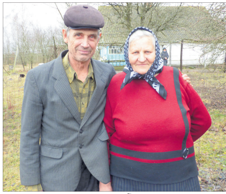
Поки сили є, поки раду собі дають хуторяни, то, як кажуть, нікуди звідси не рушать.