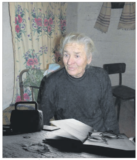
Баба Юля рятується від самоти читанням.