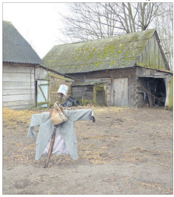
Ось так доводиться серед лісу відганяти шулік від домашнього птаства.