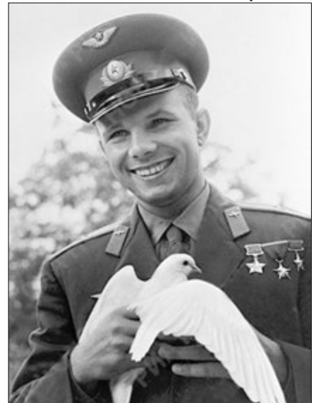
Перший космонавт планети Земля прожив лише 34 роки.