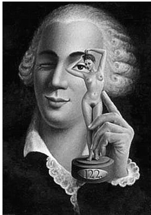
Навіть через чотири сотні літ після смерті до образу коханця-авантюриста не згасє інтерес.