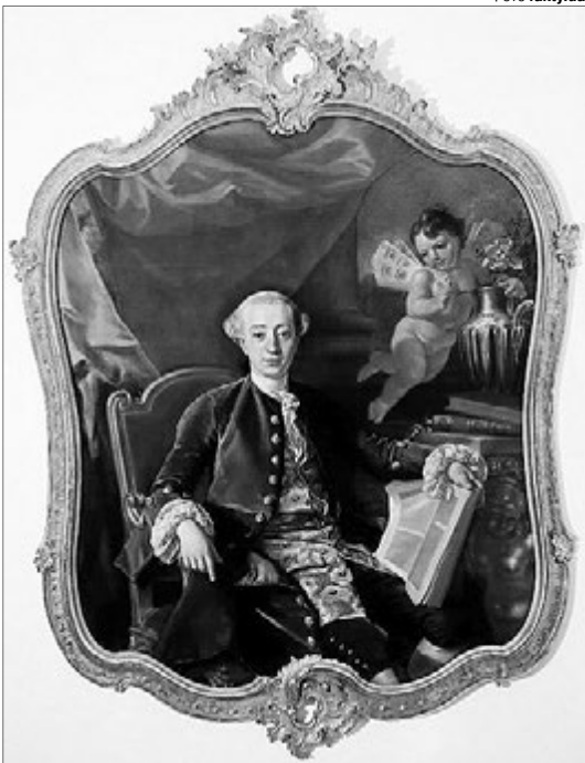
Один із найвідоміших портретів Казанови, створений венеціанським живописцем Алессандро Лонгі.