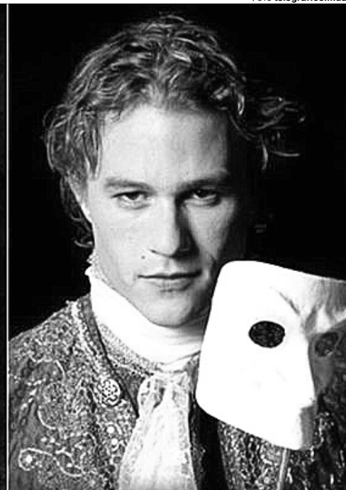
Зіграти роль Казанови було для акторів перепусткою у світ улюбленців жінок усього світу. Австралієць Хіт Леджер у 2005 році теж отримав такий шанс. Ця екранізація досі є однією з найпопулярніших.