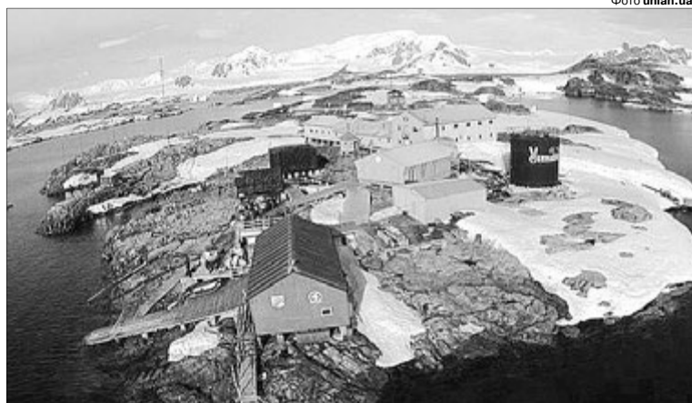
Українська антарктична станція «Академік Вернадський» розташована на острові Галіндез архіпелагу Аргентинські острови (її координати — 65°15 пд. ш., 64°15 зх. д.). До 1996 року це була британська станція «Фарадей».