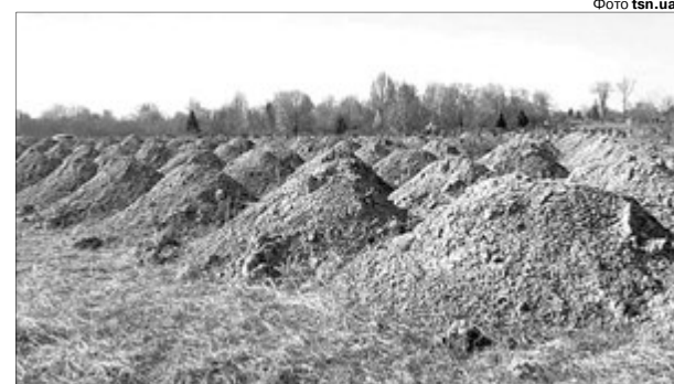
Влада міста сподівається, що такі фото спонукають людей дотримуватись карантину.

Що ж, як то кажуть, кому війна, а кому — самі знаєте що.