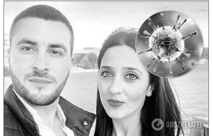
Спочатку убивця писав: «Вітаю тебе, надзвичайна лікарко!»...