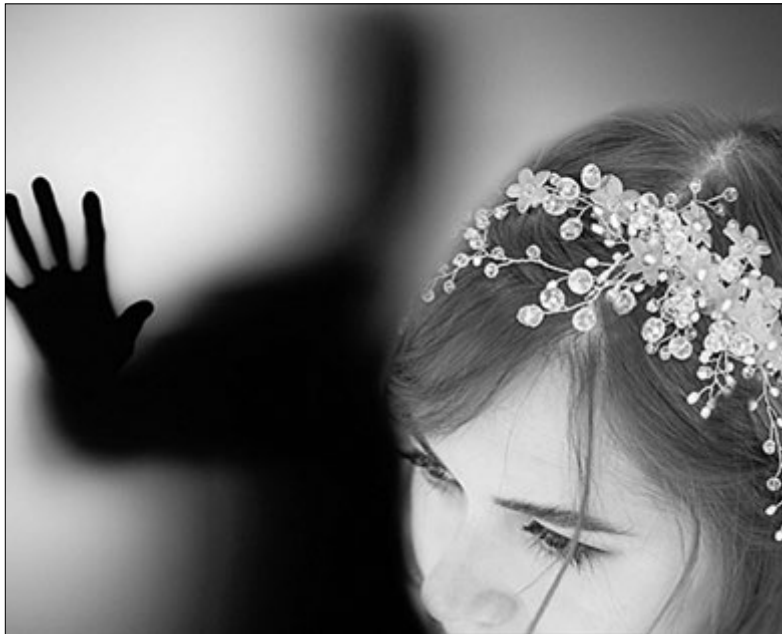
А казали: «Він такий тихий, нерішучий, навіть мухи не скривдить».