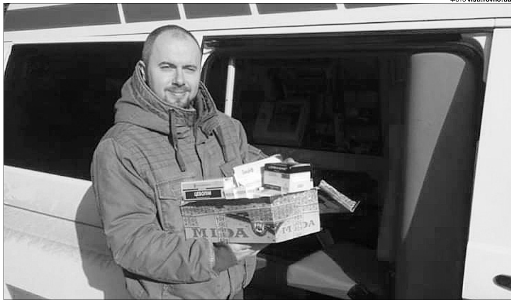
Фронтний досвід тільки на руку в екстремальній роботі за тисячі кілометрів від дому.