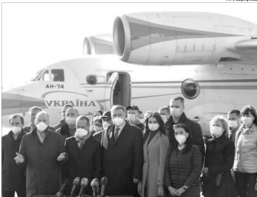
Українські медики в Італії – не просто красивий жест, а реальна допомога.

Італійці з великою вдячністю прийняли українську допомогу. Зустрічав медиків глава міністерства закордонних справ Луїджі ді Майо. А в місті Пезаро їх розмістили в найкращому готелі, який власник надав безкоштовно. Представники тамтешньої української діаспори зголосились бути перекладачами. В Італії наші лікарі зможуть набути досвід в боротьбі з небезпечною хворобою, який їм знадобиться в Україні. А якщо треба буде, італійці