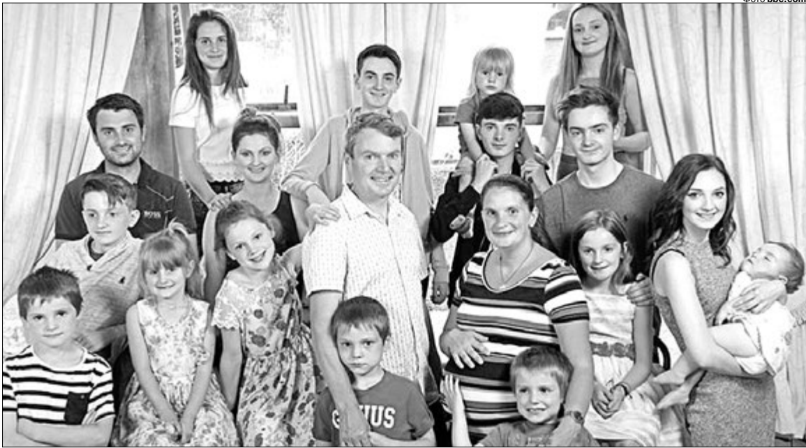
Редфорди зізнаються, що не мріяли про настільки багатодітну родину.