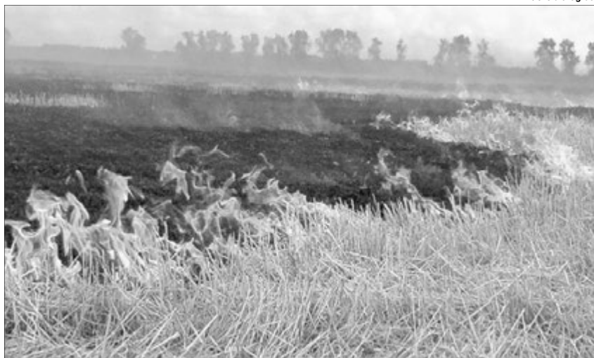
«Просто перестати палити»: щоб звільнити Україну від руйнівного вогню, цього дійсно достатньо.

● за знищення або пошкодження лісових масивів, зелених насаджень навколо населених пунктів, уздовж залізниць, а також стерні, сухих дикоростучих трав, рослинності або її залишків на землях сільськогосподар-