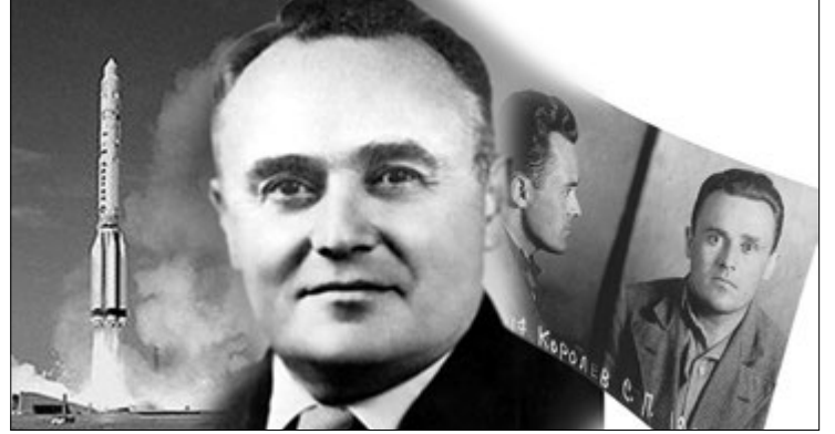
Талановитому інженеру-авіатору довелося пройти і кризу ув'язнення, допити, побиття, і кризу рабську працю у «шарашках». Але він вистояв.