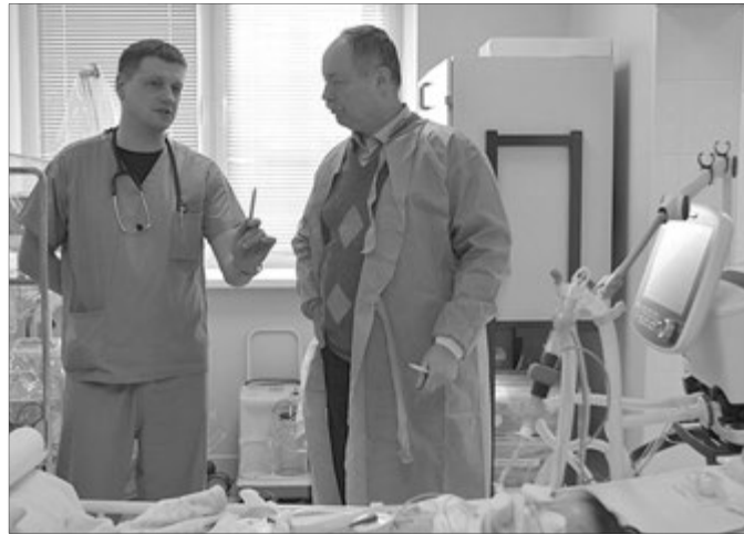
Наш герой працює дитячим анестезіологом в Західноукраїнському спеціалізованому дитячому медцентрі.