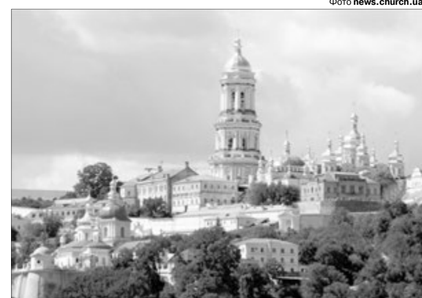
Зараз у лаврі — суворий карантин.