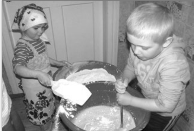
Посвячення у таїнство...