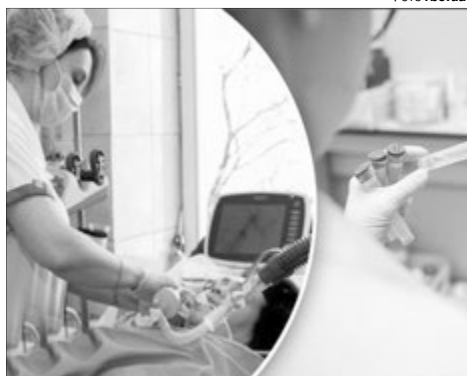
На щастя, коронавірус — це не смертельний вирок, навіть у поважному віці.

А в Нідерландах з лікарні після коронавірусу виписалась 107-річна бабуса.