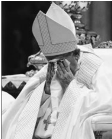
Понтифік, який під час однієї із мес благословляв безлюдну площу, не зміг втримати сліз...