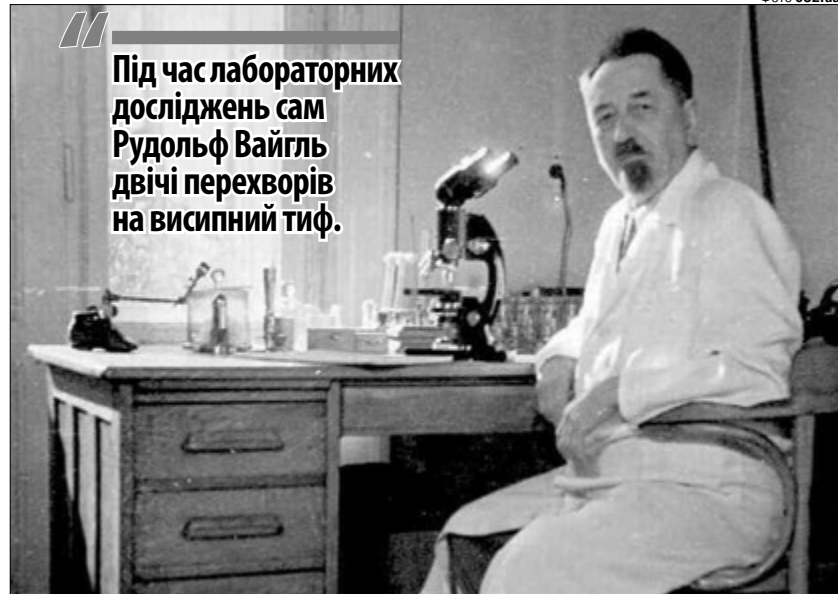
Під час лабораторних досліджень сам Рудольф Вайгль двічі перехворів на висипний тиф.

Для наукової роботи Вайглю потрібні були живі воші. Тому в лабораторії працювали їхні годувальники (донори). Спершу в цій ролі був сам професор і навіть його дружина, але коли установа розрослася, довелося залучати інших людей. Вчений розробив спеціальні «годівнички» з коміроч-