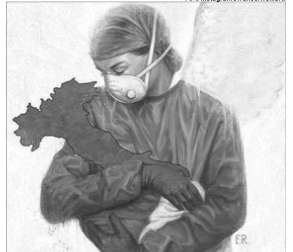
Цей образ – втілення материнської ніжності і турботи.