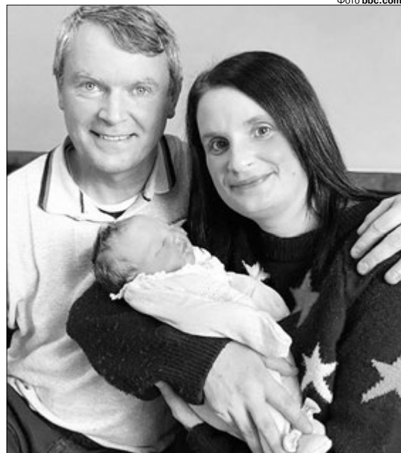
Із ім'ям своєї 11-ї дівчинки батьки найбільшої родини Великої Британії ще не визначилися.