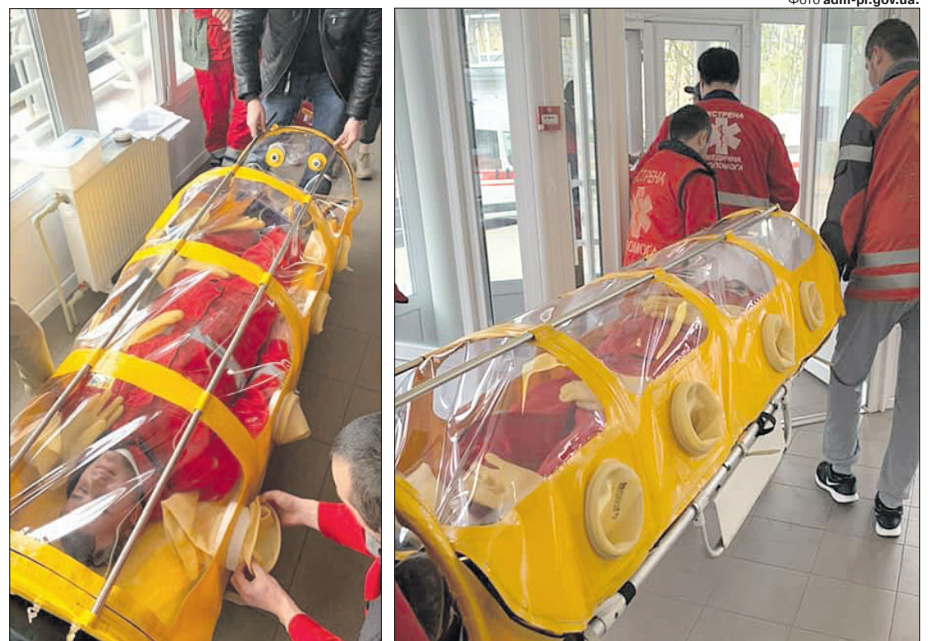
Працівники служби екстреної медичної допомоги Полтавщини транспортний ізолятор для інфікованих хворих оцінили найвищим балом.

Кременчуцькі підприємці першими виготовили таку герметичну капсулу. Її вже випробували в кареті швидкої допомоги в Полтаві — все працює. Після тестування і доопрацювання можна буде налагодити виробництво транспортних ізоляторів для інфікованих хворих. Наприклад, полтавські медики виявили бажання замовити 20 таких капсул, які зроблять їхню роботу менш небезпечною. ■