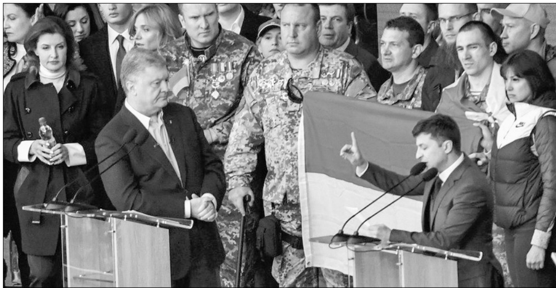
Під час дебатів Зеленський сказав Порошенку: «Я ваш вирок». Після року при владі є підстави побоюватись, щоб президент не став вироком для України.

Слідство по Майдану при Зеленському просувається всупереч діям керівників, яких призначає Зеленський. Генпрокурор Руслан Рябошапка на догоду голові ОП Богдану та його партнеру екзаступнику голови АП Януковича Портнову звільнив начальника управління спецрозслідувань ГПУ по Майдану Сергія Горбатюка. Також були звільнені