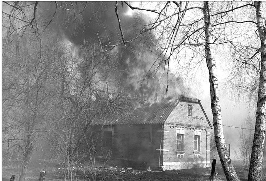
У селі Стара Марківка на Київщині вогонь не шкодував ні трави, ні дерев, ні будинків...

Буває, як щось дуже зачепить, то життя підкине тобі ще інше до теми. Такий собі закон парних подій. Тож саме у цей час почула оповідь жінки, яка повернулася з Німеччини. Вона ділилася, як тамтешня поліція затримала чоловіків, що розклали у полі вогнище і щось собі смажили. «Ви уявляєте, якийсь німець, який мешкає неподалік, викликав поліцію. Роздивлявся собі поле у бінокль — і помітив відпочивальників. Там