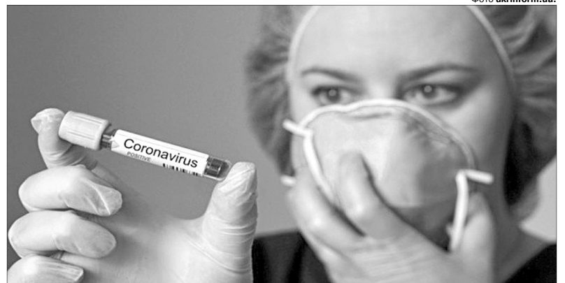
В Україні очікуються ще два піки захворюваності на коронавірус – в кінці квітня та між 3 і 8 травня.

У Старовижівському районі зареєстровано 38 хворих, в т. ч.