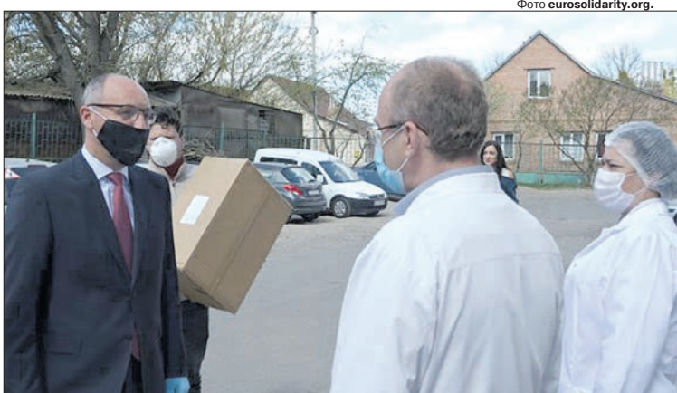
Насамперед допомогу Фонд Порошенка надає тим закладам, які першими приймають людей із підозрою на коронавірус, зокрема таким, як Волинська обласна інфекційна лікарня.

«Європейська солідарність» та її народні депутати вже протягом декількох тижнів передають допомогу медичним закладам у різних областях України. Ми усвідомлюємо, що найважливішим сьогодні є захист тих, хто стоїть на передовій боротьби з інфекцією — лікарів, — заявив Андрій Парубій. — На жаль, найвищий відсоток серед тих, хто захворів, — це якраз медичні працівники,