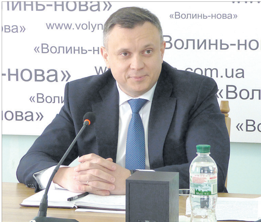
Юрій Олександрович очолює волинську поліцію у лютому 2020 року.

— Такого немає. Ми підійдемо до людини і роз'яснимо, що заборона існує, і її потрібно виконувати. Якщо громадянин поставиться із розумінням, проблем не буде. Але трапляються випадки, коли волиняни агресивно реагують на зауваження працівника по-