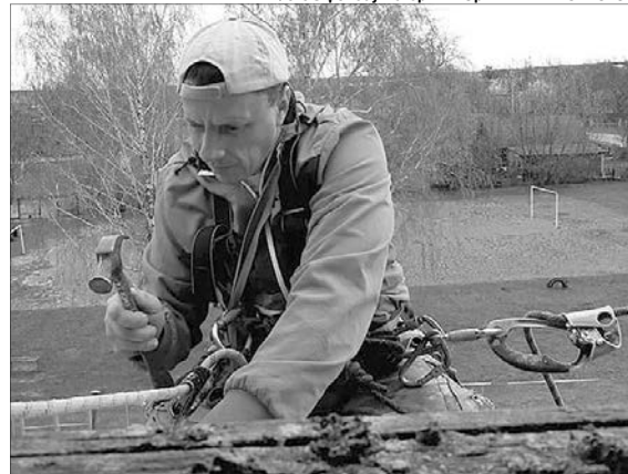
Досвід туриста несподівано знадобився.