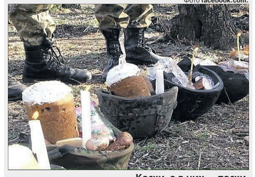
Каски, а в них — паски.