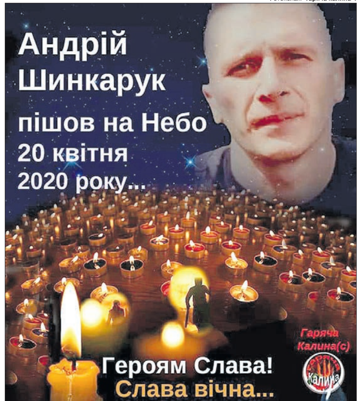
Сьогодні жителі Любомля попрощаються із земляком, який був свого часу справжнім солдатом, а згодом — справжнім офіцером.

Любомль, давайте спробуємо віддати молодому офіцеру останню шану, повагу, пам'ять, прийшовши на дорогу з квітами, свічками, прапорами, коли він буде повертатися додому. Ми робили це вже не один раз. Не думаю,