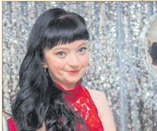
«Треба йти вперед, навіть якщо не можеш ходити», — каже молода журналістка.