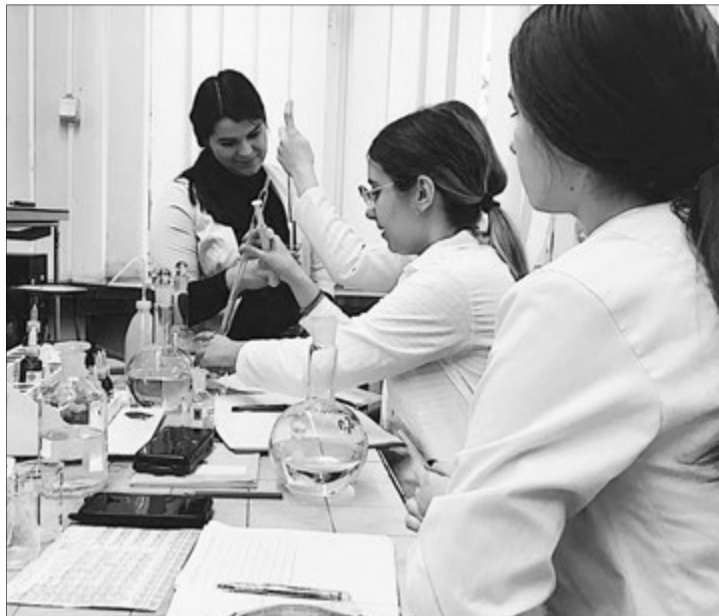
Кожен студент факультету має змогу доповнити інтенсивне навчання практичними навичками.

А ще досліджують оптичні та електрохімічні сенсори для визначення біологічно активних та токсичних речовин; вивчають синтез нових гетероциклічних сполук та виявляють їх антимікробну і протизапальну активність. Цінність диплома факультету хімії, екології та фармації виявляється також у здатності випускників проводити прикладний ландшафтно-екологічний аналіз антропогенно змінених систем; екологічний моніторинг сучасного стану та прогноз динаміки за-