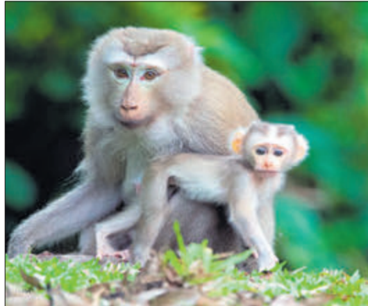
Поки що з мешканцями звіринця, серед яких чимало екзотичних, як ось ці, зустрічі можуть бути лише віртуальні — на його офіційній сторінці у фейсбуці.