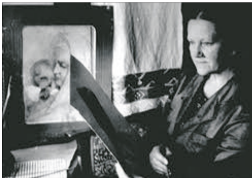
Що б не малювала художниця — портрет чи букет квітів — у кожному творі відчувається професіоналізм митця.

«Художниця падала з висоти, залишилася живою, розцінюючи це чудесне спасіння як Божу волю.»