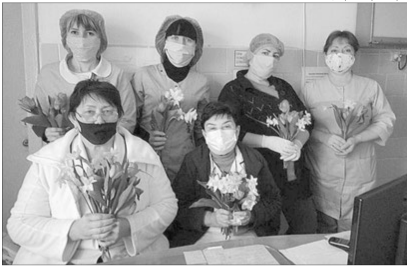
Фото Каховської центральної райлікарні.