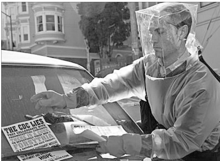
Стрічка «Зараза» 9 років тому передбачила коронавірус.

Карантин, маски, обмеження, блокування, дистанційне навчання, освячення верби і паски в режимі онлайн... Зустрічаючи 2020 рік, і не подумали б, що житимемо як кіно. Зі сплахом нового виду коронавірусу, який не просто налякав людство, але й паралізував усю світову економіку і логістику, з'явилося багато тез про його передбачення різними провидцями. Виявляється, про неї попереджала Ванга. А от що дійсно дивує — це голлівудський фільм «Зараза», який вийшов на екрани у 2011 році. Доволі посередня стрічка відомого режисера тоді загубилася у рейтингу, але з виникненням нинішньої пандемії... стала бестселером. І це не дивно, адже збігів чимало: епідемія почалася в Китаї, вірус поширився через кажанів, передається при близькому контакті або при дотику до заражених поверхонь і вражає дихальні шляхи. Під час роботи над картиною автор сценарію Скотт Бернс тісно спілкувався з інфекціоністами й екранізував їхні теорії. Ще де-