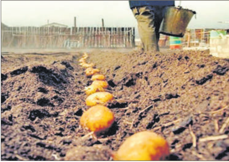
Земля не може чекати, коли знімуть карантин.