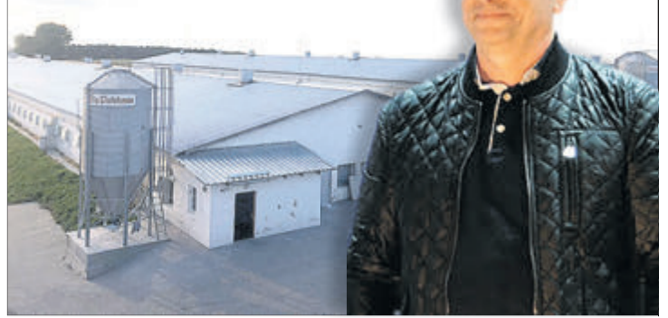
На місці руїн колишньої тваринницької ферми в Звинячому добрий господар навів взірцевий порядок.