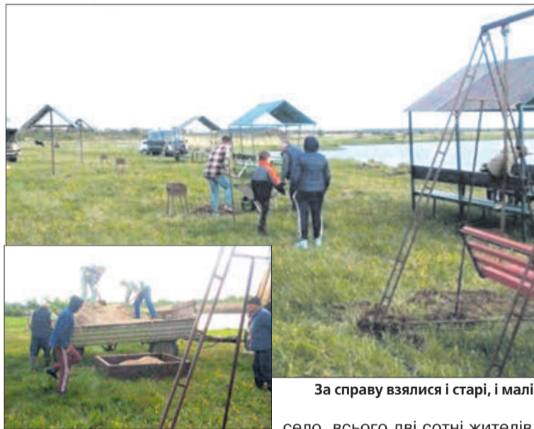
За справу взялися і старі, і малі.