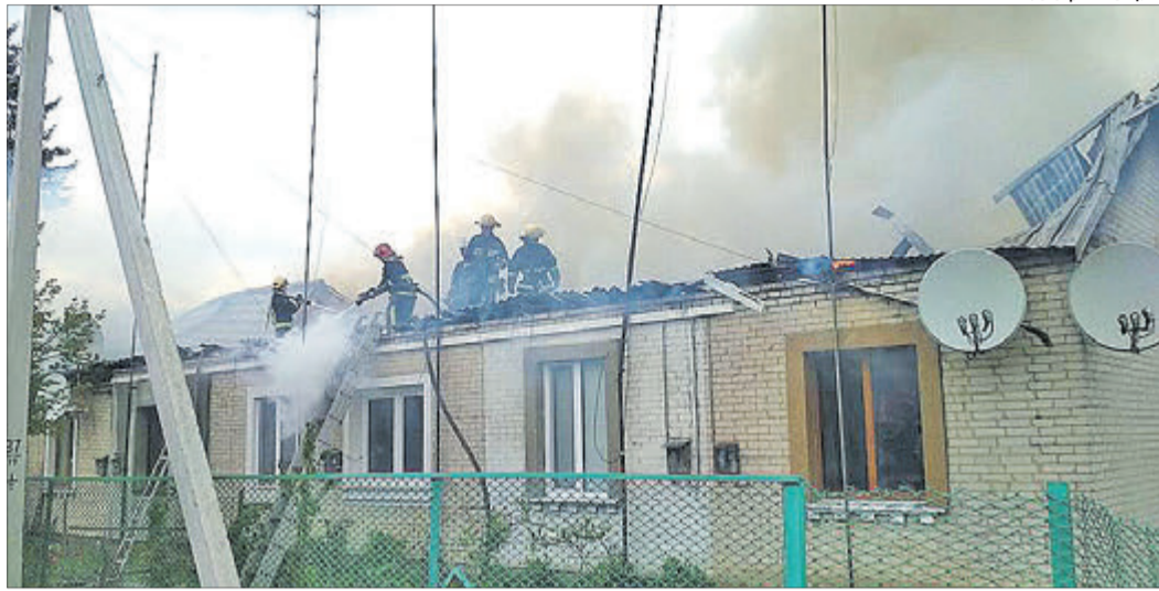
Будинок вигорів ущент, але обійшлося, на щастя, без жертв.