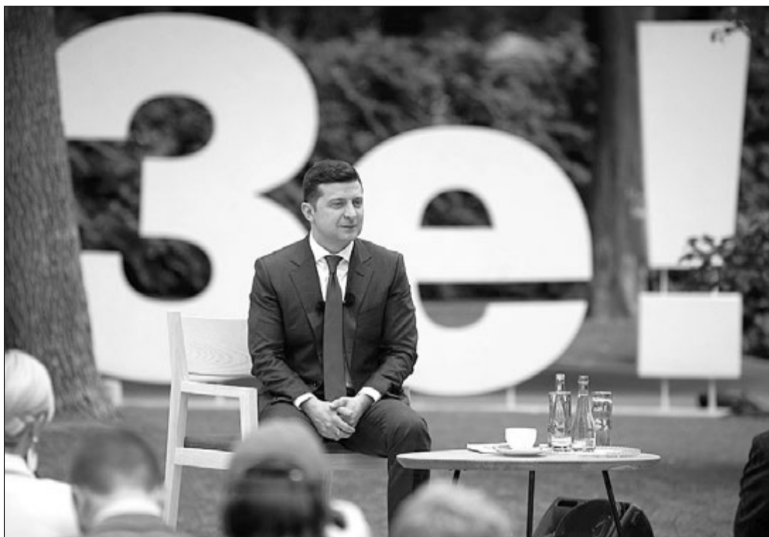
На пресконференцію глави держави не пустили або не дали слова багатьом патріотичним та західним ЗМІ, натомість режим сприяння отримали відверто проросійські медіа. Випадково?

Якщо пан Президент знав, що «гроші не падають з неба», але обіцяв «кінець епохи бідності», то це означає, що він обманював. А отримавши «бідну» країну, він, до речі, зробив її ще біднішою, бо економіка в Україні почала просідати ще до кризи, викликаної карантинном.