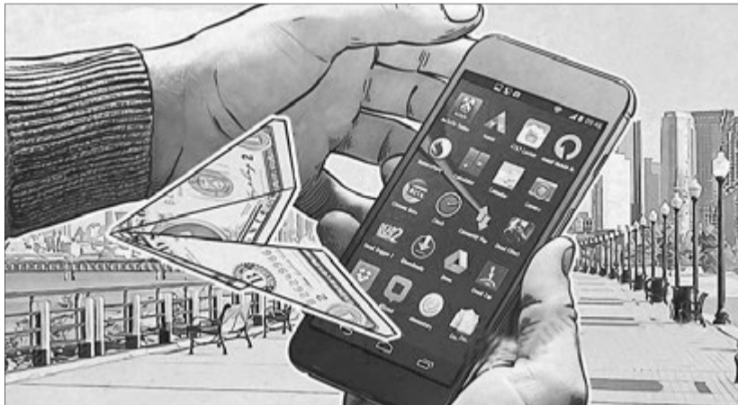
Тепер шукай коштів, як вітра в полі.

Коли в Італії від коронавірусу вмирали тисячі хворих, мої думки також