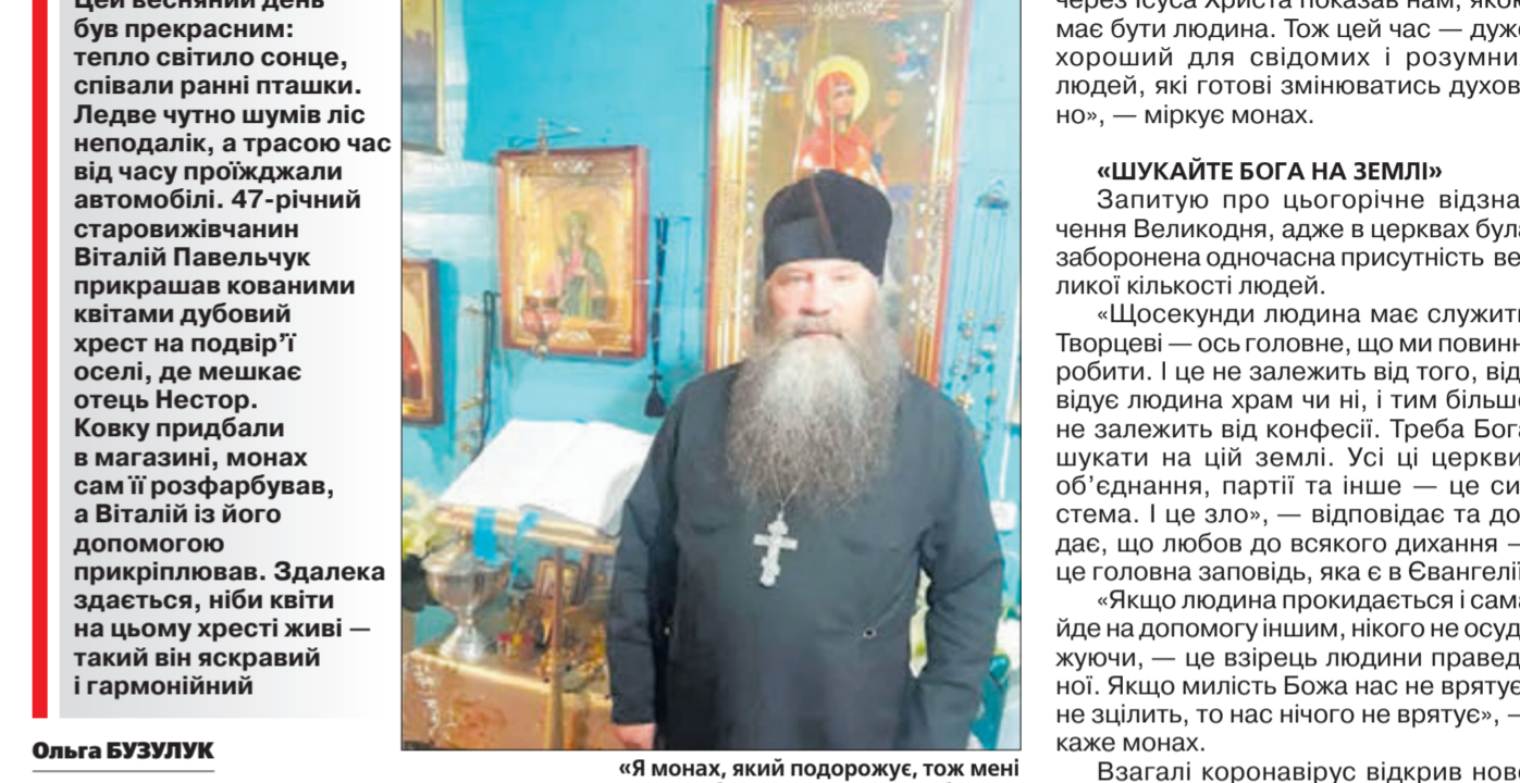
«Я монах, який подорожує, тож мені не потрібні ніякі матеріальні блага».