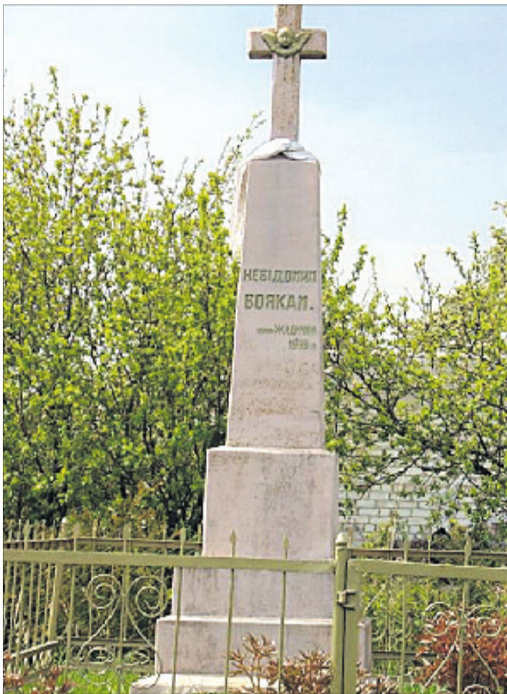
Пам'ятник «невідомим воякам» у Жидичині — фото 2019 року.

І розповіддю саме про цей об'єкт вважаємо за доречне проілюструвати винесену в заголовок та проакцентовану на початку думку щодо належного протистояння історичному безпам'ятству сьогодні. Як не прикро, у ниніш-