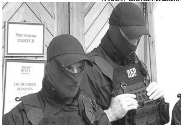
Державне бюро розслідувань у народі все частіше називають «бюро репресій».