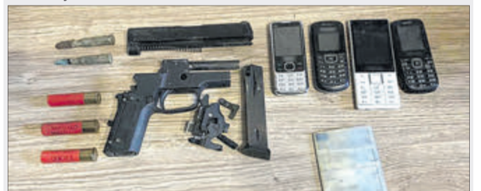
У лісокрадів знайшли навіть зброю.

24 санкціоновані обшуки у 12 жителів Ківерцівського району провели представники поліції, в тому числі роти особливого призначення КОРД, під процесуальним керівництвом прокуратури. Ці особи, ймовірно, причетні до незаконної вирубки та перевезення лісу, а також підпалу автомобіля на території лісогосподарства. Один із підозрюваних був затриманий у селі Дерно, хоча мав знаходитися у Цумані, оскільки перебуває під зобов'язанням не покидати місце проживання. Наразі його доставили в ГУНП у Волинській області для проведення слідчих дій та вирішення питання про можливу зміну запобіжного заходу у вигляді тримання під вартою. Крім того, «потрусили» і місцеві приватні пилорами, аби встановити, чи законно вони функціонують. Тут виявили та вилучили значну кількість деревини різних порід без документів про походження та без чіпів електронного обліку. Наразі встановлюється обсяг вилученого та сума збитків.