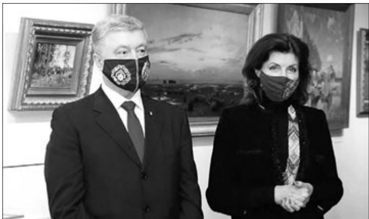
Картини, придбані Порошенками за кордоном, тепер доступні для огляду в Україні всім охочим.