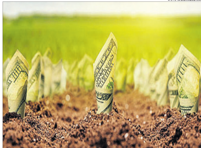
Дерибан землі завжди приносить непогані дивіденди.