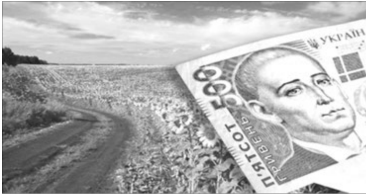
Землю дерибали тихенько між родичами, кумами, потрібними людьми і тими, хто може прислужитися, але обов'язково лояльними до керівництва?

Але ж не тільки собі — треба пам'ятати про родичів, сватів. Подейкують, що у неї є «приховані» земельні наділи в усіх селах сільради. Але це вже,