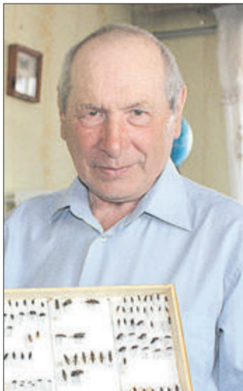
Закінчення. Початок на с. 1