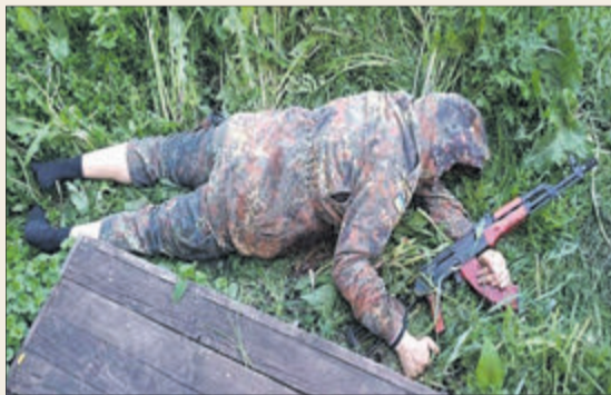
Шокуючі світлини з місця події.

Усі відпочивальники були учасниками російсько-української війни, один — волонтером. Врятуватись від розправи зміг лише один гість. Стрільця взяли під варту.