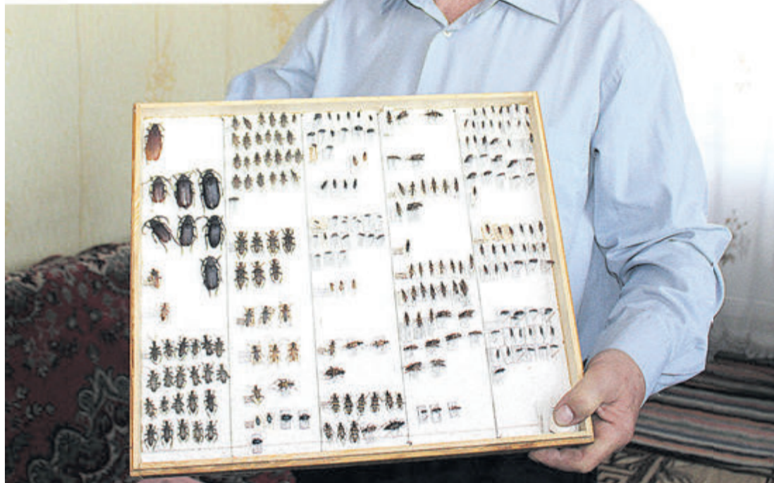
Олександр Михайлович вивчає світ комах усе своє життя.