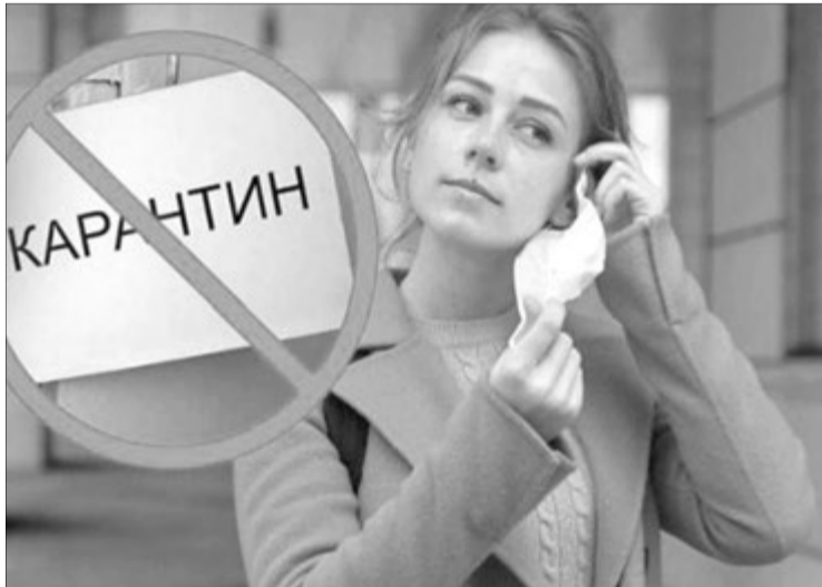
Стежити, чи люди носять маски, повинні волонтери. Так вважає глава уряду.

алістів і вимога МОЗ проводити не менше 12 тестів за тиждень на 100 тис. населення. Цей показник вони вважають украй заниженим. На сьогодні Україна — на останньому місці в Європі за кількістю протестованих громадян. Для порівняння: у нас проведено приблизно 300 тисяч ПЛР-до-