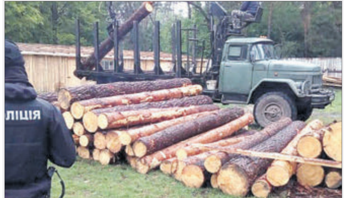
Під час обшуку виявили і вилучили багато незаконної деревини.