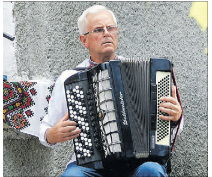
Музика для нього стала справою життя.