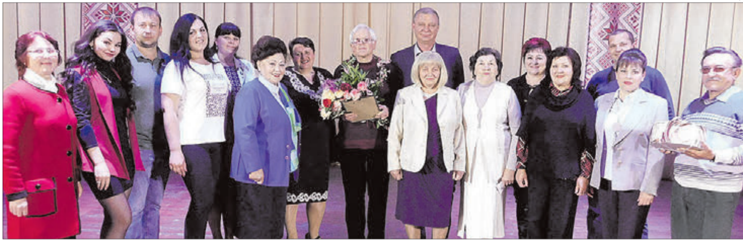
Ця світлина буде пам'ятною для всіх колег ювіляра по творчому цеху.