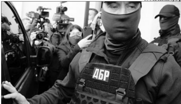
Ще б справжніх злочинців так завзято штурмували, як музейників...

«Отримано документи з суду, з яких стало зрозуміло, звідки взялася справа про 43