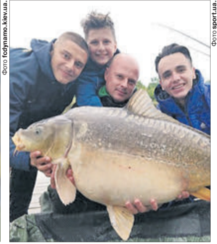
Гол у ворота ФК «Олександрія» зятятий рибалка Миколенко відсвяткував символічним жестом закидання вудки і підсікання трофея.