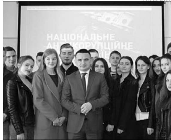
«Наш факультет — це простір, де навчаються талановиті студенти, а викладачі — досвідчені професіонали».