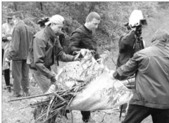
Разом працювати веселіше.

На локацію поблизу мосту за традицією і вийшли колективи Палацу учнівської молоді, дитячої залізниці та виконавчих органів міської ради. Вони впорядковували та очищали від сміття русло і прибережну захисну смугу річки. Роботу ускладнював дощ, зробивши слизькими схили. Тож працювати доводилося подекуди в екстремальних умовах. Попри те робота кипіла. За якихось пів години на березі вже зібралася гора гілляччя, пластикових пляшок, кульків... З води навіть витягли автомобільну шину. Увесь цей непотріб пакували у мішки і вантажили на машину.