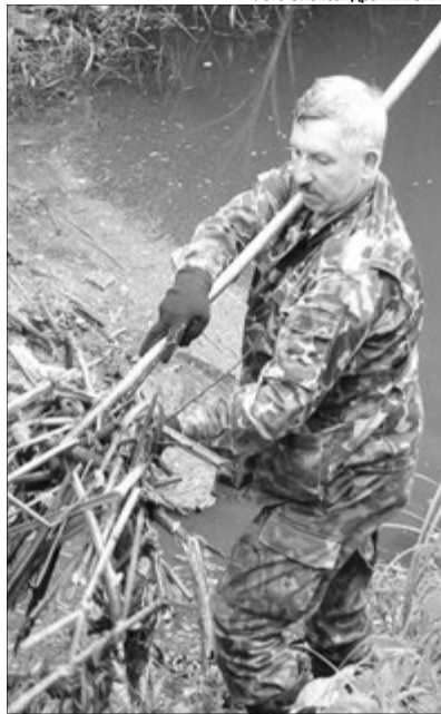
«Заберемо гілля — і відновиться водостік, річечка зможе сама очищатися».