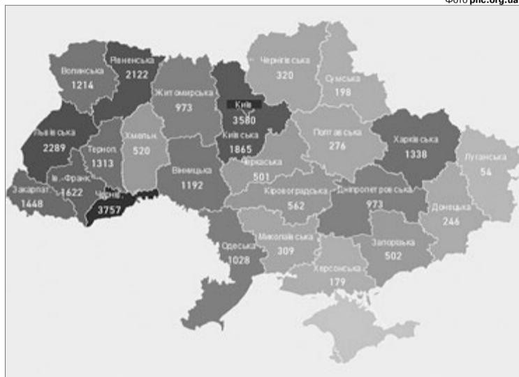
«Ковідна» карта України на ранок 10 червня.

Схожу стратегію, спрямовану на збільшення кількості тестувань, обрали і в нашій області. Але, на жаль, реально погіршила ситуацію безвідповідальність тих волинян, які послаблення карантинних обмежень сприйняли з надмірним ентузіазмом.