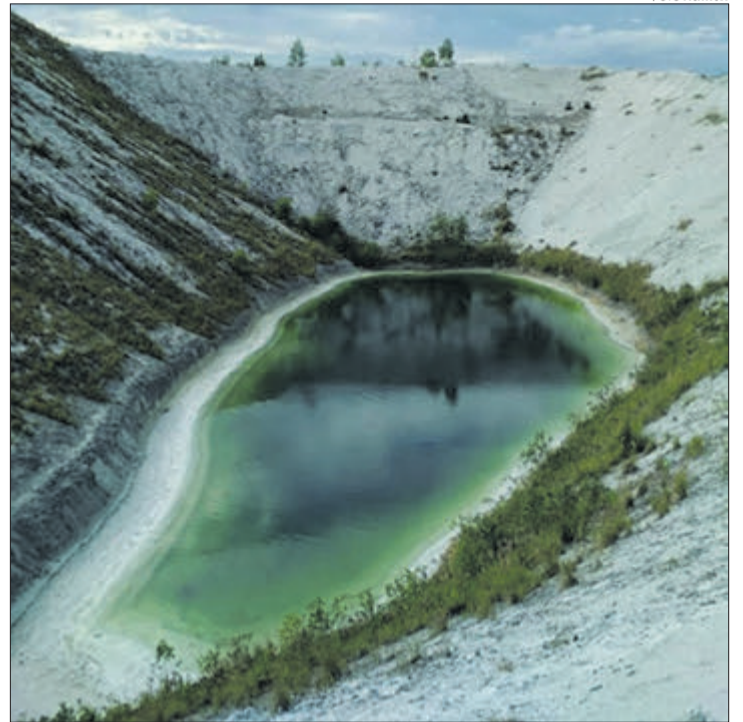
Багато людей відвідують цю місцину заради незвичних фото для соціальних мереж.

Подібна проблема є у сусідній Білорусі. Останніми роками там знайшли вихід із ситуації. По-перше, заводи почали зменшувати у фосфо-