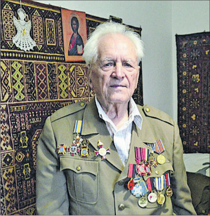
У 20 років він долучився до підпільної боротьби.