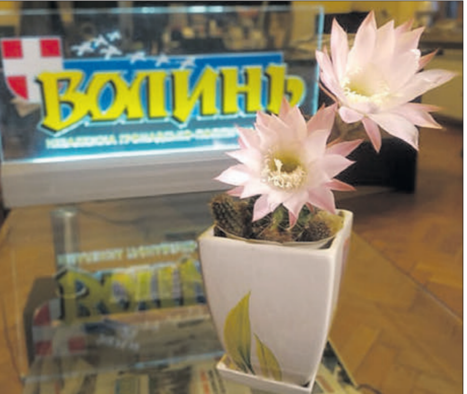
Цвіте кактус, цвіте кактус, Квіточками сяє. Хто шість годин не знімає, Кадрів цих не має...

Немає Шафети, Сачука, Манзюка... Та журналістика далі пише історію. «Волинь» називає голосно нові імена. Хай всі почують! І повторюють!