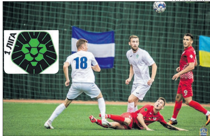
Нічия у Кременчуці відкинула лучан із трійки призерів, яка автоматично потрапляє до Прем'єр-ліги.