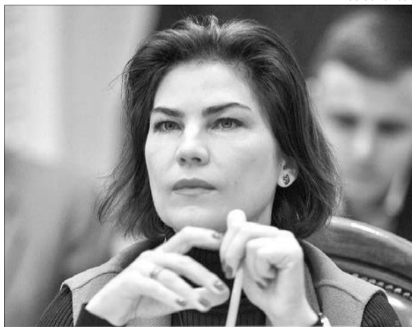
Була б людина, а стаття знайдеться, так, пані прокурорко?

Напередодні судового засідання з обрання запобіжного заходу Петрові Порошенку Ірина Венедіктова (на фото) записала відео, в якому намагалась довести, що п'ятий Президент допустив порушення, коли у 2018 році призначав на посаду першого заступника голови Служби зовнішньої розвідки Сергія Семочка