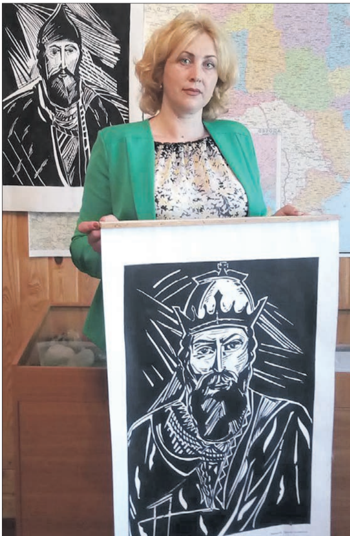
Аби написати портрети князів, мисткиня мусила опрацювати спеціальну літературу.

«Каже, ще ніколи не шкодувала віддати картину: — Хтось прийшов і хоче — я можу зі стіни зняти: бери.»