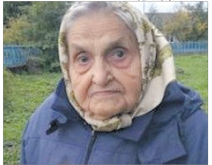
Вічна пам'ять патріотці!