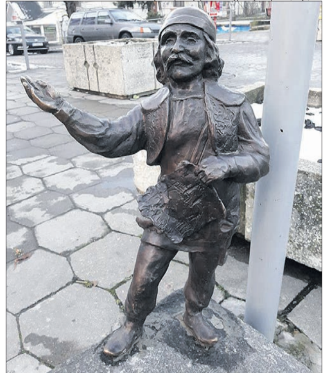
Сторожі міста, відомі з XV століття, стали історичним символом Луцька.