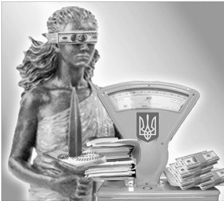
Це ретроілюстрація: нині ваги електронні й суми значно більші.

не раз звертали увагу на цю особливість американського лідера. Йдеться не про те, що Дональд Трамп не знає букв, просто він принципово уникає великих текстів. Колишній держсекретар Рекс Тіллерсон якось заявив, що президент США не читає підготовлені для нього зведення і не хоче розбиратися в деталях. Це підтверджує журналіст Майкл Вулф у своїй книзі «Вогонь і лють: всередині Білого дому Трампа». Він стверджує, що той просто не сприймає інформацію у вигляді тексту, мовляв, йому спеціально готують дуже короткі матеріали й усні доповіді, аби глава держави міг хоч трохи зануритися у проблеми своїх виборців. До речі, про них. Хто може обрати не надто грамотного