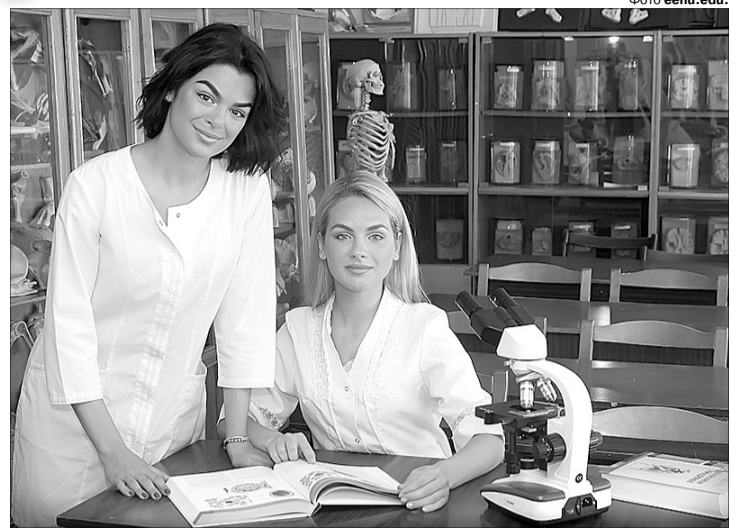
Студенти факультету мають хороші умови для навчання, оновлену матеріальну базу.

Вступив в магістратуру на дві спеціальності. Отримав можливість детальніше поглибити свої знання як із юриспруденції, так і з біології. Зокрема, зміг приділити більше часу