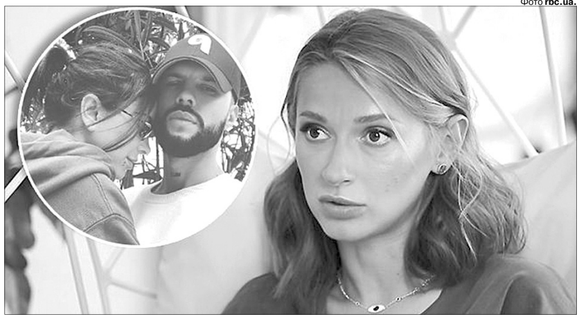
«Мені прямо казали: «Вона — відоміша, тому і пішов до неї»».

І зараз остання живе із «простим хлопцем», який допомагав їй робити ремонт