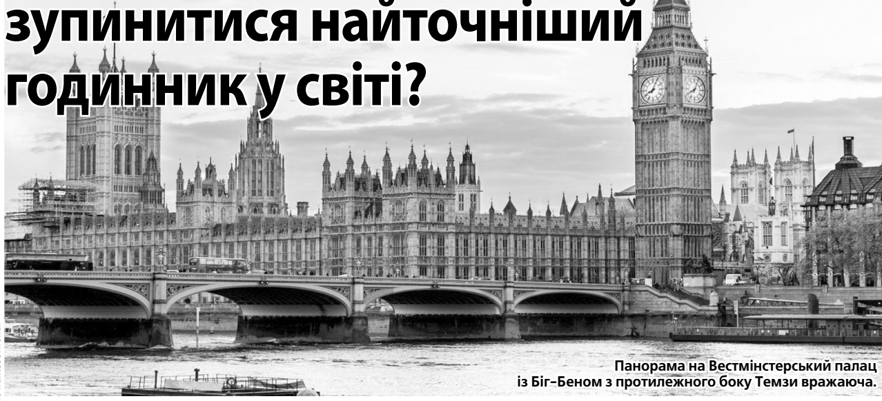
Панорама на Вестмінстерський палац із Біг-Беном з протилежного боку Темзи вражаюча.

У 2008 році за результатами загальнонаціонального опитування найпопулярнішою визначною пам'яткою Великої Британії було визнано лондонський Біг-Бен. Це вежа з чотирма циферблатами, які дивляться в різні сторони світу з висоти 55 м над землею. Годинникова стрілка цих дзигариків довжиною 4,2 м вилита зі сталі, а менша (2,7 м) — хвилинна — з чавуну. В основі кожного циферблата Біг-Бена вигравіюваний латинський напис «Domine salvam fac Regiam nostram Victoriam Primam» («Боже, бережи нашу королеву Вікторію I»). А справа і зліва — «Laus Deo» («Хвала Господу» або «Слава Богу»)