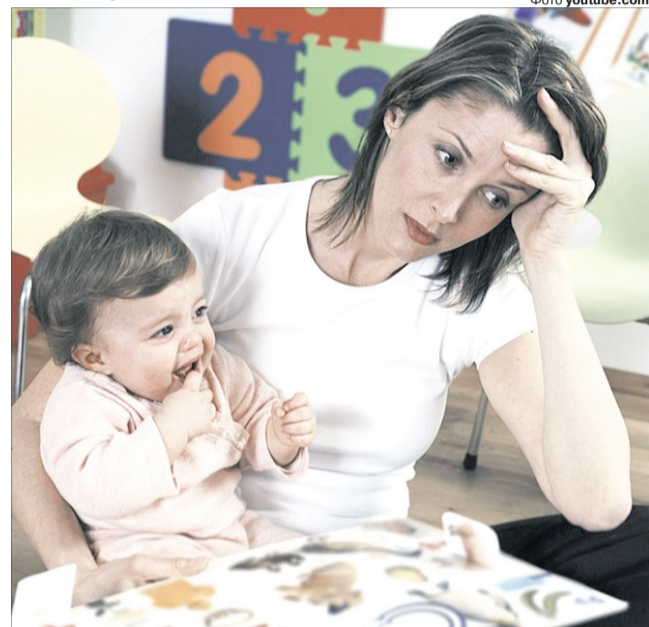
Матусі теж не застраховані від синдрому хронічної втоми.