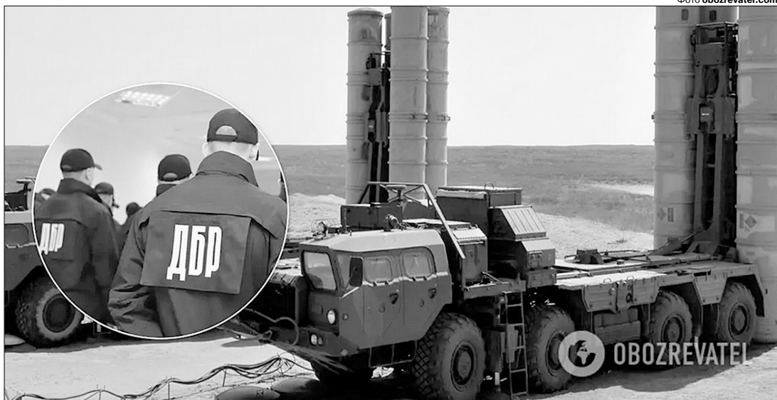
ДБР усунуло від виконання службових обов'язків співробітників, які вивели з ладу систему ППО України. І це все покарання? А хто віддавав їм наказ?

Це настільки дикий факт, що в нього важко повірити. Але правда виявилась ще більш прикрою. Адже, щоб зупинити вилучення важливого обладнання, командування Протиповітряних сил України було змушене піти на безпрецедентний крок — звернутись до укра-