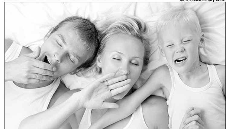
Позіхання допомагає організму регулювати температуру мозку.