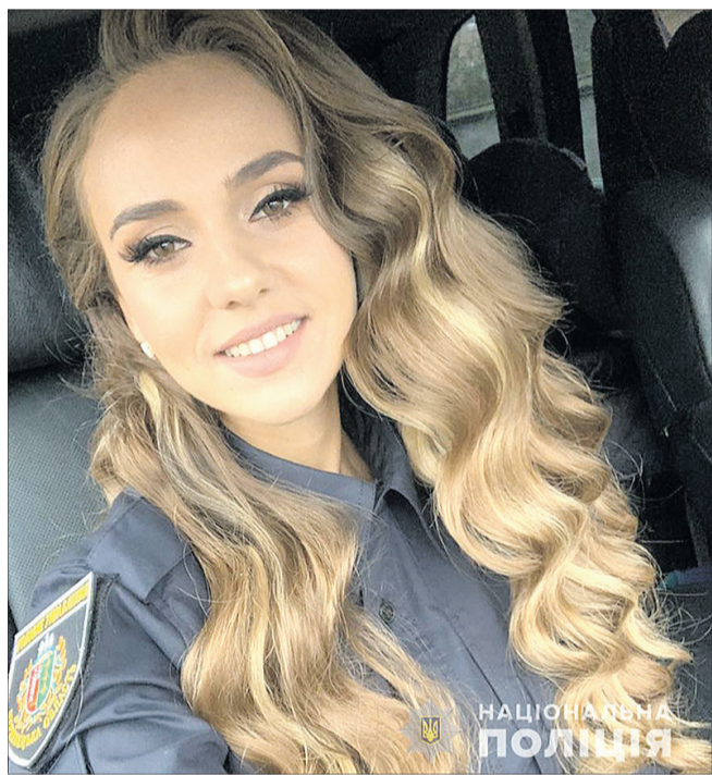
Краса душі — найвища в світі цінність.