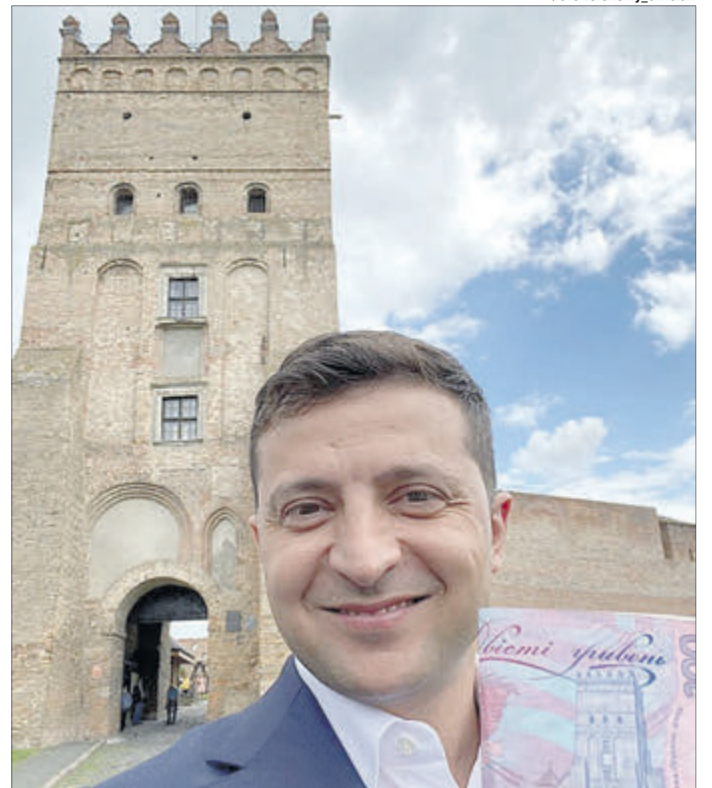
Володимир Олександрович признався, що мріяв про таке фото.