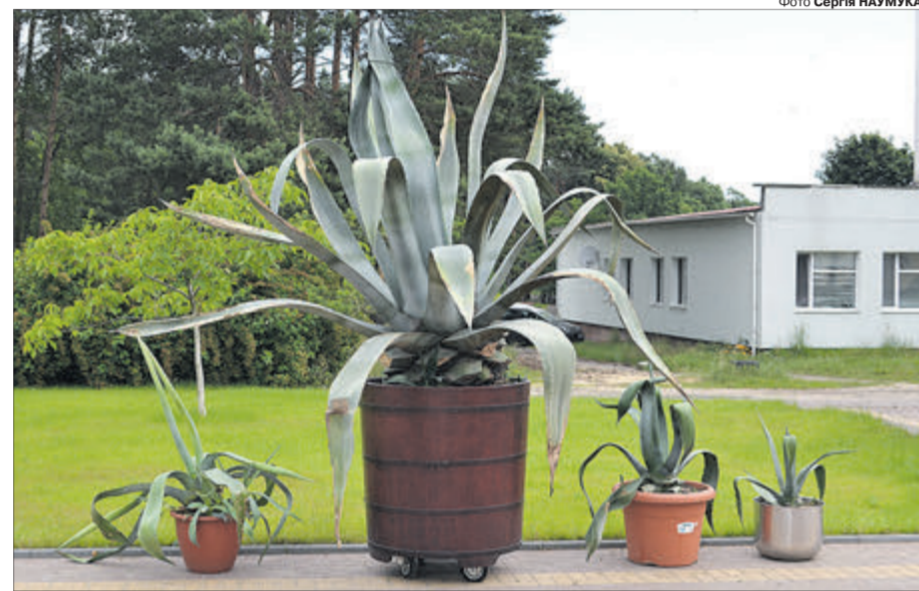
Вазону-гіганту — 35 років, найменшому — 5.