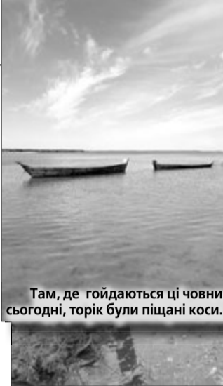
Там, де гойдаються ці човни сьогодні, торік були піщані коси.

І ось цього літа ми уже не кричимо SOS з приводу обміління Світязя. Після рясних травневих дощів, а згодом і червневих та липневих, озеро стало повноводнішим. Про це знала із соціальних мереж — відпочивальники виставляли фотознімки з радісними коментарями з приводу того, що хоч і далеко йти до місця, де можна комфортно поплавати, але «місячних пейзажів», що жахали, уже нема. Згодом і сама мала можливість в цьому переконатися, побувавши на улюбленому озері. Найперше подумалося, що не ми, люди, рятуємо Світязь, а Господь Бог. Змилювалася природа — пішли дощі, і катастрофа відступила, оскільки озеро