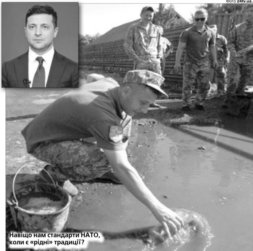
Навіщо нам стандарти НАТО, коли є «рідні» традиції?