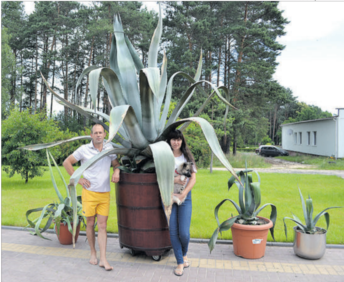
«Мексиканка» пречудово почувається на Поліссі.