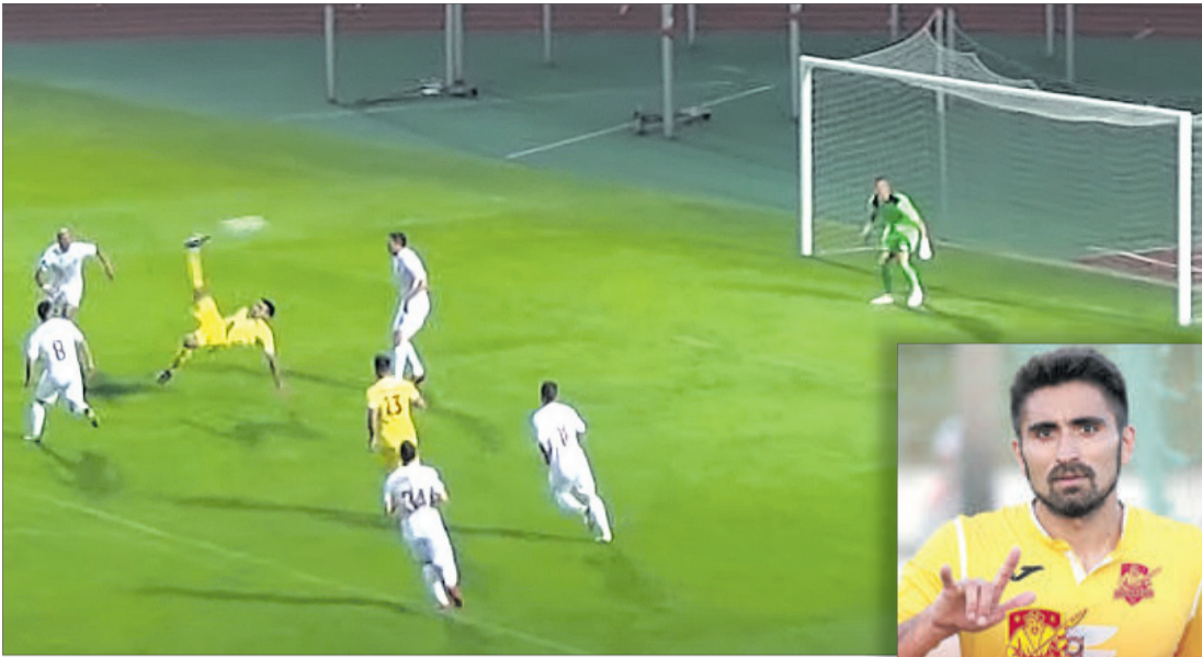
Після такого удару можна і пальці показувати «віялом».