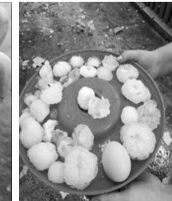
Ось такі льодяні кулі летіли з неба.