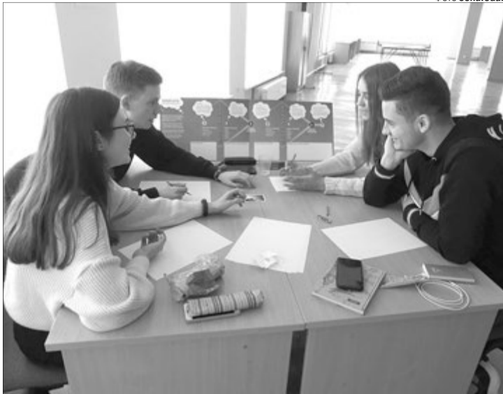
Перспектив, які відкриває для молоді навчання на факультеті економіки та управління, більш ніж достатньо.

Сьогодні економіка відходить від традиційної схеми товар-гроші-товар і вибудовується на трьох основних принципах: оцінці ризику, ставленні до інших людей та прогнозуванні майбутнього. Такі тенденції водночас зумовлюють зміну підходів до підготовки економістів та управлінців, адже важливим стає не просто формування фахових компетентностей, а й прищеплення моральних цінностей. Саме в такому ключі і здійснюється підготовка спеціалістів на факультеті економіки та управління Східноєвропейського національного університету імені Лесі Українки