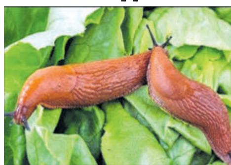
Дайте їм білі!

Слимаки можуть завдати чималого шкоди садку, городу або ж клумбі. Помітити, що вашу фазенду атакують ці істоти, можна за липкими білими або прозорими слидами та погризеними листками. Вони живляться овочами, фруктами, ягодами, листям та квітами. Пошкоджені рослини припиняють фотосинтез, а квіти не запилюються, що призводить до зменшення врожаю. А погрізені плоди просто гниють