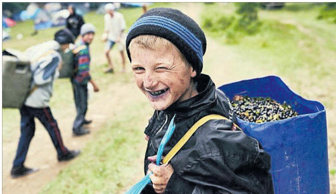
Сьогодні на Поліссі усі по ягоди ідуть і «діточок своїх ведуть».