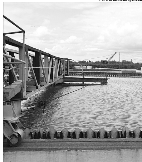
Тут відбувається очищення міських стоків.