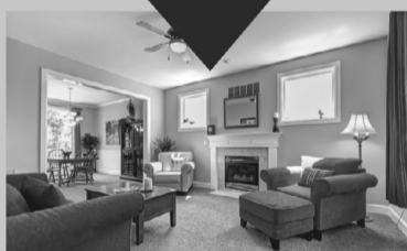
Новий ремонт і побутова техніка