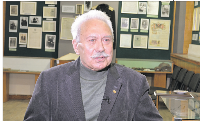
Його називають хранителем любомльської старовини.