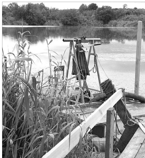
Із біоставка вода потрапляє у Стир.