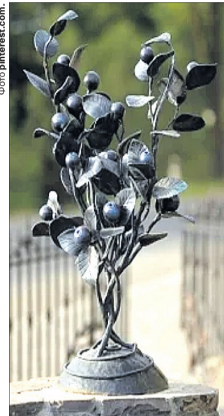
А на Закарпатті, в селі Гукливий, яке вважають столицею чорниць в Україні, навіть встановлено пам'ятник цій ягоді.

«Дошкуляє спека, хочеться зняти куртку, але ж якби не клятї гостроносі! Спрей не діє. Розплодилося їх цьогоріч — хмарами літають, бо ж дощі не припиняються.»