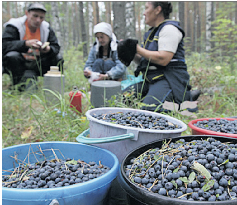
«Сьогодні у нас вдалий день — за виручені гроші можна буде купити дітям взуття».

Попшикавши себе «французькими парфумами» — спреєм від комарів, приступаємо до роботи. Стараємося працювати швидко і якісно, бо ще ж треба продати зібране. Проте швидко не завжди вдається — комарі не дають розігнатися: лізуть в очі, рот, ніс, кусають за руки. Часто через них розсипаєш добрячу