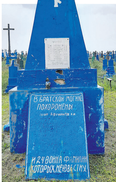
Із роками на пам'ятнику з'явилася меморіальна дошка, доповнена частиною прізвищ визволителів.