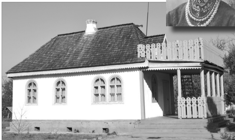
То чи матиме садиба Косачів нове життя?