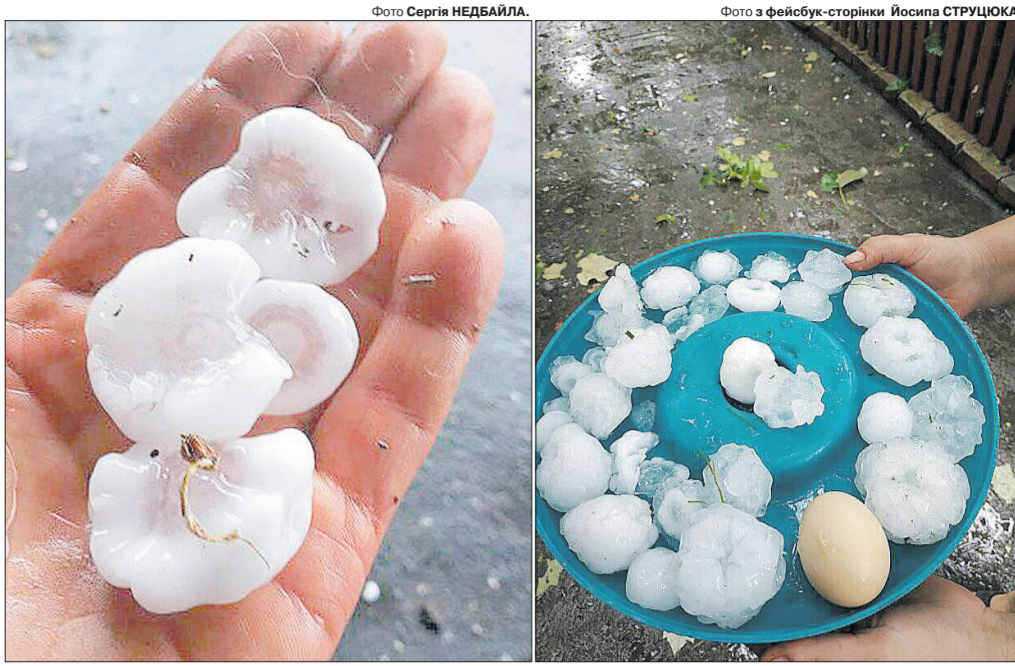
Такі льодяні кулі і здивували людей липневої пори, і засмутили, бо ж збитків значних завдали.

Комісія із представників Павлівської ОТГ здійснює подвірні обходи, під час яких встановлює розмір збитків. Вирішується питання їх компенсації, а також тривають роботи з ліквідації пошкоджень.