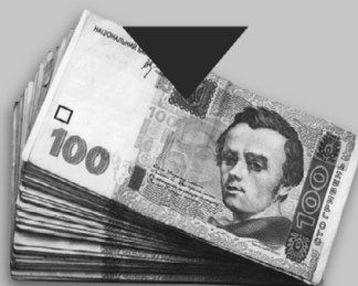
Чималий рахунок у банку