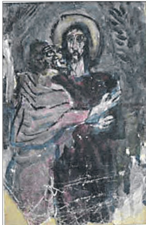
Уродженець Волині мав свій художній почерк.