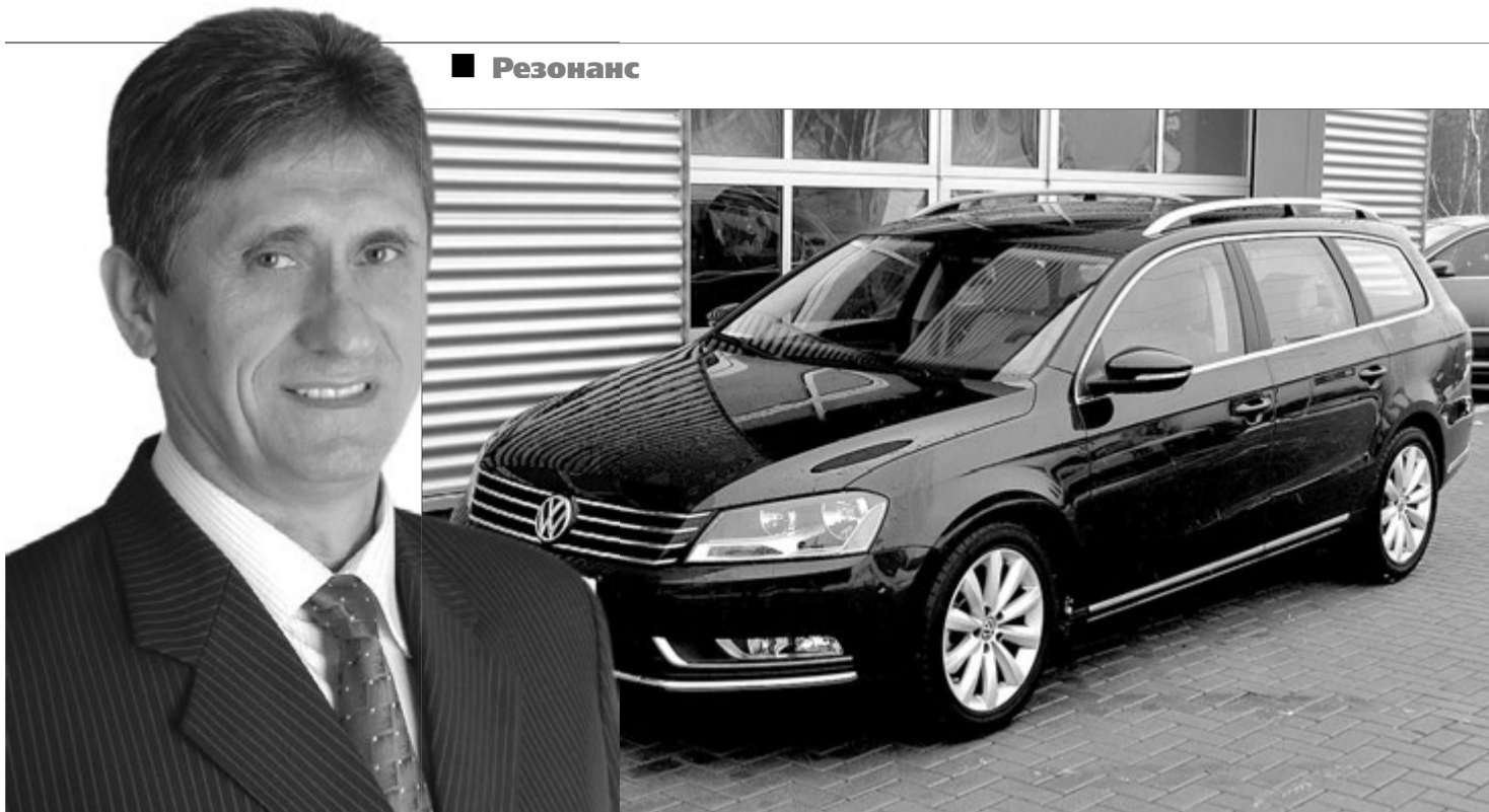
Не слабо: пан чиновник тепер пересів на «Volkswagen Passat B7».