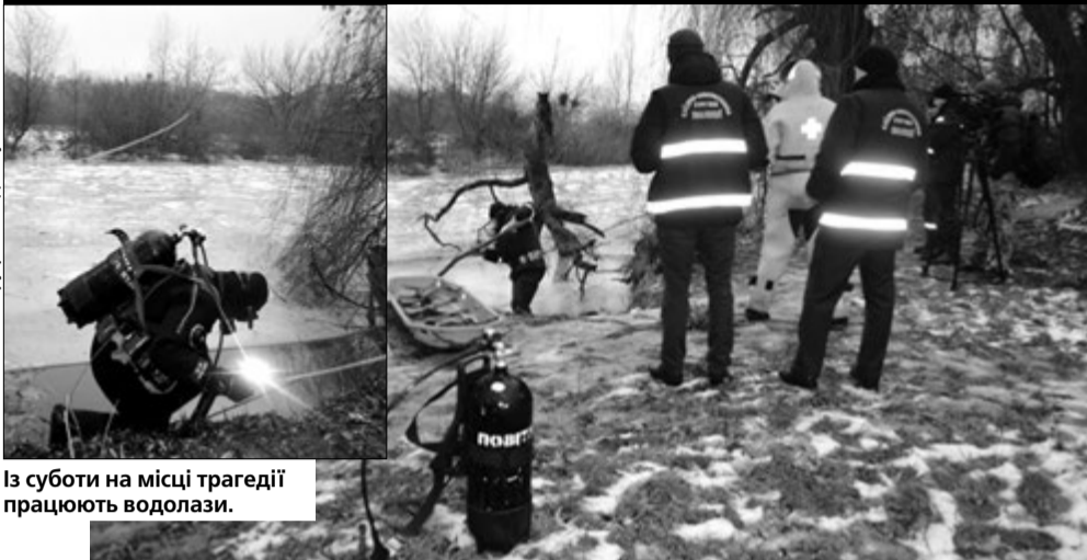
Із суботи на місці трагедії працюють водолази.