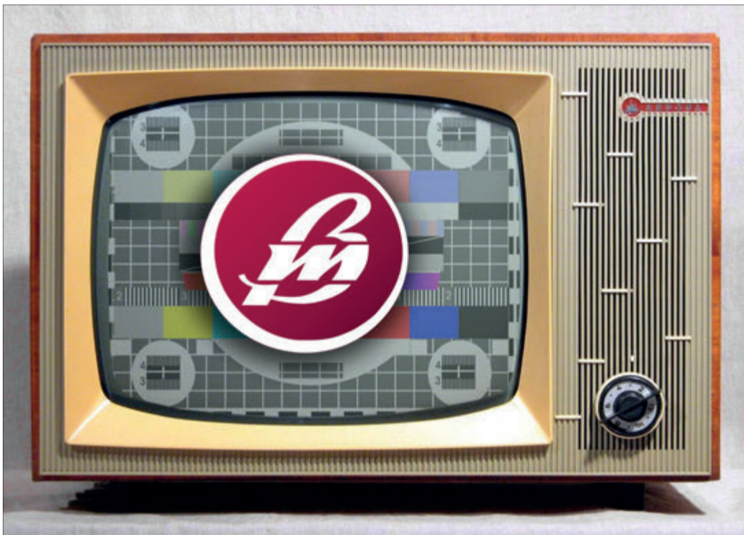
Старе ВТ «прикрили». Яким буде нове?