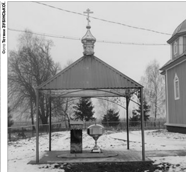
Тепер жителі села мають ще одне місце для спільної молитви.

Свою капличку миряни назвали Водохресною. У хвилини її освячення ревно молилися за здоров'я односельчан, краян, воїнів АТО.