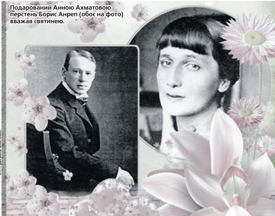
Подарований Анною Ахматовою перстень Борис Анреп (обоє на фото) вважав святиною.

Кохання для творчої людини — це як ковток повітря. Після знайомства з Борисом Анна пише своєму другу проникливі вірші. Вважається, що більша частина творів Ахматової присвячена саме Борису Анрепу. Він у свою чергу у мозаїці увіковічив образ Анни. В ірландському місті Меллінгар знаходиться собор Христа-Владики, прикрашений мозаїчною композицією, у центрі якої Свята Анна. На думку тих, хто це бачив, у святої абсолютна схожість з російською поетесою Анною Ахматовою.