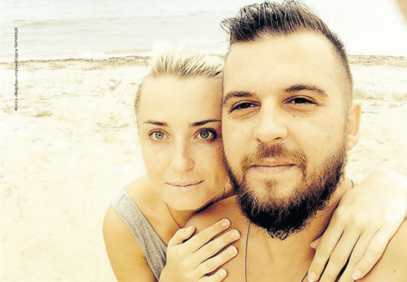
«Дякую своїй дружині, багато текстів народжувалися завдяки їй», – зізнається співак і автор текстів.

а не емігрувати в чужу державу. Ми поїздили трішки по світу. Мені подобаються закордонний рівень життя, вихованість, дороги, але маю бажання жити тут. Я бачу не себе в Європі, а Європу в собі.