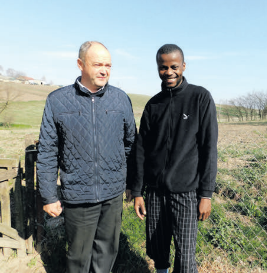
У Журавниках до темношкірого односельчанина вже привычались.