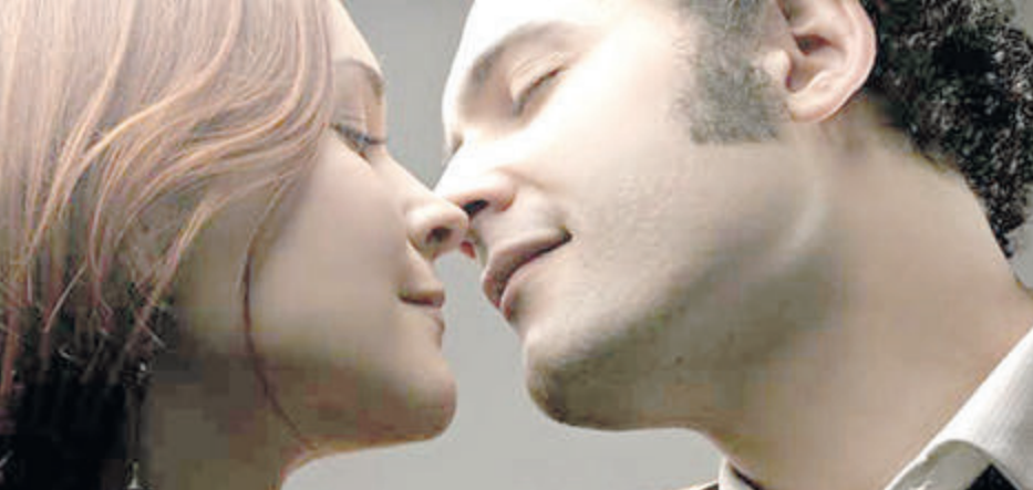
Коли до губ твоїх лишається півподиху...