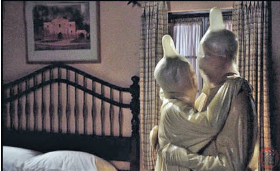
Колаж Олексія ГОЛОВЦЬКОГО