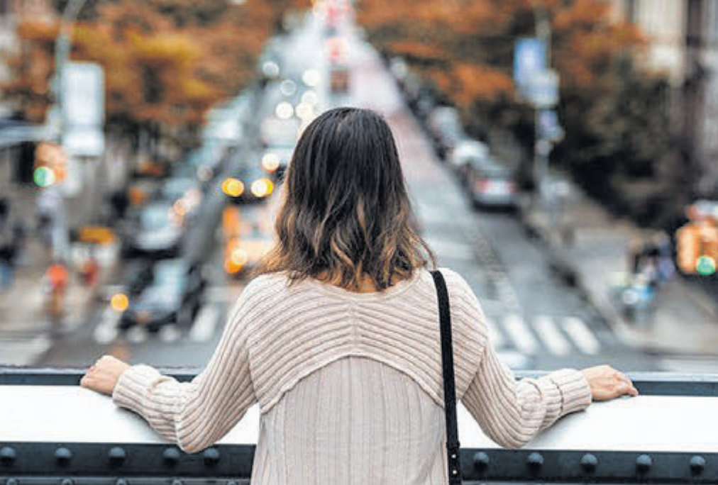
«Залиши минуле — минулому. Починай нове життя, дівчинко».