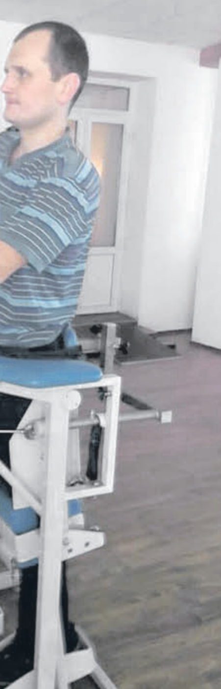
«Добре, і сам багато зусиль докладає»

— Кожному на роду написана його доля. Що має статися, те станеться... Можна на рівному місці впасти і покалічитись.