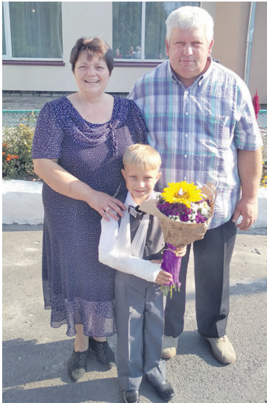
Раділи за сина-школярика тато з мамою, зичила йому успіхів уся родина.