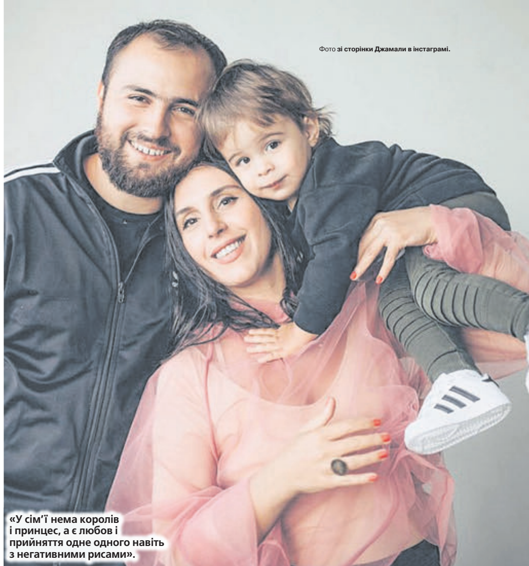
«У сім'ї нема королів і принцес, а є любов і прийняття одне одного навіть з негативними рисами».

Відчайдушний крок в майбутнє. Лагідний твій сміх знов приніс весну, Він паростком пробився у моїй душі.