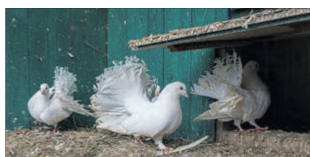
Дружно живуть у господарстві фазани та голуби.

« У птахівників найбільша проблема — кваліфікована ветеринарна допомога. Немає фахівців. У Ківерцях знають, як лікувати свиней, корів та коней. У Луцьку спеціалісти займаються котами й собаками, а птахами нема кому. »