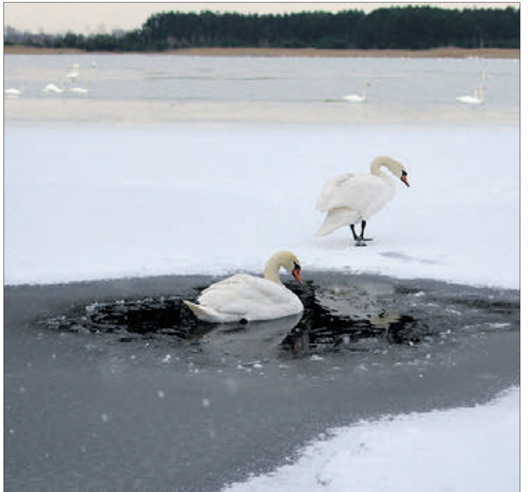
Птахи обрали місце зимівлі через добру кормову базу.

«Як-то ви тут будете, коли настануть сильні морози, котрі обіцяють у найближчі дні?»