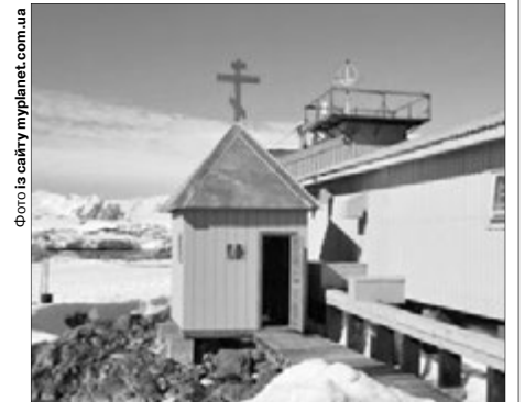
Ось вона — каплиця святого рівноапостольного князя Володимира.

на станції каплицю святого рівноапостольного князя Володимира. Це найпівденніша культова споруда у світі. В Антарктиді є ще російська церква Святої Трійці на станції «Беллінсгаузен» та болгарська капличка святого Іоана Рильського на станції «Святий Климент Охридський». ■