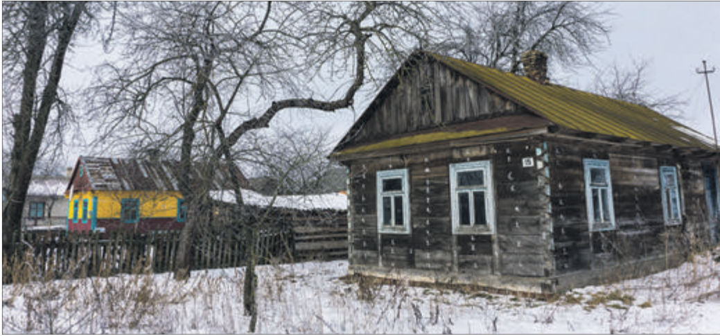
Сільський зимовий пейзаж.