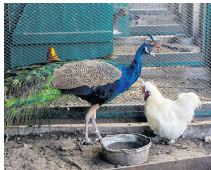
Птахи ходять один до одного в гості.