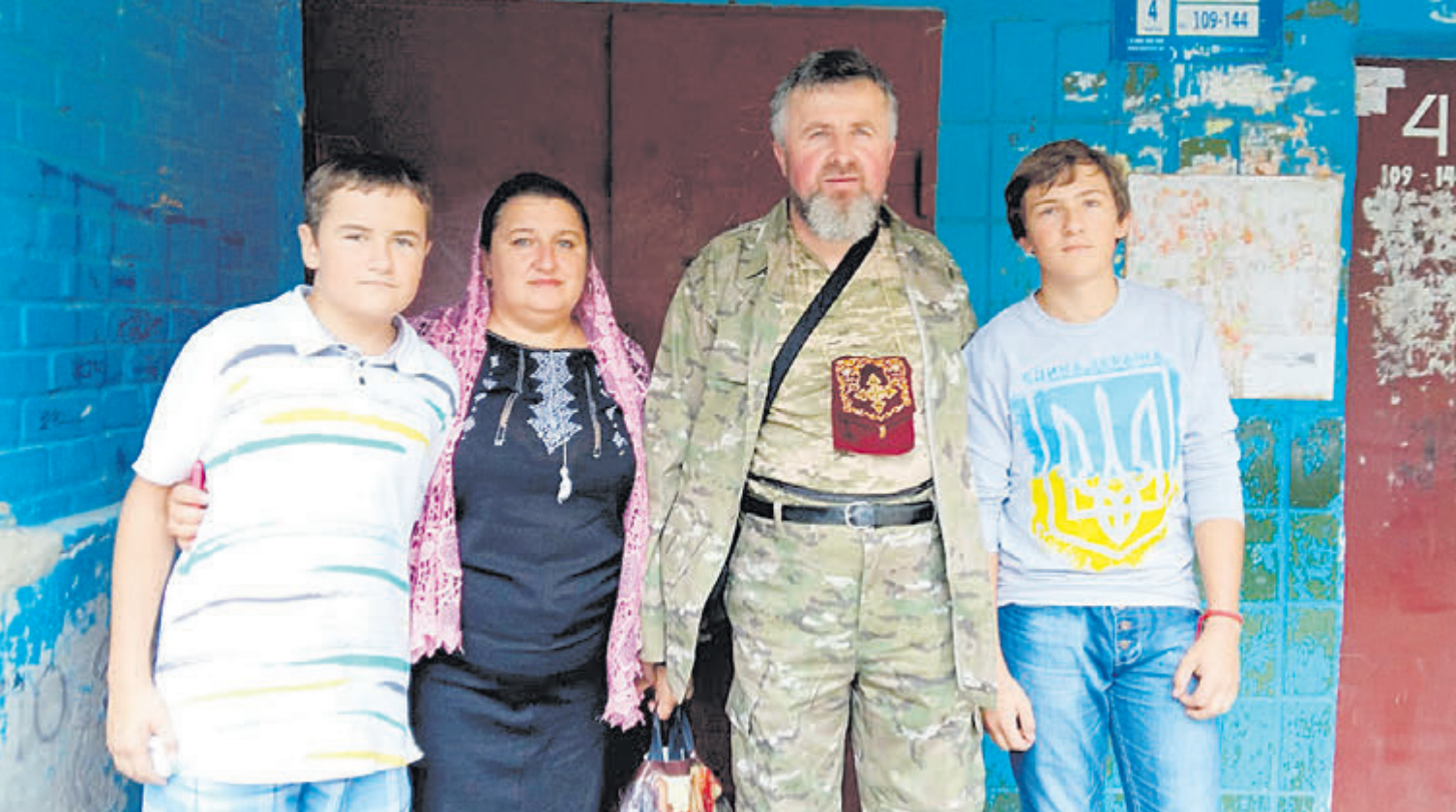
Проводи чоловіка, батька в АТО.