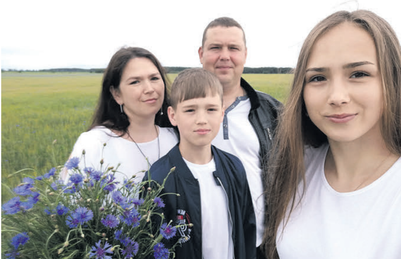
Бог дав подружжю двох дітей – доньку і сина.