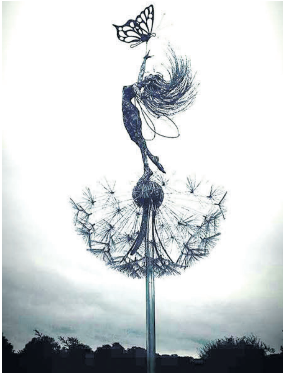
Життя дарує тобі людей. Необхідних для чогось. Вчасно.