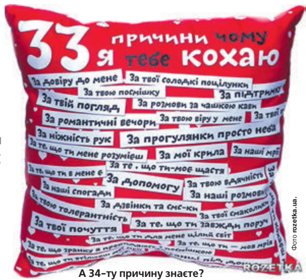
А 34-ту причину знаєте?

«Знаю, що мій чоловік уміє бути ніжним і сердечним. Він завжди такий із нашим псом».