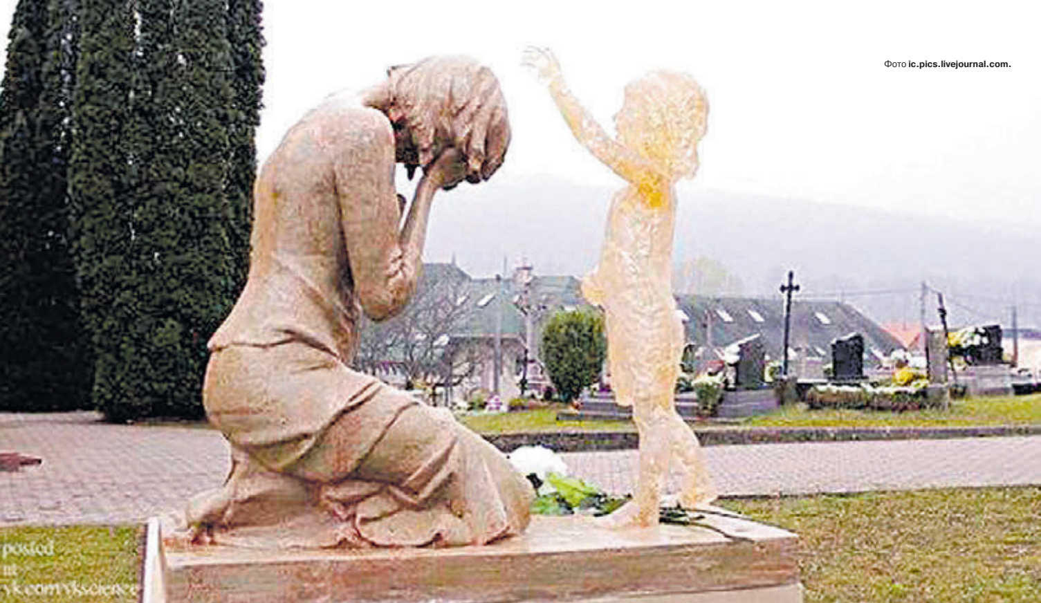
«Мамо, не плач» — такий пам'ятник ненародженим дітям є в Словаччині. Його автор – скульптор Мартін Гудачек.