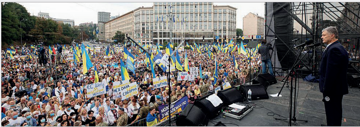
24 серпня: якщо зранку чинний глава держави Володимир Зеленський виступав на Софіївській площі перед купкою запрошених, то після обіду на Європейській площі п'ятий Президент виголошував промову перед великим людським «морем».