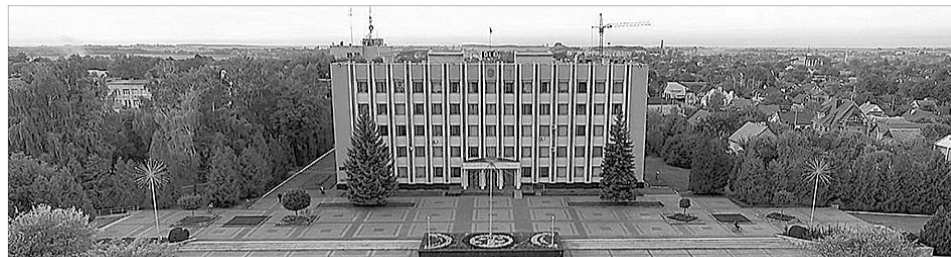
На цій будівлі вперше в 1990 році замайорів синьо-жовтий стяг.