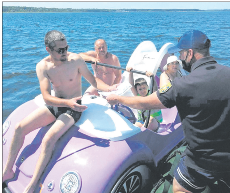
На катамаранах варто плавати у спецжилетах.