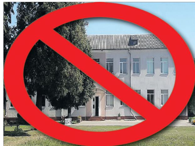
9 років тут навчалися, а тепер – зась.