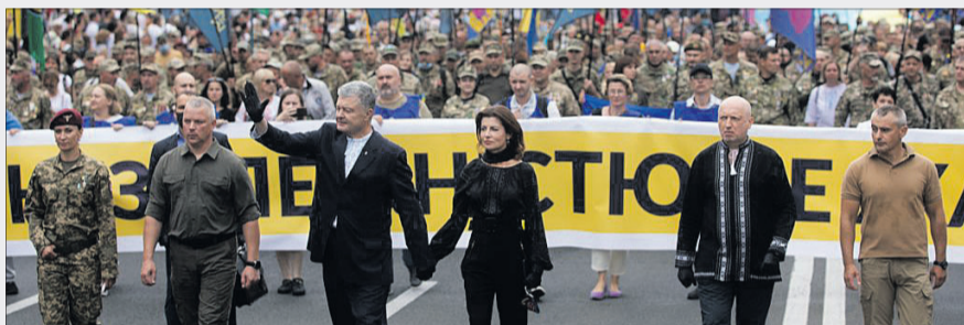
Петро Порошенко з дружиною Мариною очолили Марш Незалежності, на який прийшли ветерани, волонтери та просто небайдужі українці.

Про це під час промови на багатотисячному мітингу на Європейській площі сказав п'ятий Президент України, лідер партії «Єв-