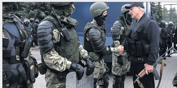
Озброєні до зубів «космонавти» — ось на чому тепер тримається диктатура «кривавого Луки».

Нагадаємо, що дії силовиків у Білорусі після виборів 9 серпня відзначались неабиякою жорстокістю. Людей хапали на вулицях і катували по кілька днів. За словами Тихановської, білоруси прагнуть домогти-