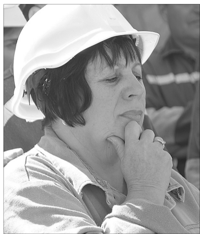
Після спуску в шахту ще раз переконалася, яка важка це праця – добувати вугілля.