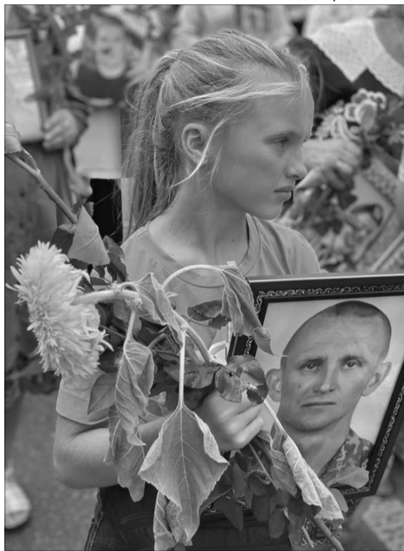
Як витерти сльози Ярославці?

Кожен справді мав цьогоріч такий День Незалежності, на який заслуговує, як його відчуває. Хтось одягнув вишиванку і слухав пісні далеко не високого змісту, а хтось, як ця дитина, тримав у руках зів'ялий соняшник. І гірко плавав. За татом-Журавлем.