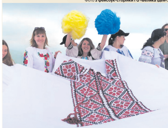
Про вишиту сорочку з Ковеля тепер говорять вся країна.