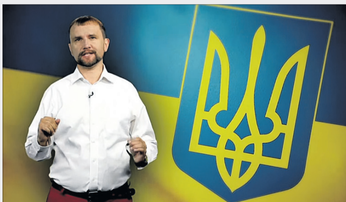
Такого древнього і водночас сучасного герба не має ніхто у світі. Навіщо «слугам» уподібнюватись до комуністів і псувати його?

Про це заявив народний депутат фракції «Європейська Солідарність» Володимир В'ятрович (на фото). «Верховна Рада не знайшла часу, щоб розглянути стан нашої оборони й безпеки в умовах російської агресії, серйозні підозри вищого керівництва держави у зраді, стрімке падіння економіки, не менш стрімке поширення коронавірусу чи драматичну ситуацію в Білорусі. Зате Верховна Рада знайшла час, щоб знов — уп'яте за три десятиліття — оголосити конкурс на створення Великого державного герба», — написав В'ятрович на своїй сторінці в соціальній мережі Facebook.