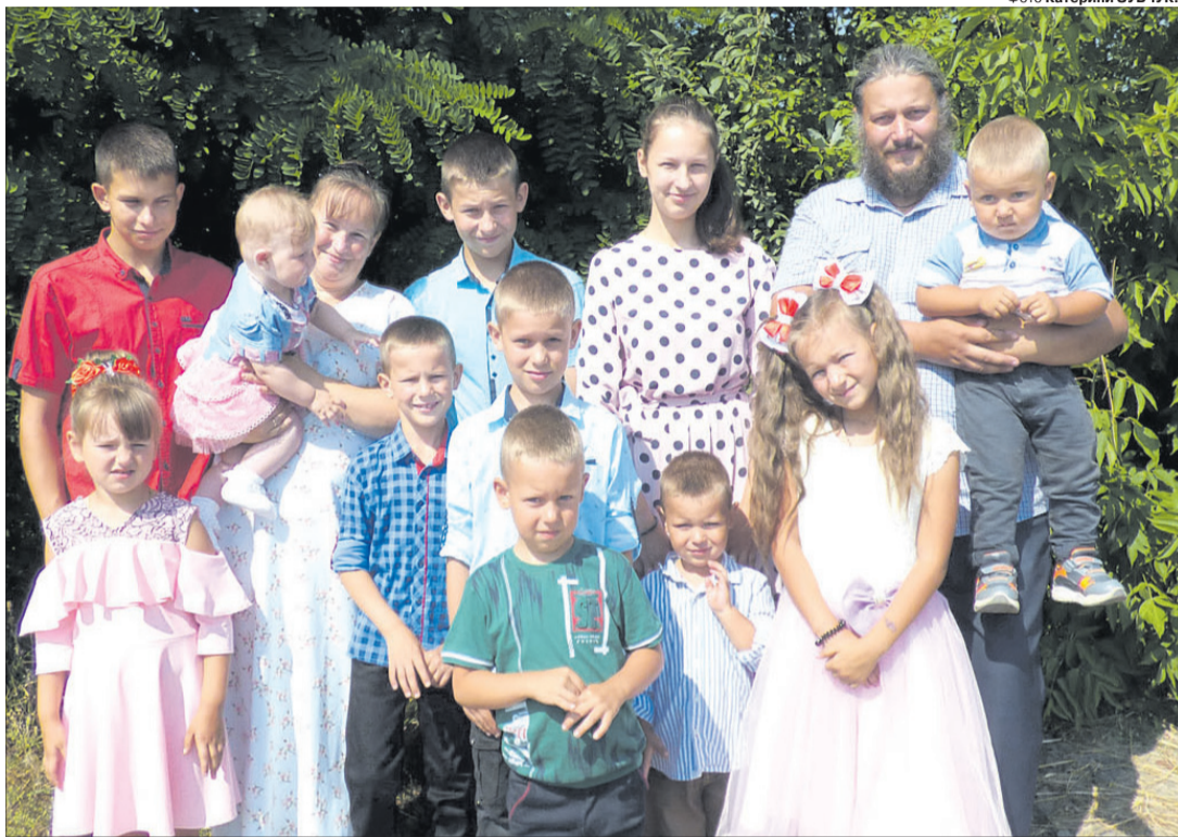
Ось вона – найбільша сім'я села на Поліссі, яка на фото ще не в повному складі.