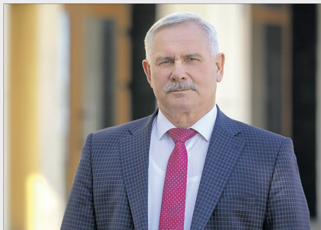
«Спасибі всім, хто своїми руками зводив і розбудовує Нововолинськ, вкладаючи частинку своєї душі».

Шановні волиняни! Уже сім десятиліть нововолинці пишуть історію рідного міста. Своім народженням воно завдячує гірникам. Хоча нині вугільна галузь переживає нелегкі часи — із 9 волинських копалень залишилося лише 2, однак статусу шахтарського Нововолинська не втратить ніколи. Паралельно, як альтернатива закритим шахтам, — майже 40 промислових підприємств, які з року в рік зростають на теренах міста, зараз успішно розвиваються