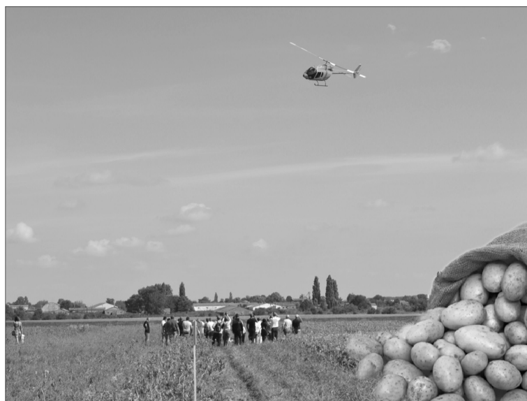
Не на кожен День поля прилітають гвинтокрилом.