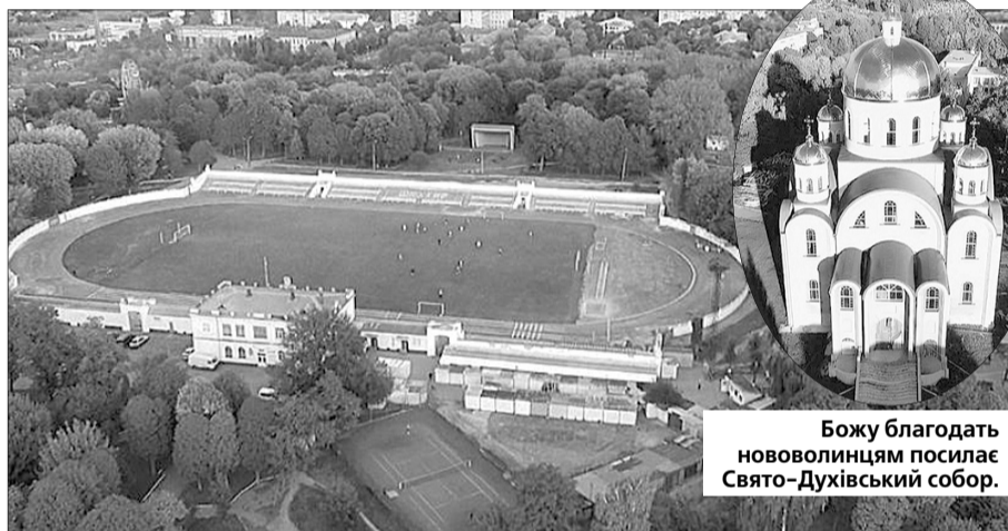
Оновлений стадіон – окраса міста.

У кількох номерах опубліковані думки людей з приводу будівництва пам'ятника Шевченку під красномовною назвою «Хто на цій землі пустив коріння». Газета оперативно інформувала читачів про створення страйкового комітету, про перші протести, мітинги — гірники тоді продемонстрували солідарність і вміння відстоювати не лише економічні, а й політичні вимоги. Відбувався злам епох, країна була на порозі переми, у фарватері яких серед перших ішов