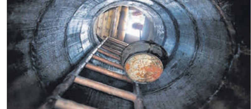
Не знаємо ціну водиці, поки не висохла криниця.