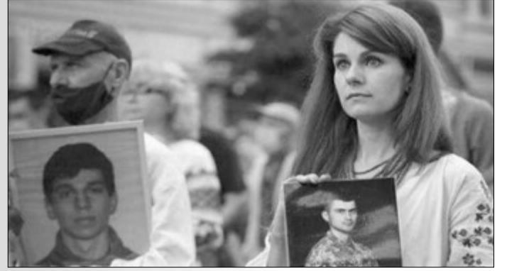
24 серпня душа Тараса була разом з іншими захисниками України на Марші Незалежності.