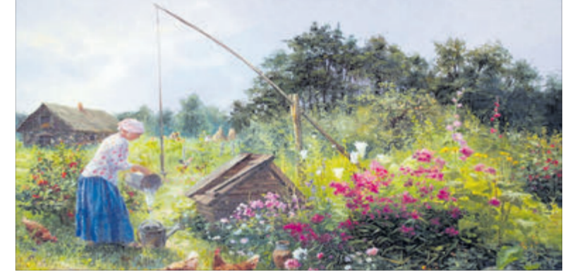
У народі кажуть: який колодязь — такі й господарі.