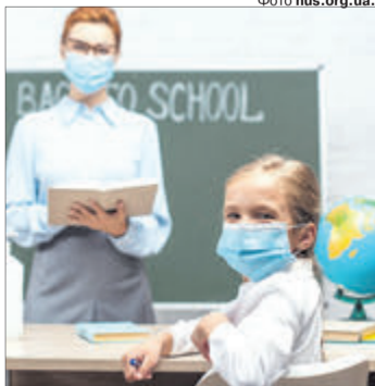
Волинські школярі сьогодні всі пішли до школи, а ось сусідів-рівняни і львів'яни — ні.

жодного міста й району з Волині. А от сусідам пощастило менше: міста Дубно та Острог, Костопільський та Радивилівський райони Рівненської області на коронавірусній карті позначені червоним. Це означає, що діти там не змогли сісти за парти, введено і ряд інших жорстких обмежень.