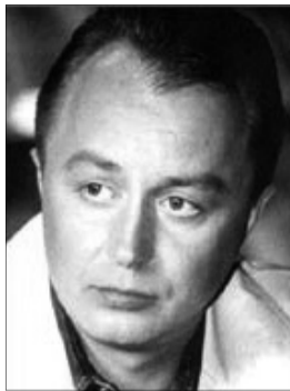
Музиканта, композитора, виконавця уже нема з нами, а пісні його живуть.