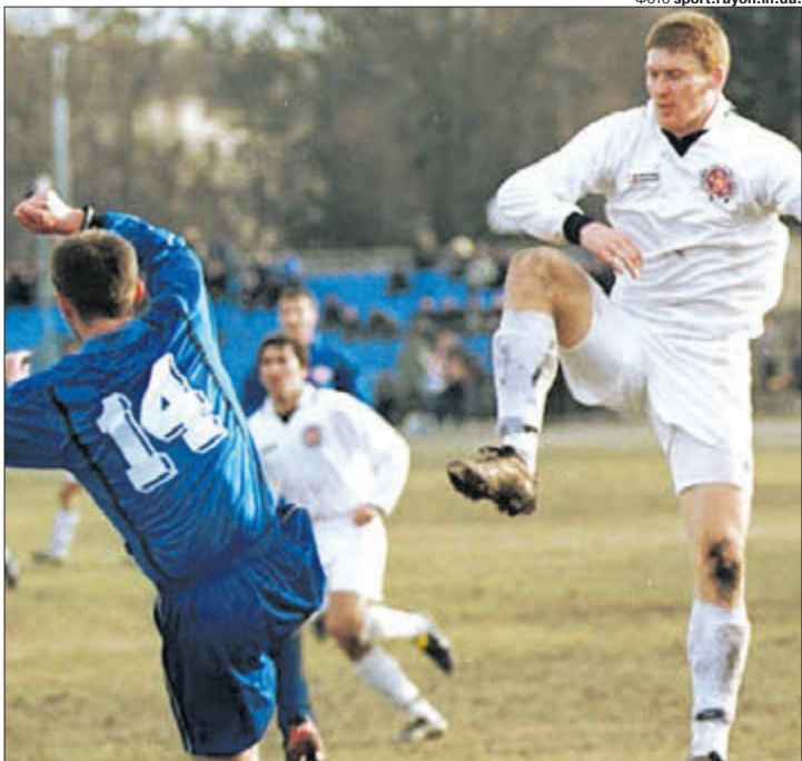
З дороги, супернички, — інакше розтопчу!