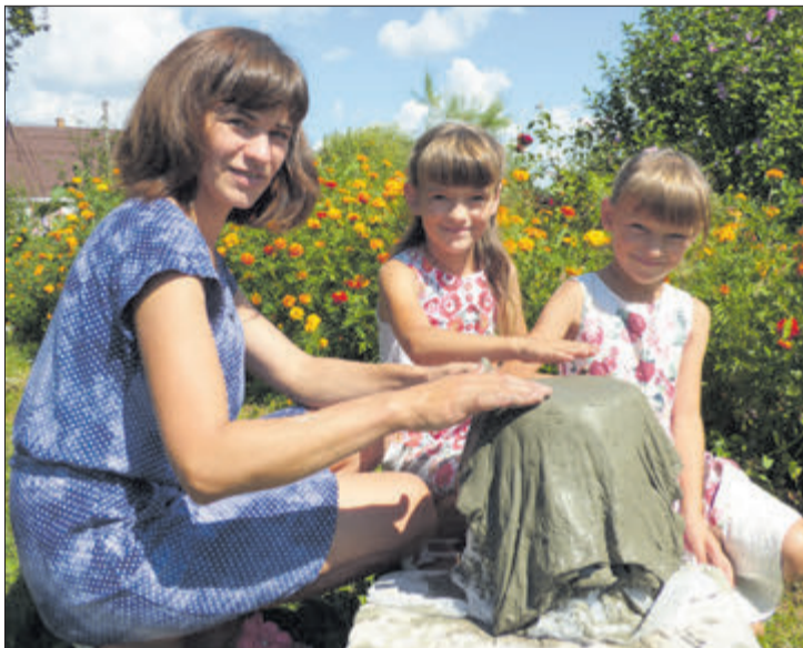
«Діти — то моє натхнення для творчості», — каже жінка.