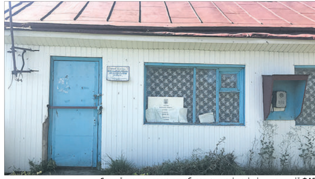
Єдиний «центр», де можуть збиратися «маріяволиці», — колишній ФАП.