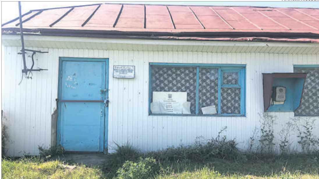
Раритетний телефон-автомат — спогад про колишню «цивілізацію».