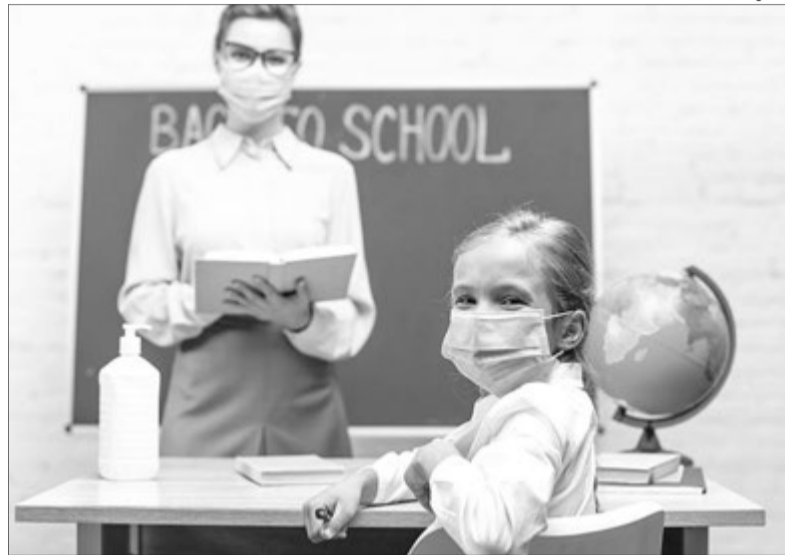
Такого ПершOVERесня у нас ще не було.

Тому можна було очікувати, що з понеділка до помаранчевої зони потраплять Луцьк та Володимир-Волинський, Луцький