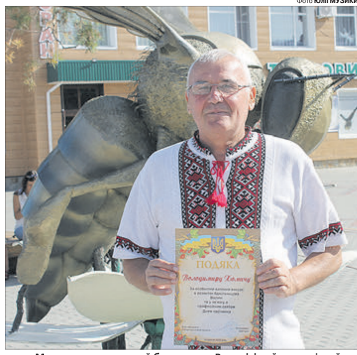
Маневичанин – знаний бджоляр на Волині, і найприсмішше йому на пасіці пожинати плоди своєї праці.