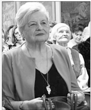
Любов Максимівна — перша жінка, яка удостоїлася в рідному місті такої шани.