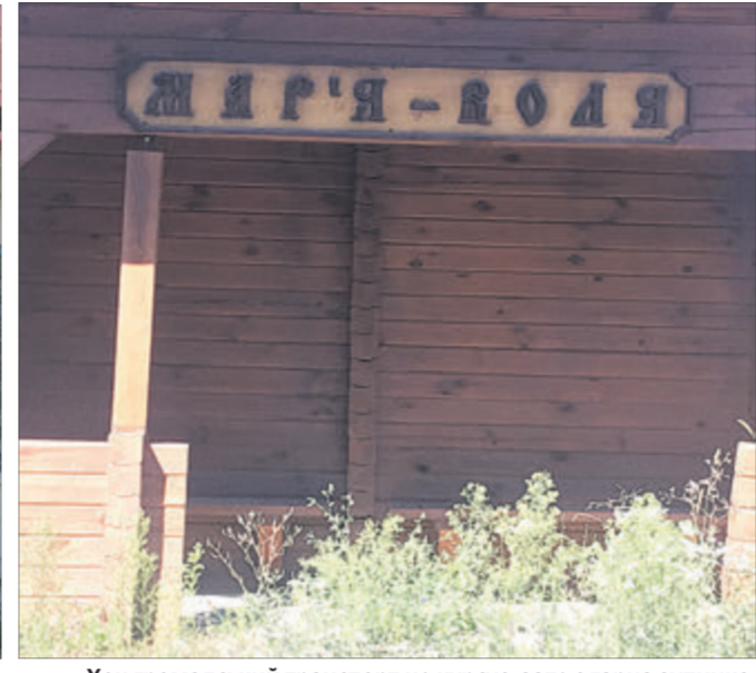
Хоч громадський транспорт не курсує, зате є гарна зупинка.