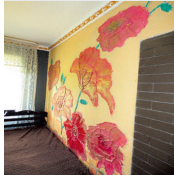
Рельєфно оздоблювати стіни веліманка почала відразу після школи.