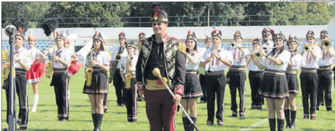
Реконструйована спортарена зустрічала гостей свята мелодіями «Львівських фанфар».