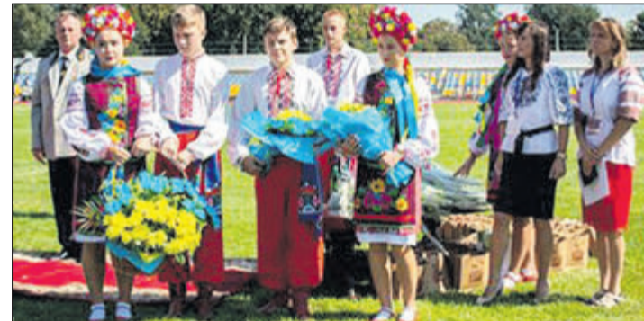
Квіти — до пам'ятного знака першобудівникам міста, меморіальної стели загиблих учасників Революції гідності та АТО і до фотостели Небесної сотні.

сфери та з нагоди 70-річчя часу заснування Нововолинська і Дня шахтаря чимало нововолинців удостоїлися нагрудного знака «За заслуги перед містом» та медалі «70-річчя міста Нововолинська». Це, зокрема, голова міської організації Союзу українок