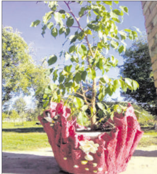
Ось така красива річ із цементу виходить у майстрині.