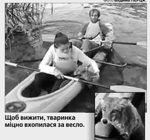
Щоб вижити, тваринка міцно вхопилася за весло.