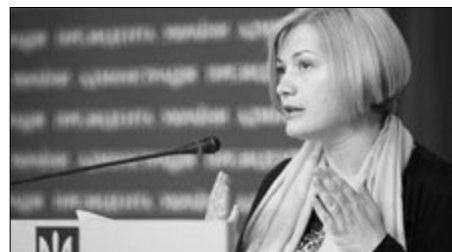
Ірина Геращенко, яка кілька років жорстко вела переговори з росіянами, шокована угодовськими заявами теперішніх наших перемовників.

«Представник України у переговорній групі пропонує росіянам навіть більше, ніж вони просять. «Європейська Солідарність» наголошує, що країна неподільна. Будь-які посягання на територіальну цілісність держави є неприпустимими, а вибори можуть бути проведені тільки після звільнення Донбасу, без тиску, а не під дулами автоматів».