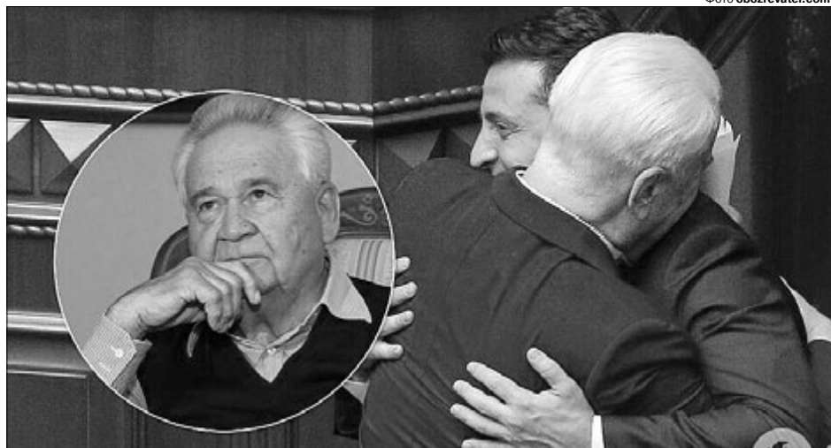
Володимир Зеленський назвав Кравчука та Фокіна «парочкою професійних, потужних українських дипломатів з чітко проукраїнською позицією, патріотичною і збалансованою». Цікаво, над ким жартував глава держави – над нами чи над дипломатами поважного віку?