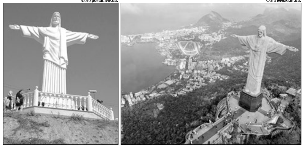
Ліворуч – український Ісус, праворуч – бразильський.