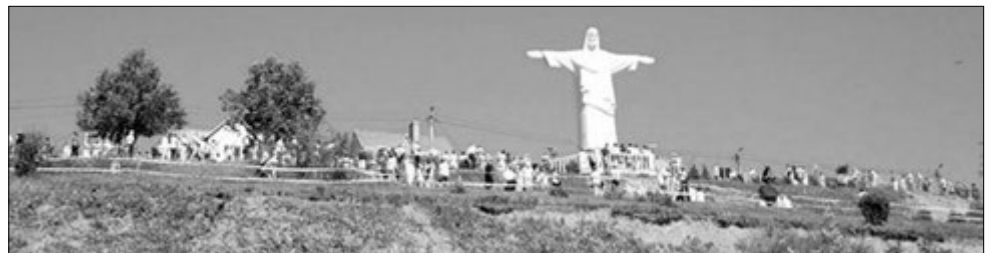
Один із тих моментів, коли величина світлини не може передати величі скульптури в Трускавці.

я виношував змалку. Думаю, що це об'єднуватиме всіх християн і принесе нам мир», — скромно каже чоловік.