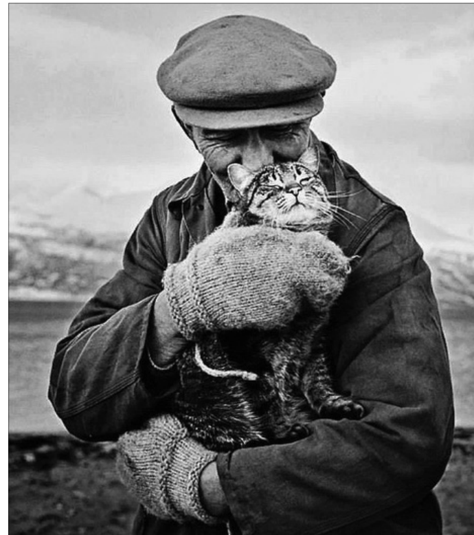
Чи не в кожному дворі могли розповісти, чим він кому зарадив і виручив. Святий, що тут скажеш...