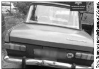
Саме в цьому авто ніколи не вивірюється алкоголь.

Вночі 26 серпня на вулиці Рівненській обласного центру Волині за порушення правил дорожнього руху копи зупинили автомобіль, за кермом якого був уже добряче «веселий» 48-річний водій