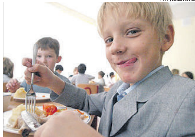
Шкільна їдальня, звісно, не конкурент ресторану, але і там незабаром можна буде посмакувати цікавими стравами.