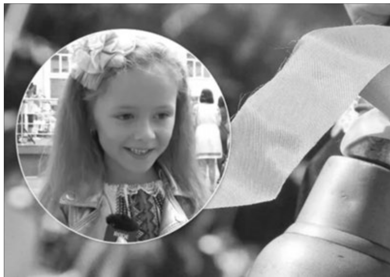
Маленька дівчинка змусила дорослих людей не тільки посміятись, а й задуматись над сенсом життя.