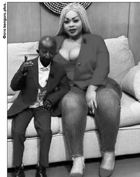
Про цю «солодку парочку» говорить тепер увесь світ.