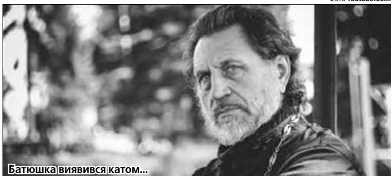
Батьошка виявився катом...