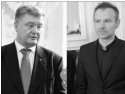
Цікаво, що у списку негодних для Москви депутатів нема жодного представника фракції Зеленського «Слуга народу».

А Святослав Вакарчук написав: «Що можна з цього приводу сказати? Слава Україні!»