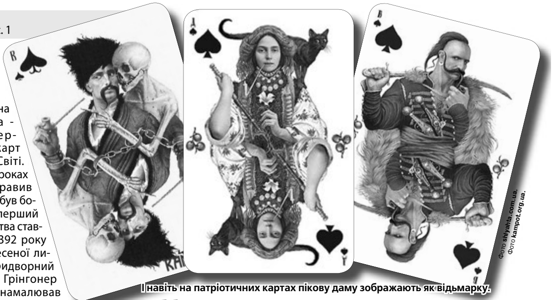
Навіть на патріотичних картах пікову даму зображують як відьмарку.

Оскільки азартні ігри базуються на тому, що гравець повинен приймати рішення, не маючи ніякої інформації, вони сприяють зміцненню витримки, мужності, виховують вміння не втрачати голови в складних обставинах.