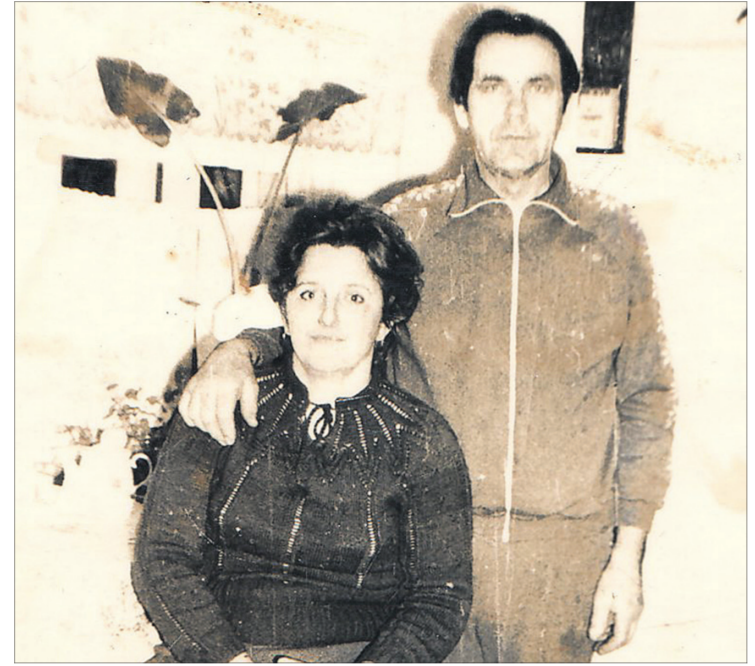
Коли вони побралися, то фотознімки були чорно-білі, але їхнє життя вигравало всіма барвами щастя.