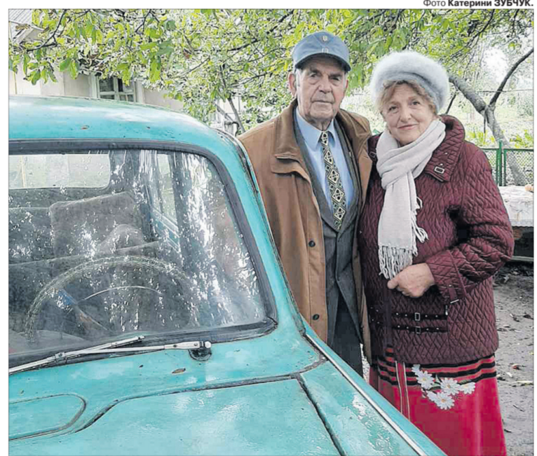
«Москвич», біля якого я сфотографувала подружжя, теж зіграв свою роль у їхній долі.