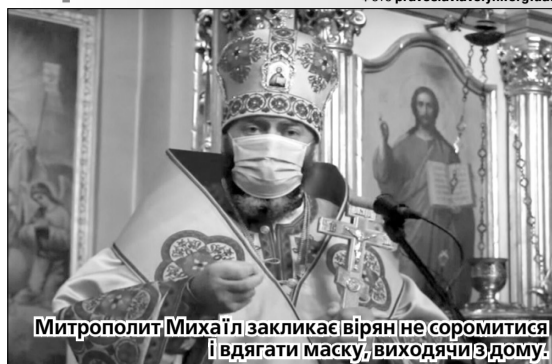
Митрополит Михаїл закликає вірян не соромитися і вдягати маску, виходячи з дому.