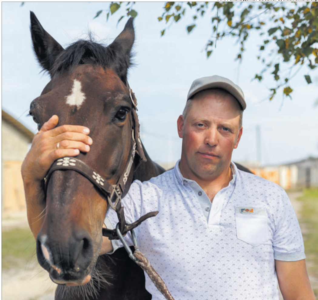
Іпотерапевт переконаний, що катання верхи робить маленьких пацієнтів здоровішими і щасливішими.