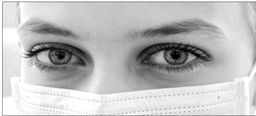
Очі наших лікарів і медсестричок нині рідко сяють радістю. У них — втома і докір усім, хто нехтує вимогами безпеки.

Позначилося на «коронавірусній статистиці» й те, що на Волині стали проводити більше тестів. За попередню добу методом ПЛР обстежено 1081 особу. Тепер такі дослідження роблять не тільки в лабораторному центрі, а й в обласній лікарні. За кількістю нових випадків зараження після Луцька «лідирують»: Нововолинськ — 21, Ківерцівщина — 20,