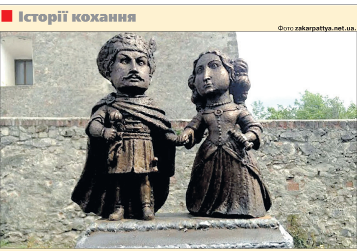
Зворушливе нагадування про кохання Зрині і Текелі — мініскульптура цієї пари на мурах замку.