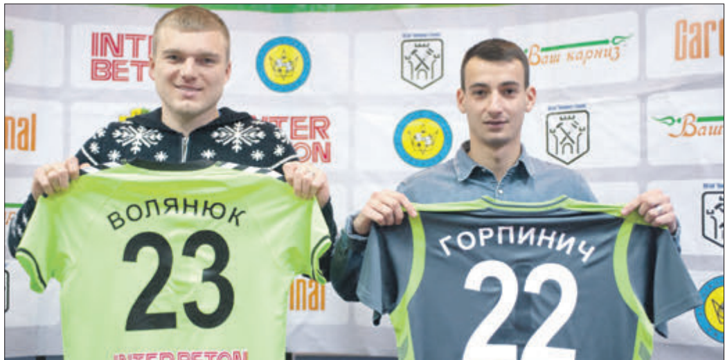
«Кардинали» й так були «о-го-го!», а з Волянюком та Горпиничем стануть ще крутішими!