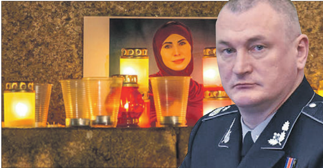
Очільник силового відомства не визнає прорахунків своїх підлеглих.