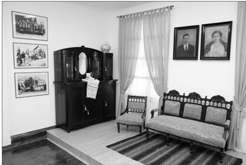
У ці дні експозиційні зали безлюдні, бо надворі тепліше, ніж у приміщенні.

Кому ж на користь такий стан речей? Адже протягом кількох останніх тижнів відвідувачі намагаються скоріше вийти з приміщення музею надвір, де значно тепліше. Тому не вдалося провести у День української писемності та мови захід, присвячений 145-ї річниці від дня народження Богдана Лепкого — відомого літерату-