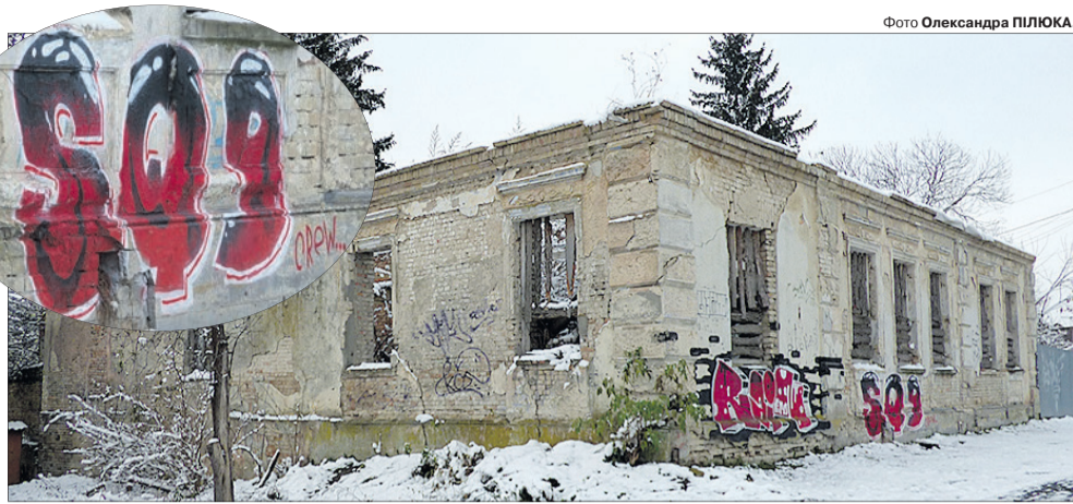
Тривожне «SOS» привертає увагу до пам'ятки місцевого значення (XVIII–XIX ст.).