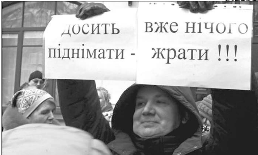
То як вижити з такими тарифами?

Такі пояснення лучан не влаштовують. Люди хочуть вчасно і з комфортом добиратися на роботу чи навчання у час «пік». Тож невдоволені тим, що ввели карантинні обмеження для них, не запропонували альтернативних варіантів. Їхніми проблемами