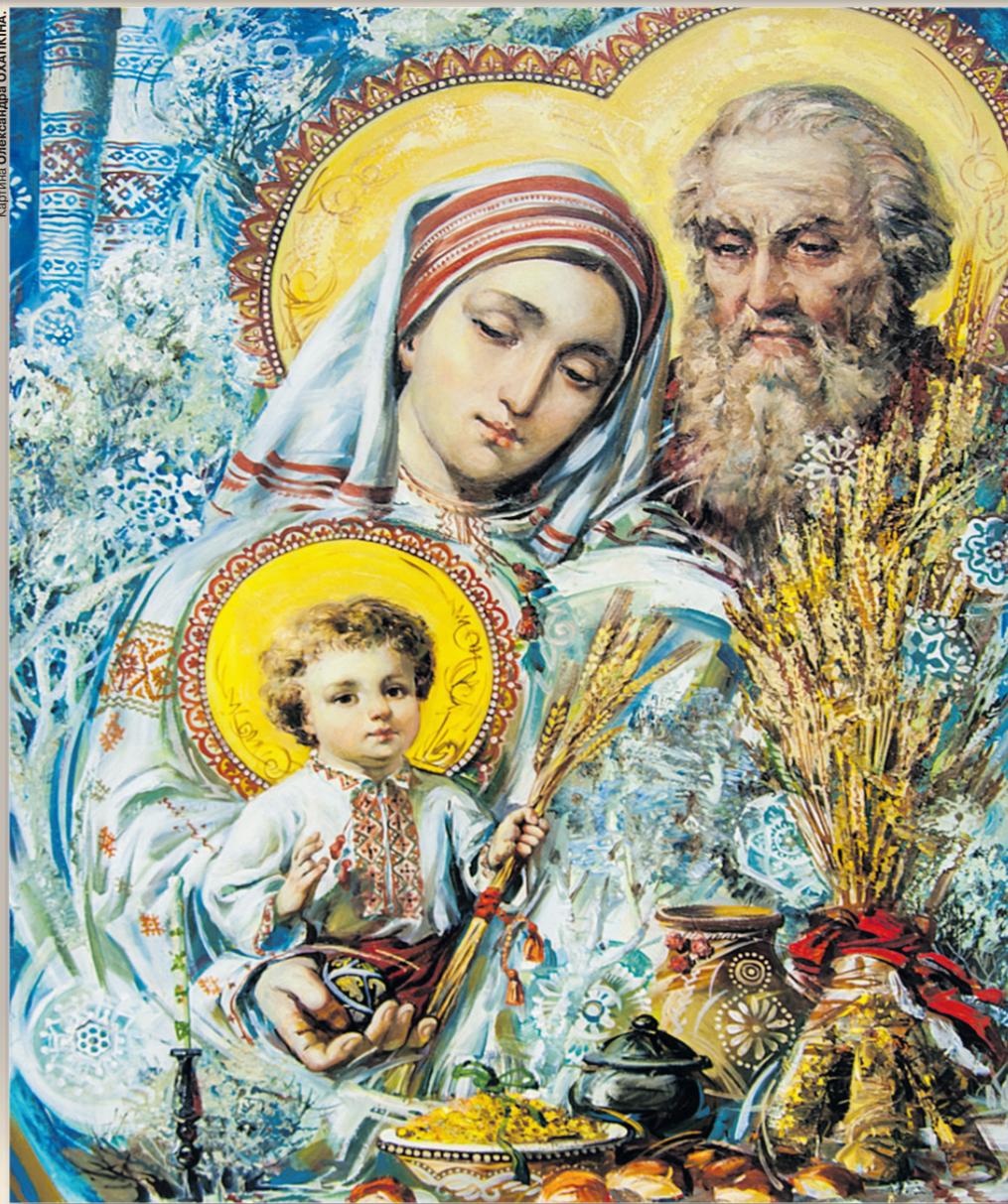
«Різдво. Святе сімейство».