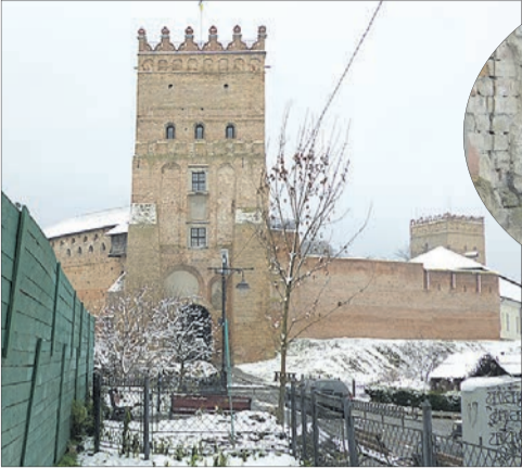
Перед величною В'їзною вежею поки що — глуха загорожа, за якою колись має бути торгово-ремісничий центр.