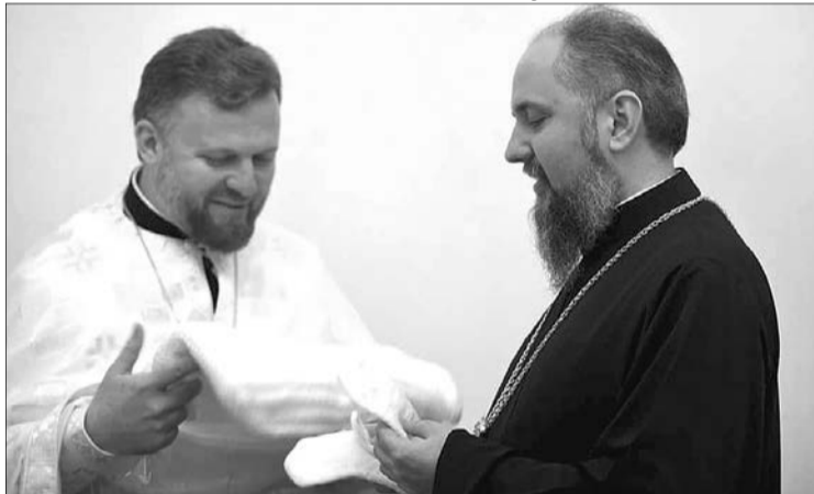
Онук-священник вручив подарунки главі ПЦУ Епіфанію.

«На світанні встаю, молюся, два рази в день читаю Євангеліє (кожного дня), удома в мене чистенько, можете глянути. Люблю все робити сама, навіть як хвороби мучать.»