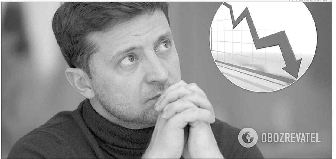
Українці все менше віряють «відосикам» головного кварталівця.