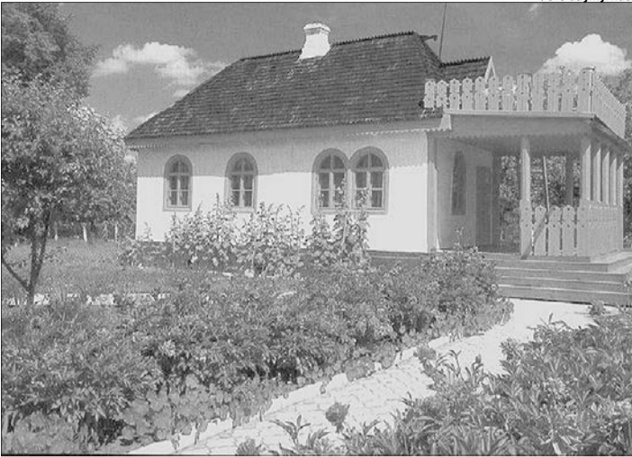
Якщо і далі зволікатимуть – будинки Косачів розваляться.