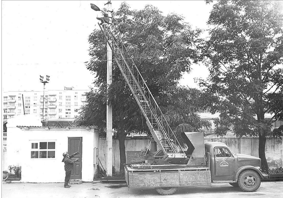
Росло місто, будувалися мережі... Від енергетиків, як, зрештою, і тепер, залежала кожна галузь.