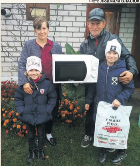
Нинішньої осені фортуна знову усміхнулася Супрунюкам.

* Під подарунком маєтись на увазі придбання товару за 0,01 грн із ПДВ.