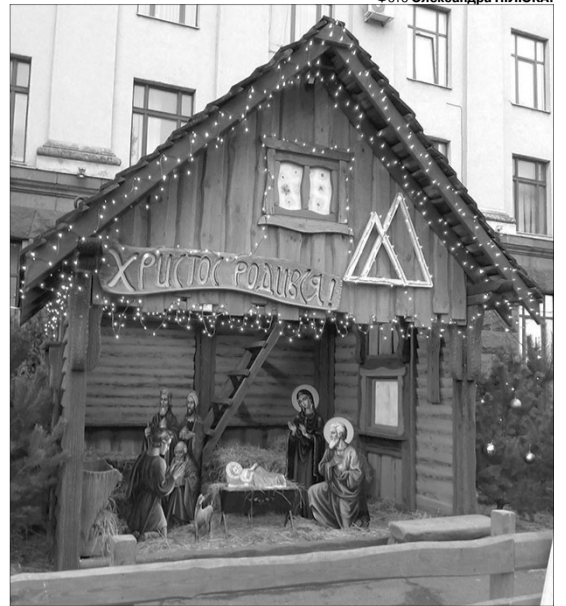
Традиційно шопку встановлюють у переддень Святого Миколая, духовного покровителя міста.