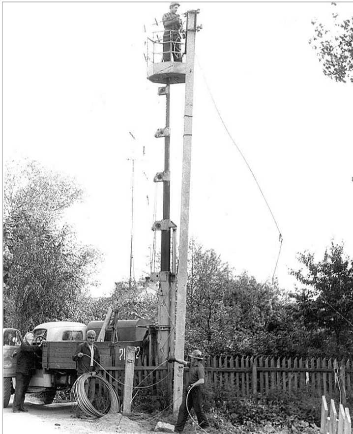
Автовишки, які тепер здаються раритетами, у 1980-х роках дуже полегшили роботу, адже раніше на опору доводилося підніматися по драбинах.

У Луцьку тоді вирувало будівельне життя: якраз запускали підшипниковий, картонно-руберойдовий заводи, меланжевий комбінат. Виростали нові житлові квартали, і всім потрібна була електроенергія. І якщо колегам із