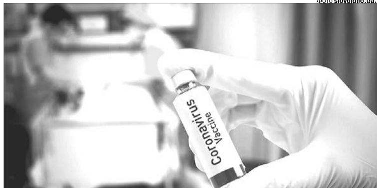
Поки що наші чиновники лише «опрацюють можливості закупівлі препаратів».

— Україна займає 30 місце в Європі за смертністю від COVID-19, — сказав учора міністр охорони здоров'я Максим Степанов під час брифінгу. — Показник смертності від коронавірусу в нас становить 387 осіб на один мільйон населення, у Польщі — 682, у Франції — 932, у Великобританії — 1004. Це — заслуга українських медиків.