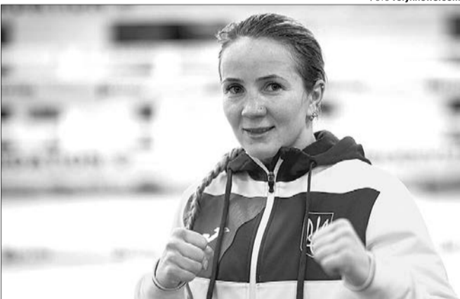
Тетяна Коб – багаторазова чемпіонка України та Європи.