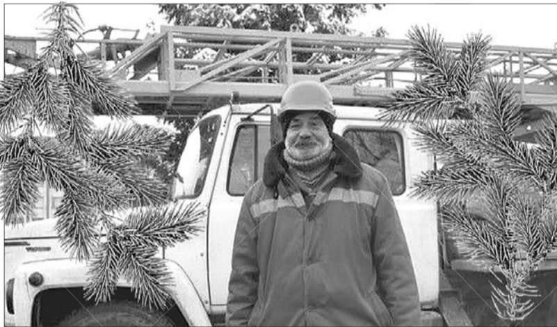
Чоловік пригадує, що спочатку ялинки ставили на центральному майдані біля пам'ятника Тарасу Шевченку, а нині — на площі В'ячеслава Чорновола.