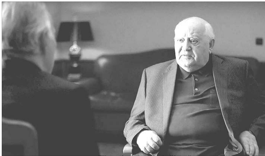
Упізнали такого Михайла Сергійовича?

Якби очільник влади мав дійсно державницьке мислення, то у відкритих магазинах «Рошен» він би бачив нові робочі місця і сплачені в бюджет податки. Але оскільки такого мислення не спостерігається, так і хочеться сказати: «Пане Президенте, та відволічіться хоч на трохи від Порошенка, його магазинів і нав'язливого бажання його