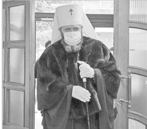
Цієї зими митрополит змінив стиль. Може собі дозволити.

Ця новина викликала у наших душах величезне обурення. Хіба людина не може вдягнутися так, як вона хоче? Хіба в цьому є порушення норм моралі? Невже за роки праці владика Михаїл, не маючи сім'ї, не зміг і не заслужив того, аби придбати собі таку шубу? Ми впевнені, що люди, які зробили це фото та виклали його в соціальних мережах, служать чужинській церкві, а не Україні. Вони