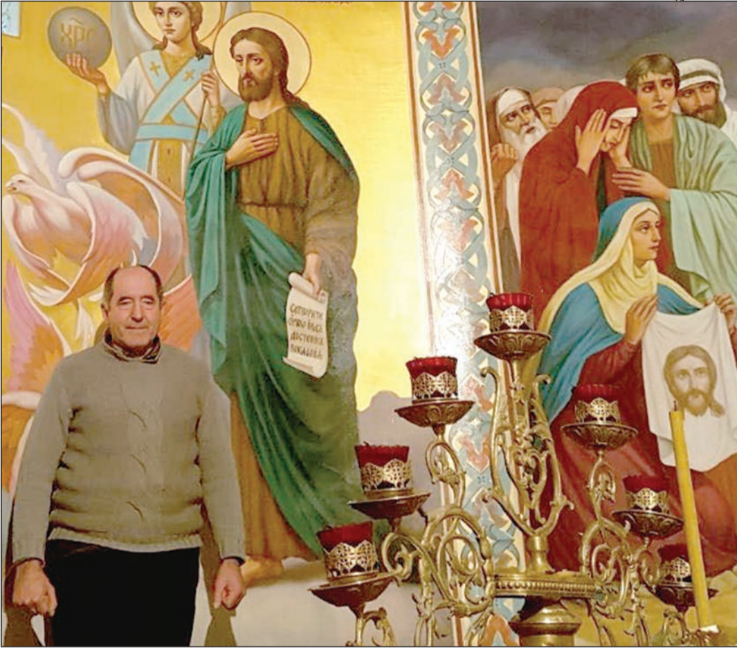
Розписувати храми майстра запрошують у різні куточки Волині.