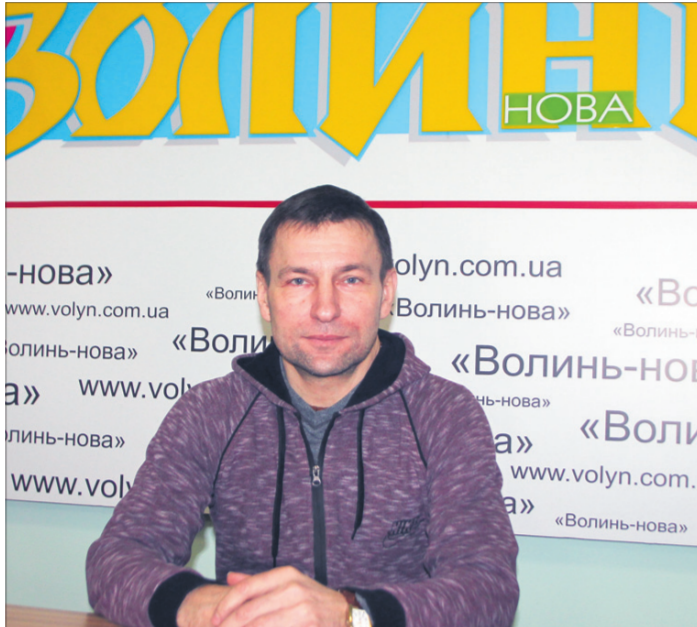
Юрій Деркач в гостях у редакції «Газети Волинь».