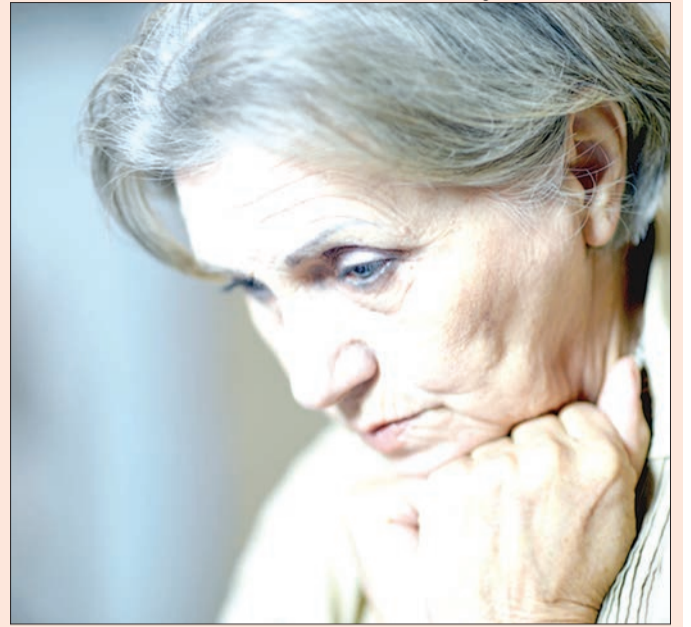
На всі зауваження Семенівна вперто мовчала.