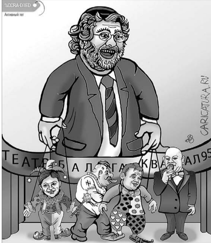
Олігарха часто порівнюють із Карабасом, який крутить своїми ляльками-депутатами, як хоче.

Журналісти звернули увагу на те, що багато з цих нардепів відкрили свої приймальні у бізнес-центрі, пов'язаному з олігархом. При цьому самі обранці пояснили, що створили там свої приймальні для