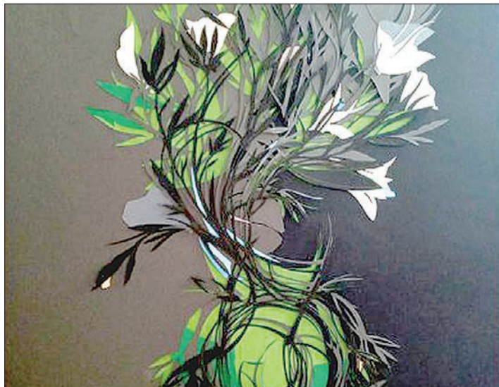
«Коли розпочинаю роботу, забуваю, що в мене в руках лише папір і ніж, малюю папером на папері», — каже Олеся.