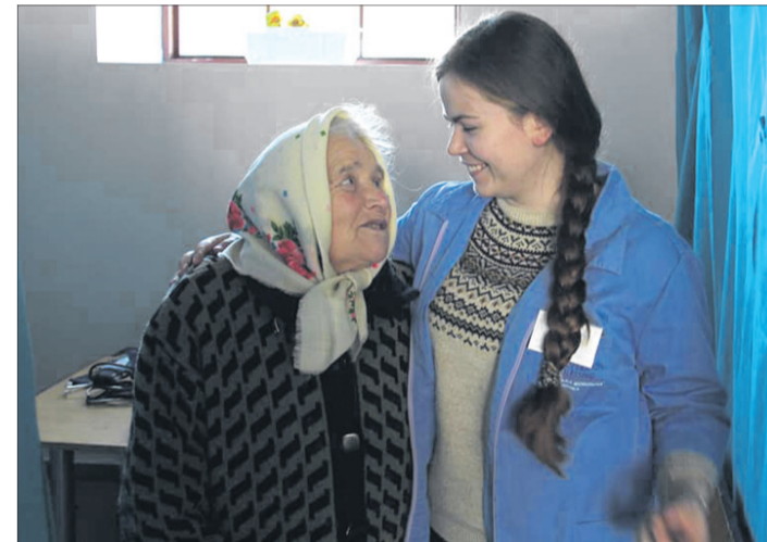
До пацієнтів — із усмішкою.

— Добрий день, можна зайти? Ні, то я, лікар. Та чесно, он навіть мою тонометр та пульсоксиметр у наплічнику. Просто їхала велосипедом 8 кілометрів. У дощ, проти вітру. Ви посидіть, я у вбиральні