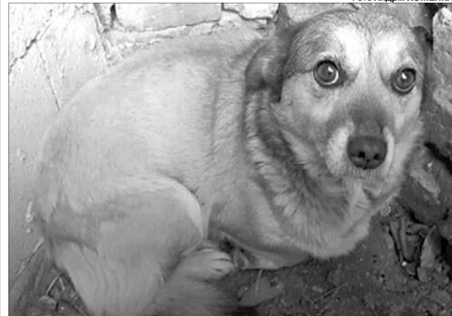
Можливо, господар чотирилапого зараз сумує, як і сам пес.