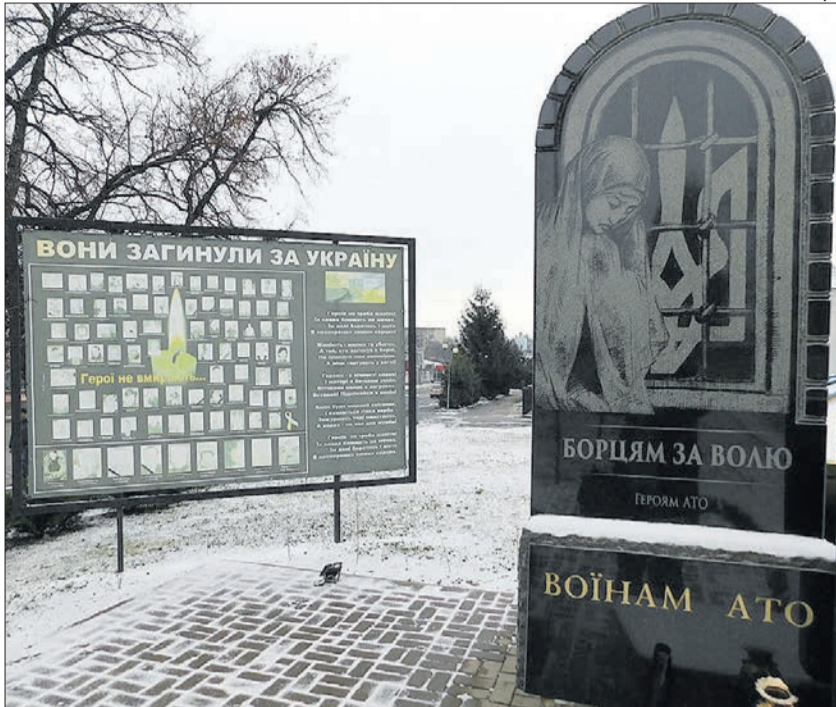
На банері «Вони загинули за Україну» біля Пам'ятного хреста борцям за волю України в Горохові уже важко розрізнити портрети...