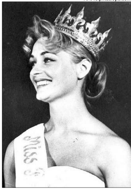
У СРСР такі досягнення українці навіть і не снилися б.