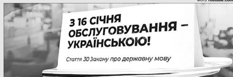
«Панове «слуги» і «господа» з ОПЗЖ: шануйте українську, а не атакуйте!» — закликає п'ятий Президент України Петро Порошенко.