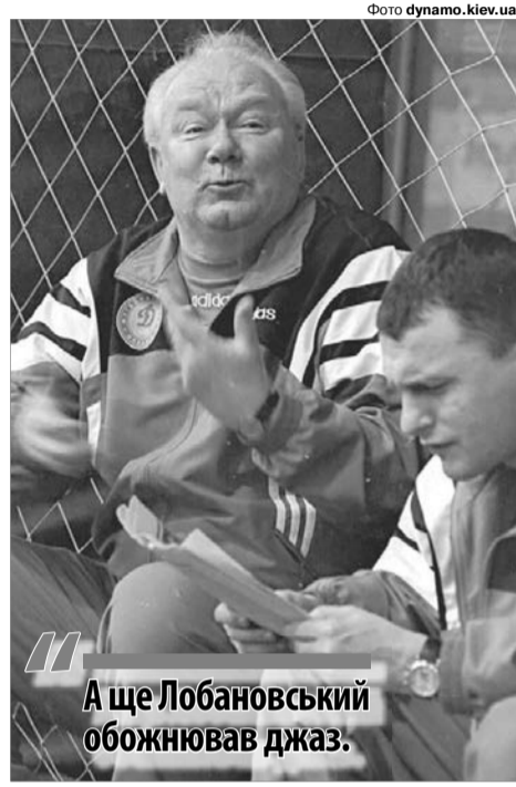
Валерій Васильович мав прекрасне почуття гумору. А його улюблений тост: «Вип'ємо за те, завдяки чому, незважаючи ні на що».

Ще кілька цікавих фактів із біографії найтиту-