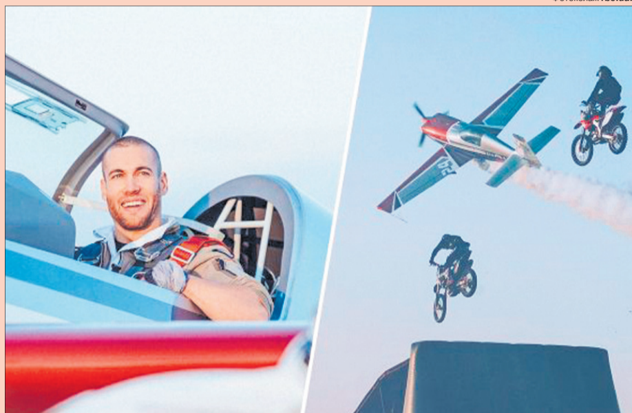
Такий трюк робився на швидкості 400 км/год і на висоті 1 метр!