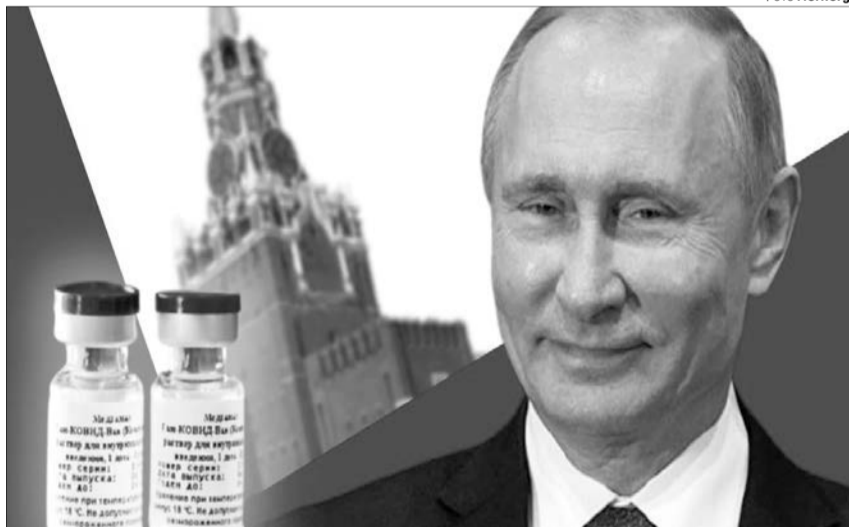
Згідно з опитуваннями, 40% росіян побоюються вакцинуватись вітчизняним препаратом. Не щепився ним поки що і сам Путін. Зате Москва намагається втюхати це «добро» всім на світі.

Недолуга українська ЗЕвлада, яка не змогла оперативно домовитись про якісну вакцину для своїх громадян, фактично підігрує прокремлівським діям в Україні, які активно рекламують російський препарат. Його вони використовують як спосіб із країни-агресора зробити ледь не країну-рятівника.