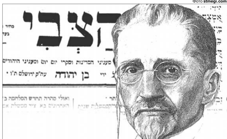
Символом відродження івриту стали слова Еліезера Бен-Йехуда (Перельмана): «Євреї, розмовляйте на івриті!»

Він став викладачем івриту у школі в Єрусалимі і розробив програму для використання мови в побуті та школі, розширив її словниковий запас. А Двора народила йому п'яток дітей, з якими батьки від їхньої появи на світ почали говорити виключно на роз-