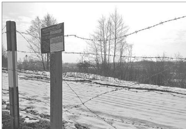
Селяни звикли до колючого дроту, втім торік їх вже огорожували небезпечною стрічкою «геза».