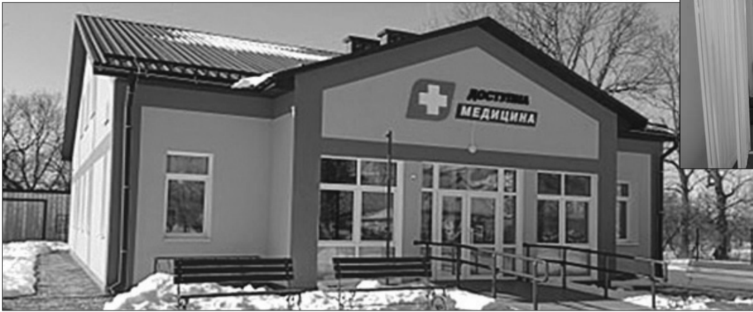
Сільська медустанова нічим не поступаєть міській.