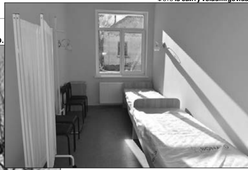
У кабінетах — усе необхідне.

« Амбулаторія оснащена сучасним обладнанням (нові комп'ютери, центрифуга, мікроскоп, монітор пацієнта, тонометри, укладки тощо) та вмебльована. »