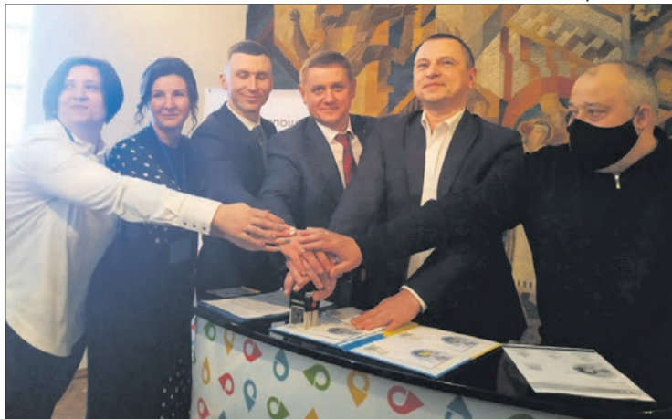
Відтиск унікального штемпеля разом ставили головний поштар області, музейники та чиновники.