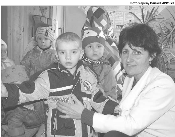
Завідувачка дитсадка: «У нас всі малята обдаровані! Змалку помітно!».

Жінка прислухається до дитячого сміху в групі й додає, що з цікавинками у її житті