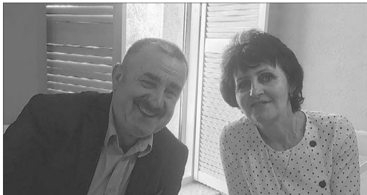
Михайло з Раїсою «побралися» спочатку на сцені.