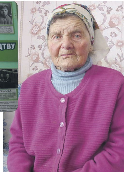
У свій 91 рік волинянка і минуле пам'ятає, і в сучасній політиці розбирається.

«Попри всі труднощі життя, жалкує жінка лиш про одне — що дітей не мала, адже нині так не вистачає поруч рідної кровинки.»