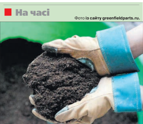
На часі