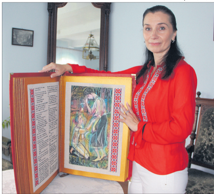
Майстриня з Рівного має унікальний талант – «писати» голкою.

Вона виконана на лляному полотні сірого кольору, виготовленому на Волині. Завдяки