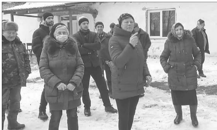
На зустріч із журналістами «Волині» зібралось чимало обурених мешканців.