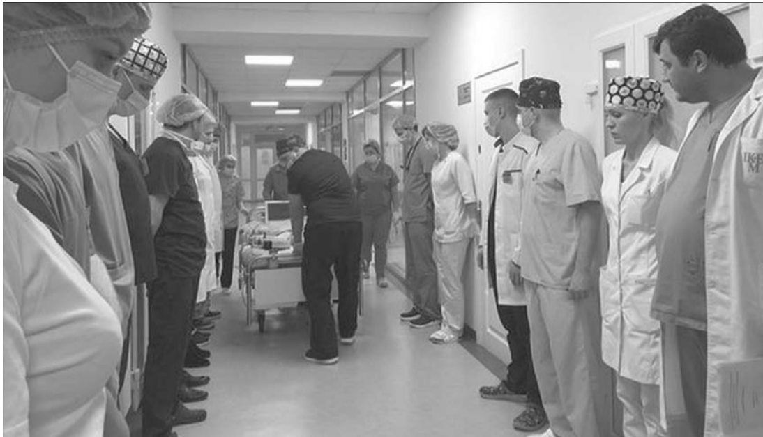
«Коридором пошани» проводжали медики жінку-донора, яка подарувала шанс на здорове життя 4 людям.