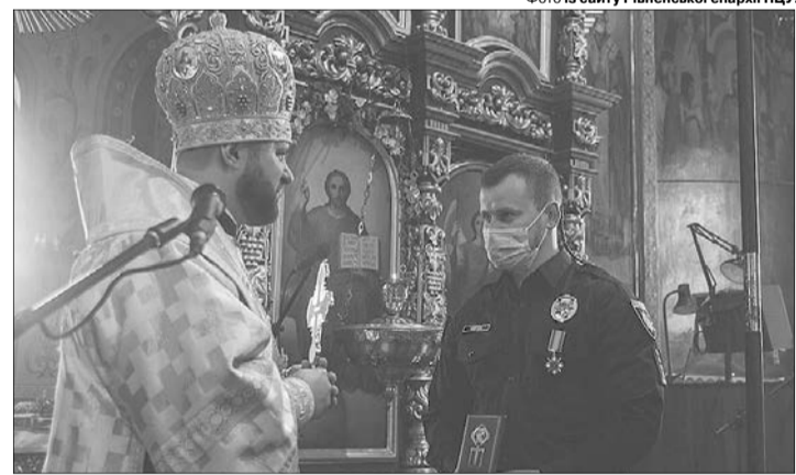
Фото із сайту Рівненської єпархії ПЦУ.