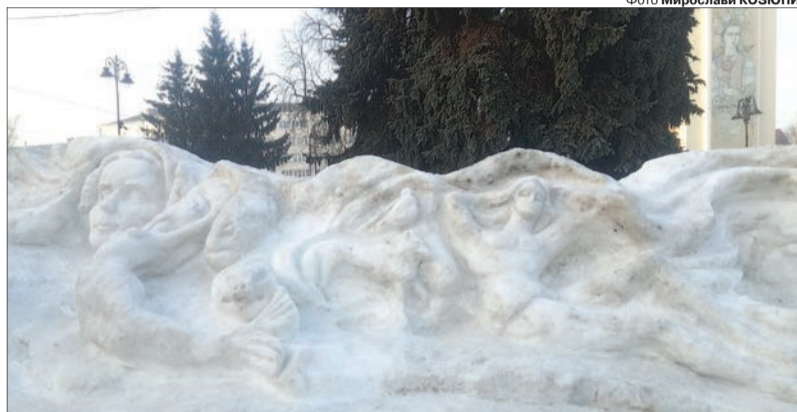
Мистецький витвір залишатиметься на майдані, поки не розтане.

Барельєф залишатиметься в центрі міста, доки не розтане. Але хоч надворі досить потеплішало, наразі він не втрачає форми, лиш виразнішими стають лінії і прозорішими фігури. Увечері льодове панно підсвічується різними кольорами, що додає