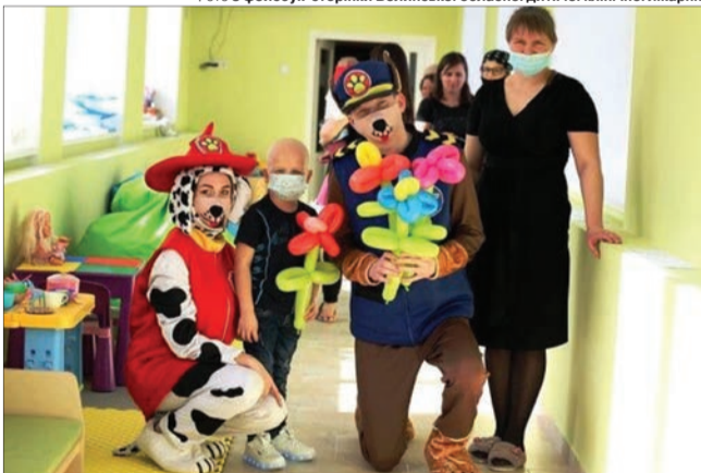
Хай усмішки лікують!