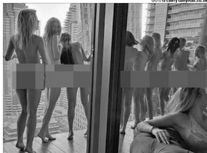
Добре, що їх камінням за таке не закидали за місцевим звичаєм...

Він додав, що Львів повинен бути зацікавлений у підйомі свого національного виробника, і закликав мерів інших міст обирати український транспорт.