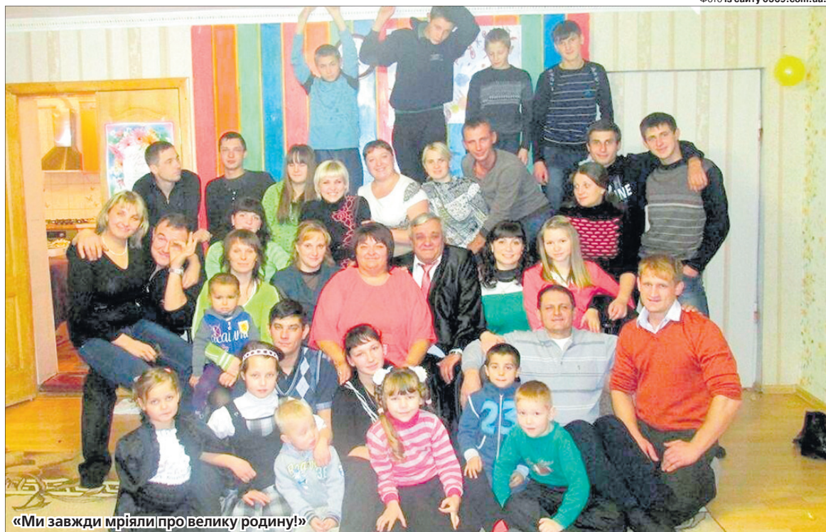
«Ми завжди мріяли про велику родину!»