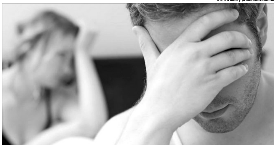
Венеричними хворобами легко заразитися, якщо не дотримуватися елементарних заходів безпеки.

Якщо є підозри, що ви могли потерпіти від наслідків незахищеного сексу, зокрема з'яви-