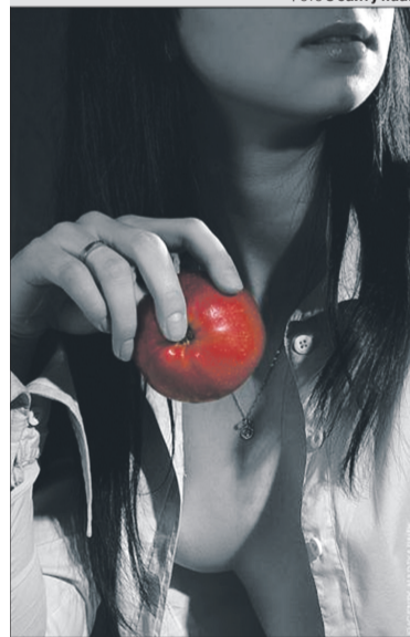
Нелегко встояти перед такою спокусою.