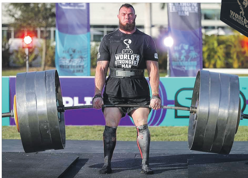
«У фінал на останню вагу вийшло чотири спортсмени. Троє не подужали штанги – потягнув тільки я і встановив новий світовий рекорд», – пригадує стронгмен.