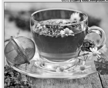
У трав'яних напоїв є чимало цілющих властивостей.