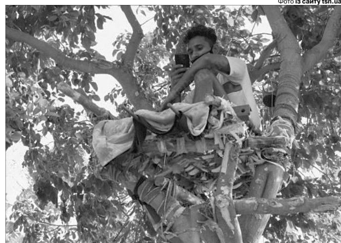
Телефон — найкраща розвага на такій самоізоляції.