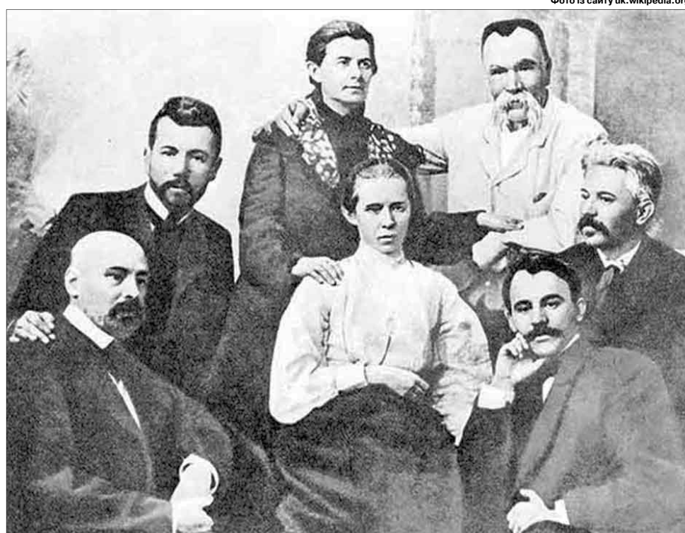
На відкритті пам'ятника Іванові Котляревському в Полтаві 30 серпня 1903 року. Зліва направо: Михайло Коцюбинський, Василь Стефанік, Олена Пчілка, Леся Українка, Михайло Старицький, Гнат Хоткевич, Володимир Самійленко.