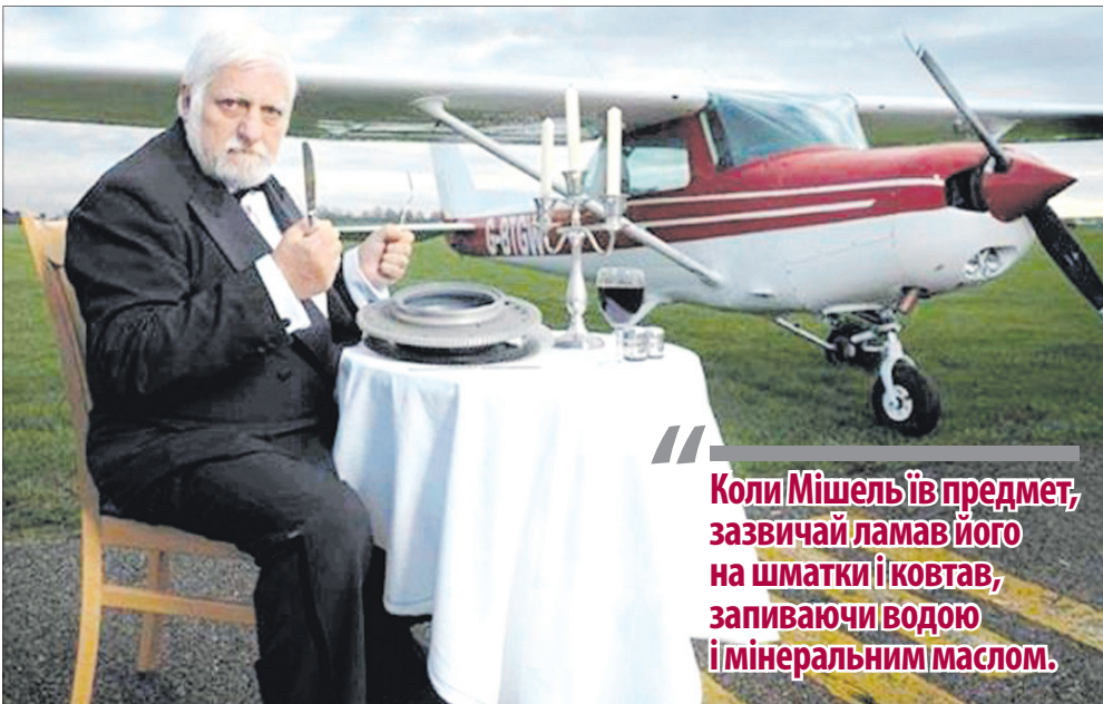
Його називали «мосьє З'їшВсе» або «містером Всеїдним».

Уже в 9 років він схрумав склянку, щоб завоювати прихильність своїх ровесників