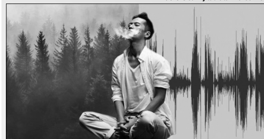
Перебуваючи в тиші, ми даємо головному мозку можливість розслабитися і відновитися.