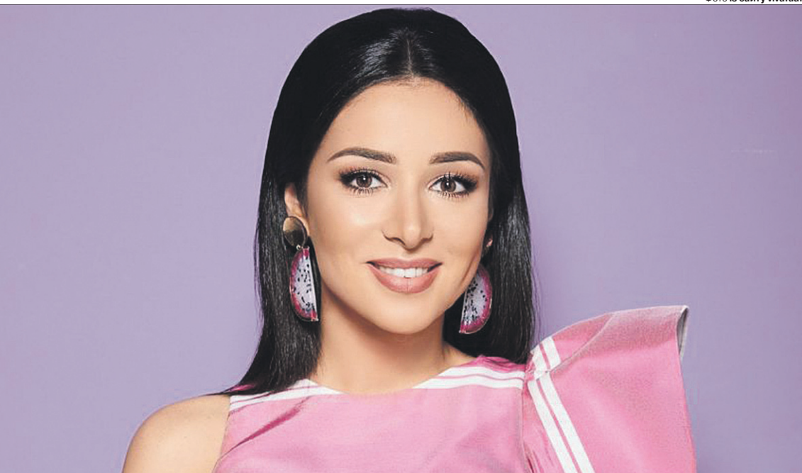
Чи хтось із учасників телепроєкту підкорить її серце?