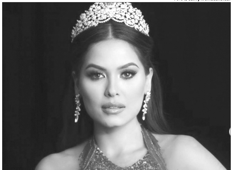
Андреа – вже третя мексиканка, котра здобула корону «Міс Всесвіт».