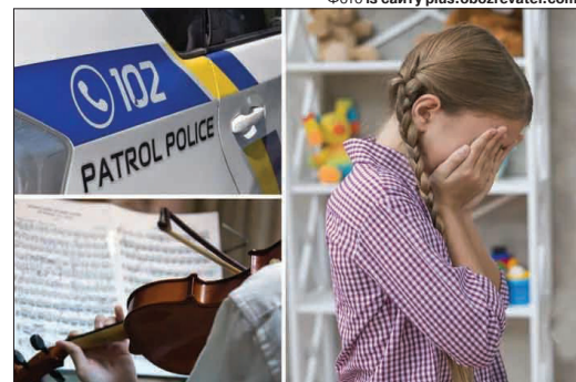
Діти довго не наважувалися розповісти батькам про те, що відбувається в навчальному закладі.