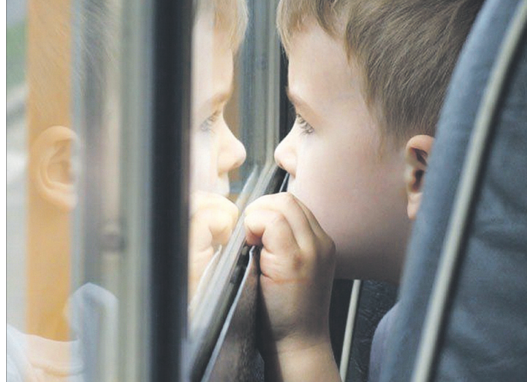
Нащо їм знати про те, який світ несправедливий? Вони ж діти.

Закінчення на с. 9