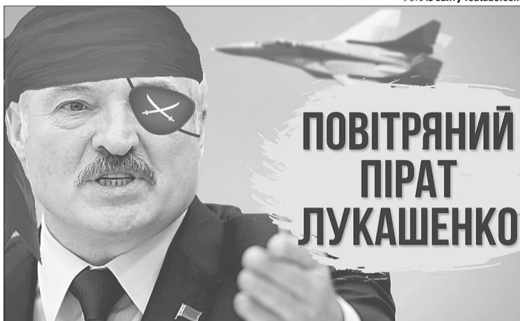
Дурні та негідні дії «бацьки» вигідні Кремлю, бо ще сильніше штовхають Білорусь в його обійми.

вела справу до кінця, то зараз її б теж засудив світ. Зокрема, радник керівника ОП Михайло Подоляк сказав, що зараз уже очевидно: саме РФ свого часу готувала такий сценарій для України — «у вигляді неіснуючої спецоперації». «Із таким самим примусовим сценарієм і подальшою максимальною дискредитацією нашої країни, про що досі щиро шкодують окремі наші «корисні», скажімо так, медійні суб'єкти», — заявив Подоляк.