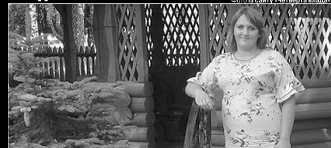
За життя породіллі боролися всі медики нічної зміни.