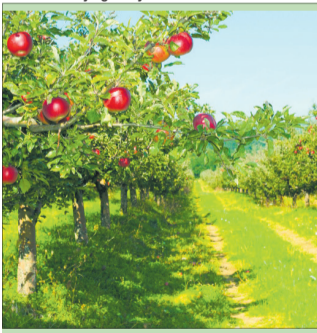
Кісточкові садять на місці яблунь чи груш.