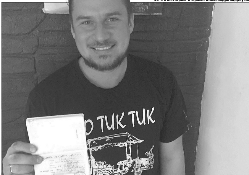
Сповідував біблійне вчення: «Ідіть і навчіть всі народи, хрестячи їх в Ім'я Отця, і Сина, і Святого Духа».