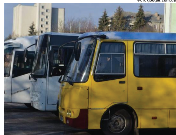
Коли відбудеться конкурс на визначення перевізника — невідомо. Але у Горохівській громаді запевнили, що над цим працюють.