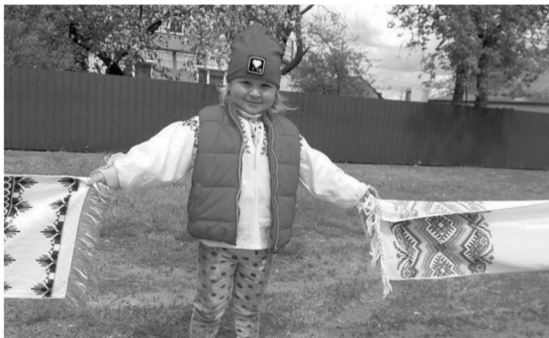
Найменшими учасниками акції стали вихованці місцевого дитсадка.