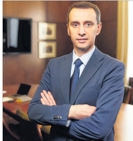
Молодий політик зробив блискучу кар'єру.