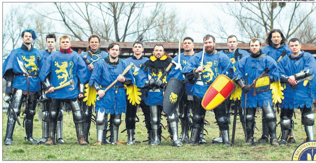
«Перемоги та можливість представляти своє місто, країну на міжнародній арені – для нас головне», – каже боєць.