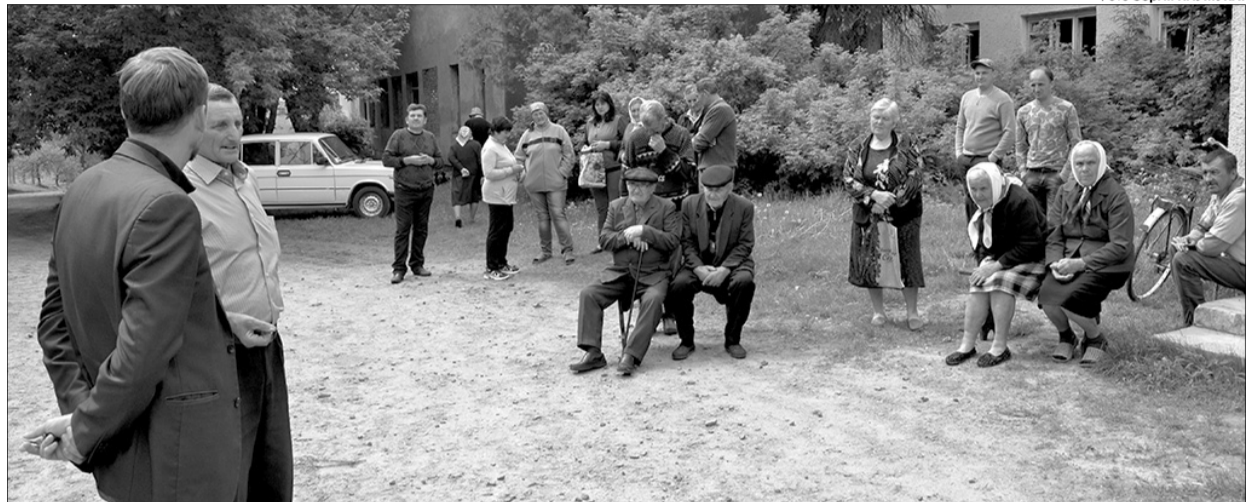
«Де нам пасти худобу?» — це питання хвилює багатьох жителів села.