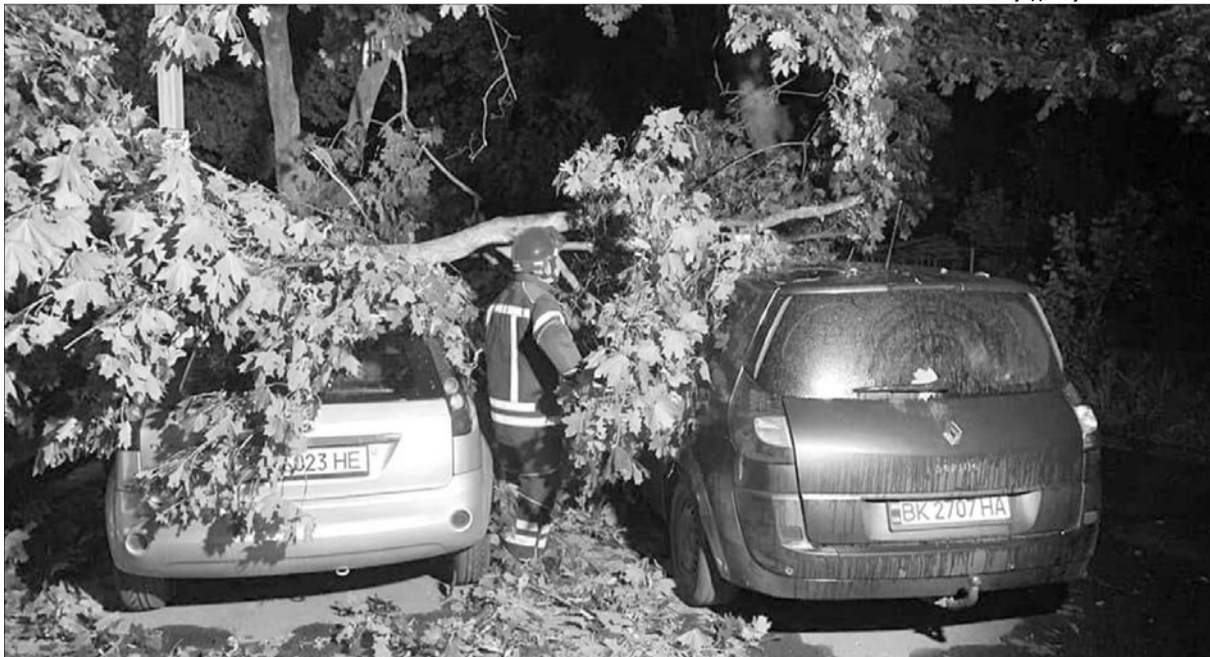
З допомогою бензопили звільняли транспортні засоби.