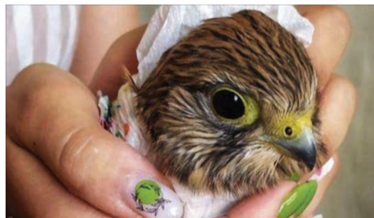
Новий житель звіринця вже звик до людей.

Напевно, віддаватися усьому потрібно з двома буквами «д».