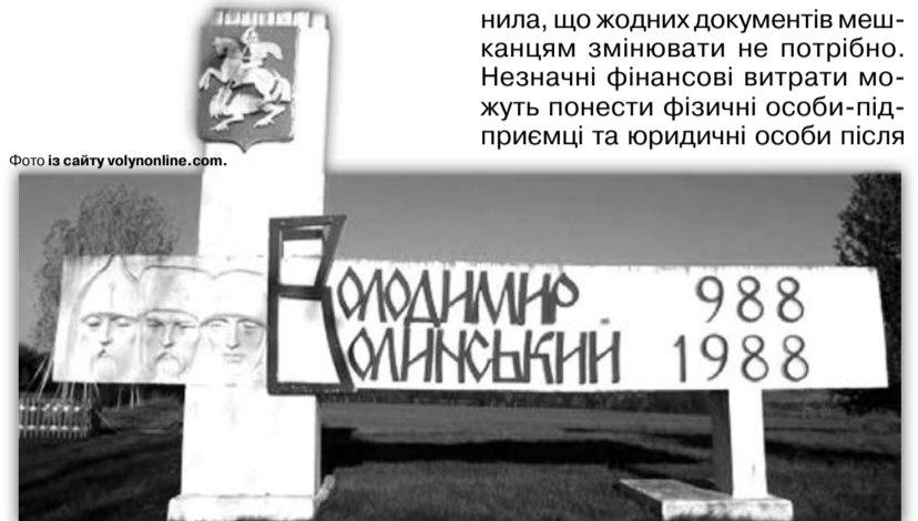
Можливо, скоро в'їзний знак доведеться змінити.

У свою чергу противники змін задаються питанням про вартість