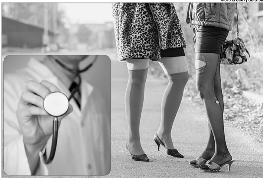
«Лікував» пацієнтів сороміцькими методами... І вони, як бачимо, були не проти.

Тоді зловмиснику оголосили про підозру за ч. 2 ст. 303 (Сутенерство або втягнення особи в заняття проституцією) Кримінального кодексу України, а суд обрав запобіжний захід — домашній арешт.