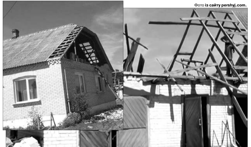
На Ратнівщині руйнівну силу стихії люди відчули у багатьох селах.

повністю без світла залишились Лучичі, Заброди, Якушів, Поступель, Зоряне, Адамівка, Датинь, частково — Ратне, Комарове, Велимче, Межисить, Піски-Річицькі, Видраниця, Замшани, Тур. За інформацією виконувача обов'язків директора Ратнівської