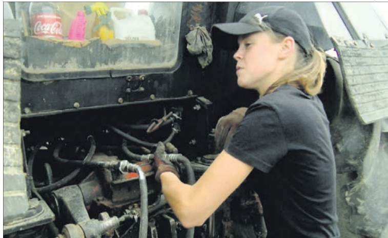
У дитинстві дівчинка зовсім не любила гратися ляльками. У подарунки завше отримувала тракторці і машинки.