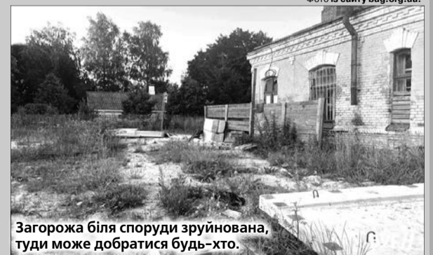
Загорожа біля споруди зруйнована, туди може добратися будь-хто.

Це питання 3 серпня на брифінгу міського голови Ігора Пальонки порушили журналісти. У свою чергу мер зазначив, що вже оформив необхідне доручення задля виконання заходів