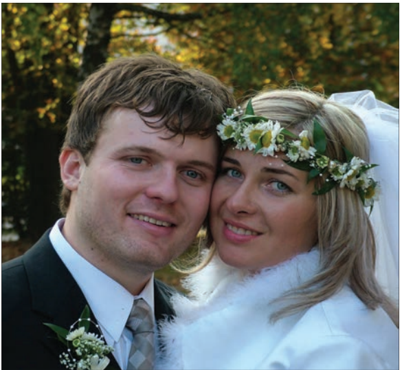
Золотої осені було весілля в щасливої пари.