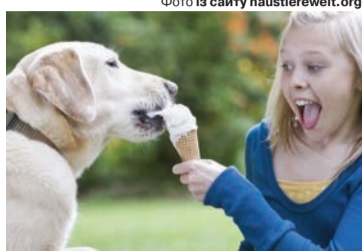
Це і є справжня дружба!