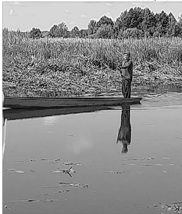
Найкоротший шлях із села Зарудчі до Любешова – по Стоходу.