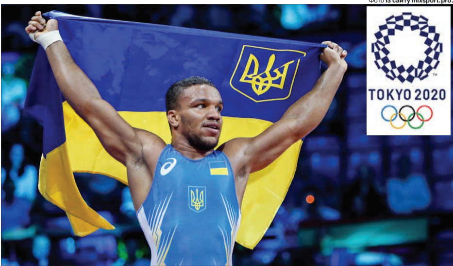
Герою — слава! І дякуємо за сльози чемпіона!