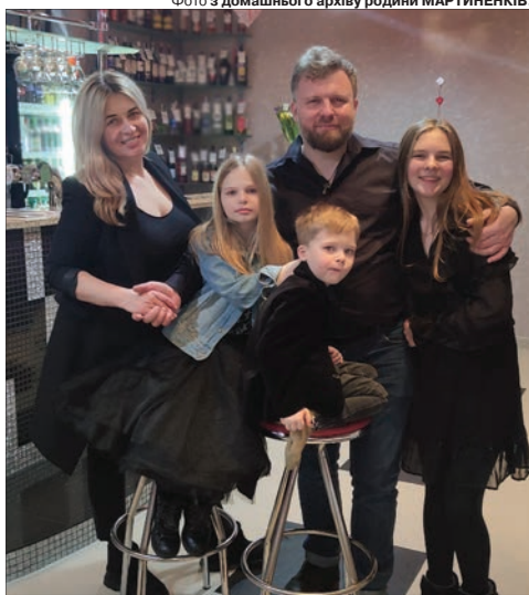
Уже й 13-ліття старшої доньки Марти відзначило сімейство.